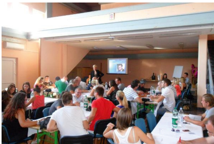
Slika 1. 2nd Young Crew Croatia Workshop 2012

Najvažniji korak u smjeru transformacije postojećih organizacijskih entiteta u Republici Hrvatskoj i njihova strateškog zaokreta nije ponovna dijagnoza poraznog stanja, već kvalitativni odmak