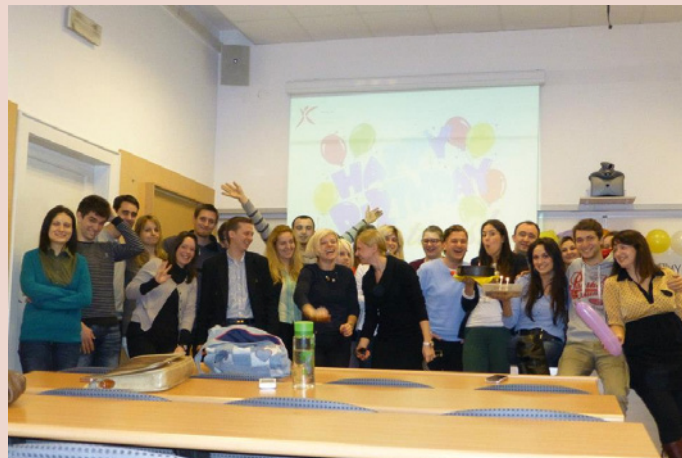
Slika 4. Proslava 2. Rođendana Young Crew Croatia

S ciljem naglašavanja i promoviranja važnosti projektnog menadžmenta, Young Crew Croatia sustavno provodi brojne projekte i događanja koja simboliziraju krunu rada mladih hrvatskih stručnjaka. Protekle je godinu obilježilo sedam značajnih projekata koji su se odvijali u finalnom obliku radionica, predavanja i seminara te koji su ugostili brojne domaće i strane stručnjake. Neka od tih događanja su predavanje prof.dr.sc. Jadrana Antolovića na temu projekata obnove i revitalizacije povijesnih građevina iz travnja prošle godine, kao i predavanje creACTivity koje je vodio Daniel Collado Ruiz, a kroz koje je predstavljena važnost kreativnosti u projektnom menadžmentu. U rujnu prošle godi-