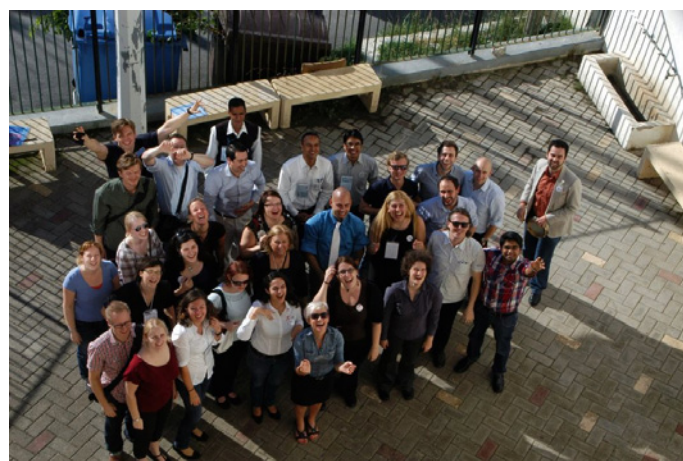
Slika 2. Global Young Crew Workshop 2012, Greece