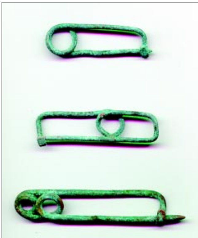
Sl. 2. Fibule u obliku violinskog gudala iz Male gore

Abb. 2 Violinbogelfibeln aus Mala gora