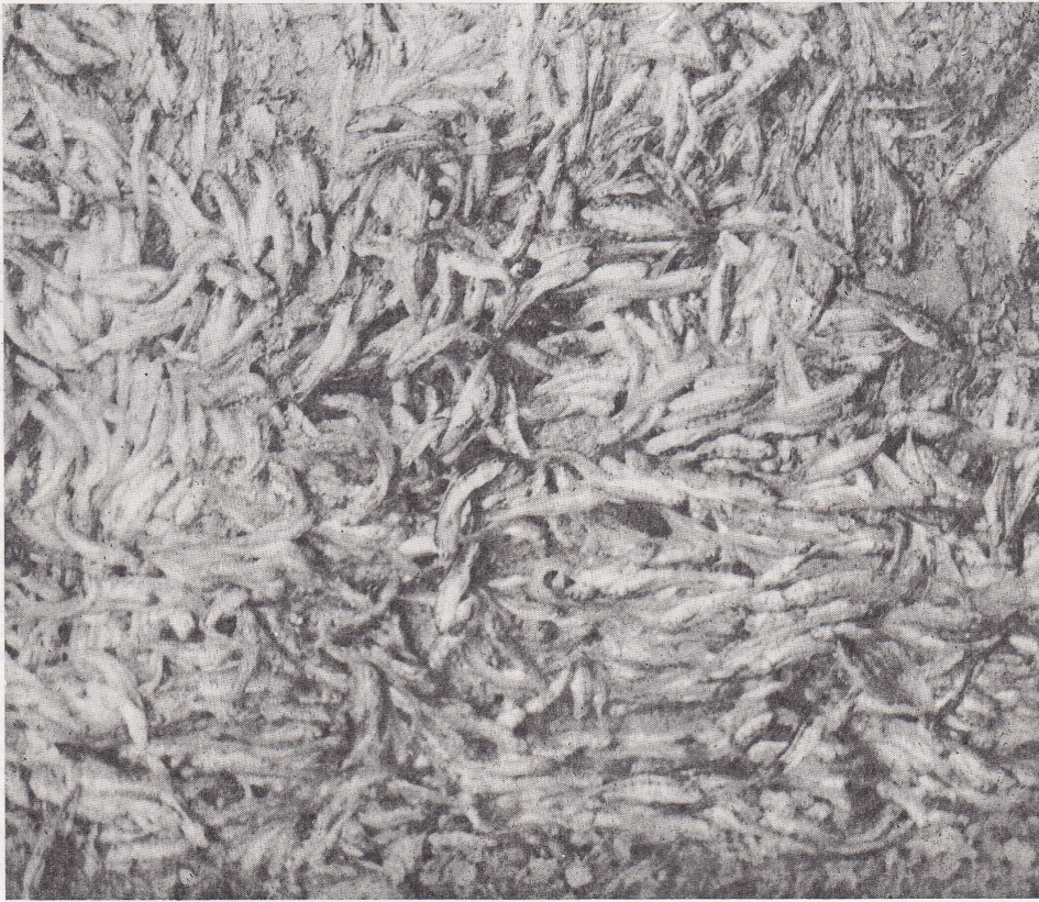
Uginule potočne pastrve.

Ogulinskog sportskog ribolovnog društva, u kojem se uz goj potočne i kalifornijske pastrve, jedino u Hrvatskoj vrši i umjetna oplodnja mladice, koja u