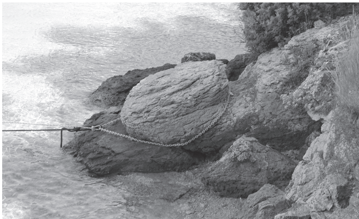
Slika 6 Bitva u Bijaru