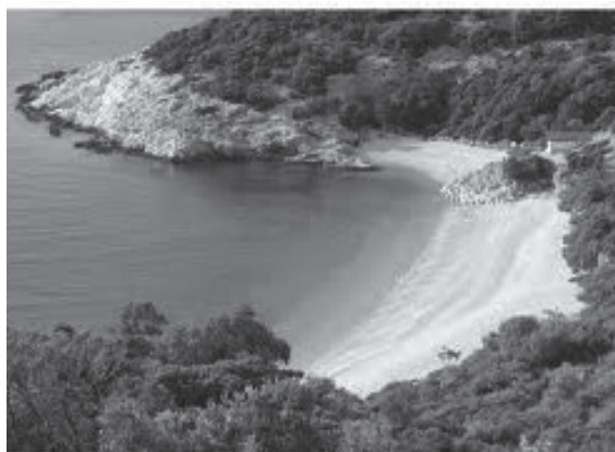
Slika 3 Luka podno Lubenica

Merag (današnja trajektna luka), duboki creski zaljev kao luka grada Cresa ( Crepsa , Crexa ), ostaci pristaništa podno antičkih naselja Polacine i Lovreški (ispod današnjeg sela Loznati) 9 , ostaci rimske vile i pristaništa podno gradinskog naselja Lubenica ( Hibernitia ), ostaci rimske vile i pristaništa na obali u Miholašćici, ostaci rimske vile i pristaništa na obali podno Ustrina, ostaci rimske vile na obali u Nerezinama (Mağazini, Bućanje), rimski ostaci na obali u Studenciću podno Sv. Jakova te ostaci rimske vile na obali u Studenciću kraj Čunskog 10 . Također su postojala i manja antička pristaništa na lošinjskim otočićima Unijama (Mirišće, Malanderski, Lokunji, Maračol) 11 , Susku (Donje Selo), Velim i Malim Srankanama, Iloviku te Sv. Petru.