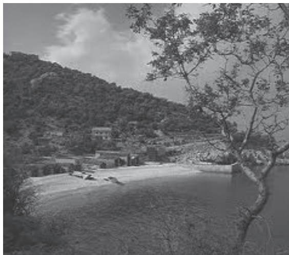
Slika 2 Luka Beloga, Podbeli

Za izgradnju luka na otočju koristile su se prirodno zaštićene uvale 8 kao što su to luka Belog ( Caput insulae ) u uvali Podbeli, luka gradine Svetog Bartolomeja u uvali