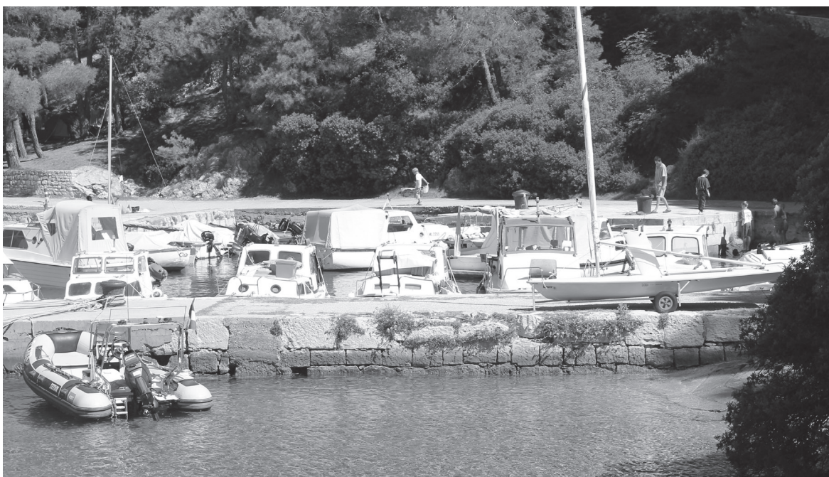
Slika 7 Ostaci mola u Bijaru

razvijanje, uz tradicionalno stočarstvo, i poljodjelstvo koje se temelji na uzgoju žitarica, maslina i loze. Time je stvorena osnova na kojoj će se, uz djelomičnu orijentaciju obalnih naselja na more, razvijati otočno gospodarstvo i u kasnijim vremenima.