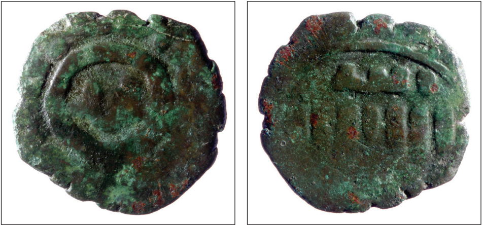
Slika 4. Mamelučki Sultanat, AE fals, al-Malik an-Nāṣir Muhammad I.

Mameluci su bili vojnici-roboti, koji su u srednjem vijeku uspjeli zadobiti kontrolu nad nekoliko muslimanskih država, a sam naziv Mameluci dolazi od arapskog naziva za roba. U muslimanskoj vojsci počeli su služiti u 9. stoljeću. Mamelučki vojskovođe su, pod Ajubidskim Sultanatom, u razdoblju od 1250. do 1517. godine uspjeli utemeljiti dinastiju i zavladati Egiptom i Sirijom. Mameluci su prognali preostale križare s Levanta, a pred njima su uzmaknuli i Mongoli s područja Palestine i Sirije, te su osigurali opstanak arapsko-islamske civilizacije. Htjeli su uspostaviti Egipatsko Carstvo i proširiti moć na Arapski poluotok, Anatoliju i Malu Armeniju (Kilikijska Armenija), a da zaštite južni dio Egipta nastojali su prodrijeti u Nubiju. Mameluci su se učvrstili u islamskome svijetu uspostavivši ponovno kalifat, koji su Mongoli uništili 1258. U Kairu su postavili kalifa pod svojim nadzorom, te su bili zaštitnici vladara u svetim gradovima Arabije - Meki i Medini. Velik uspjeh u ratu i diplomaciji pratio je ekonomski razvoj i obnova Egipta, koji je imao ulogu glavne trgovačke i tranzitne rute između Istoka i Sredozemlja. 73 Križari nisu uspjeli poremetiti odnose između muslimana i kršćana. Nastavila se trgovina s talijanskim gradovima-državama, a lokalni kršćani nisu smatrani odgovornima za križarski pohod. Kroz 13. i 14. stoljeće vrlo su uspješno trgovali s mediteranskim i crnomorskim lukama i Indijom, pa ovo razdoblje možemo smatrati vrhuncem njihove ekonomije. 74