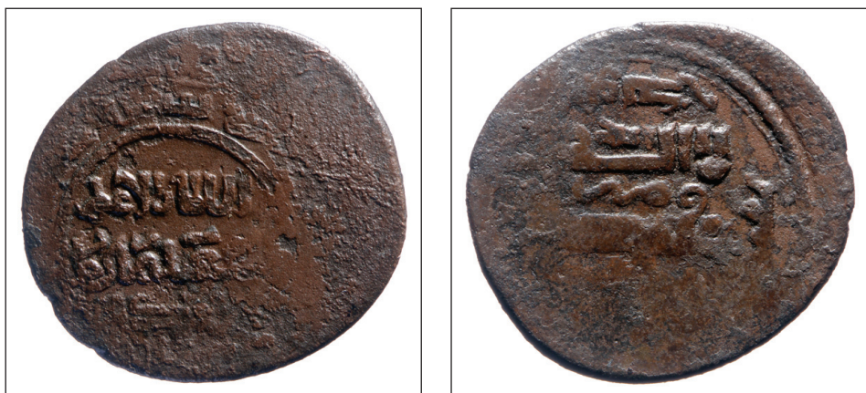
Slika 3. Ilkhanidska država (Ilkhans), AE fals (bakreni novac), Abu Sa'id.

Sljedeći novac islamskih zemalja pronađen u Dubrovniku pripada prvoj polovici 14. stoljeća (slika 3). Taj AE fals, promjera 23,8 mm i težine od 4,04 g, kovan je u vrijeme Abu Sa'ida (1317-1335). Iskovan je u Solṭānīyeh, prijestolnici Ilkhanidske države južno od Kaspijskoga mora. 63 Abu Sa'id je bio jedan od vladara Ilkhanidske države. Kad se raspalo Seldžučko Carstvo, kalifat je stvorio državu na području oko Bagdada i jugozapadnog Irana. Mongoli su htjeli proširiti Carstvo na Mediteran, tj. stvoriti državu od Kine do Levanta. 64 Mongolsku dinastiju Ilkhanida, ili "namjesnika kanova" Velikog Kana u Kini, osnovao je Hulagu.