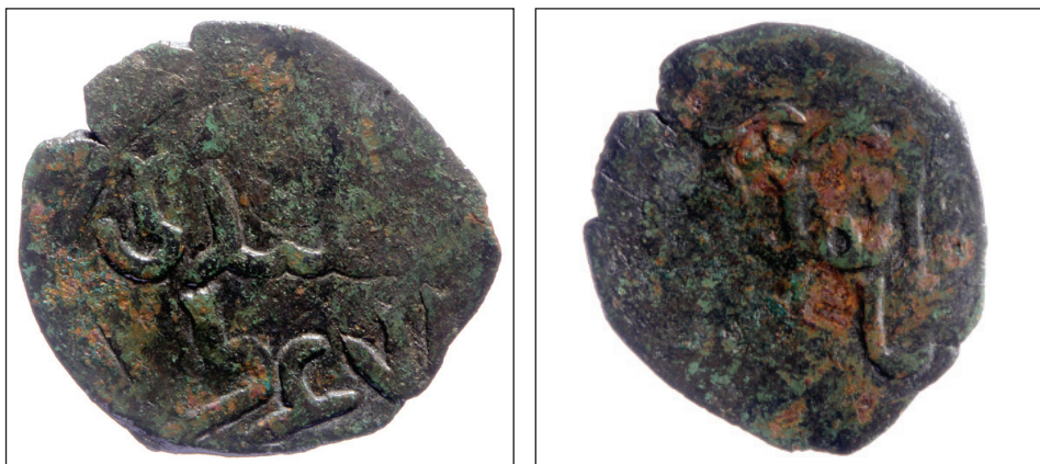
Slika 2. Ikonijjski Sultanat (Seljuq of Rum), AE fals (bakreni novac), Mas'ud II.

Mas'ud II (1284-1308) je bio na čelu Ikonijjskog Sultanata (Iconium ili Konya, Sultanate of Rūm ) 56 koji su utemeljili Seldžuci - ratnička vladarska obitelj