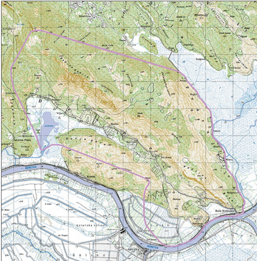
Karta 1. Položaj župe Desne-Rujnica na karti 1:25.000

- spol - mjesec smrti - uzrok smrti. Također su korištene analize mortaliteta i uzroka smrti u neretvanskim mjestima Komin i Rogotin, ali i druge analogije na istočnoj obali Jadrana.