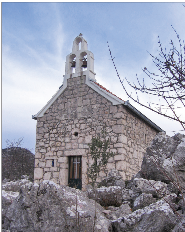
Slika 1. Crkva Sv. Roka na Rujnici

Dragovića Varda i Mala Rujnica. 2 Poslije 1863, odnosno, nakon smrti župnika Šimuna Tomića Romića, sjedište župe seli u Bagaloviće, a župa je preimenovana u Desne-Bagalovići. 3 Iako je župnik bio smješten na Rujnici, gdje se nalazi crkva Sv. Roka (slika 1.), župna je crkva bila Sv. Jurja u Desnama. U upotrebi su bila dva groblja. Za stanovnike desansko-rujničkog dijela župe groblje se nalazilo oko župne crkve Sv. Jurja u Desnama. Stanovnici bagalovičkog dijela župe ukapali su se pored crkve Gospe od Karmela.