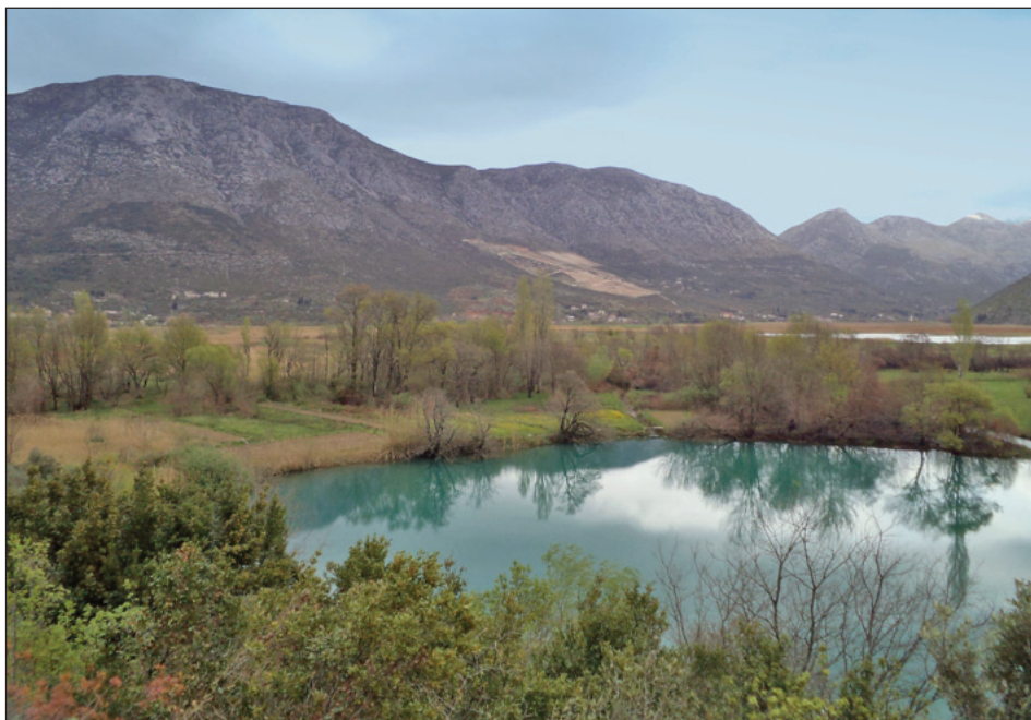
Slika 2. Pogled na Desne. U prvom planu su Modro oko i Desansko jezero

Okosnicu župe Desne-Rujnica čini planina Rujnica, koja predstavlja krajnji ogranak Rilića i pruža se u smjeru sjeverozapad-jugoistok. 4 Sa sjeverozapadne ju strane okružuje Jezero, sa sjeverne i istočne borovačka visoravan i blatije , a s južne brdo Donja Gora, Desansko jezero s rječicom Desankom i okolne obradive površine i jaruge (karta 1). U popisu stanovništva 1857. sva naselja ove župe iskazana su pod Desnama, tako da je cijela župa te godina imala 1.056 stanovnika. 5 Desne se sastoje od zaselaka Marovine, Masline, Kod crkve, Kod kuća, Vrijaci, Strimen, Šišin i Kraj (Medaci). 6 No toponim Desne, odnosno Desna, znatno je stariji. U drugoj polovini 14. stoljeća u više se navrata spominje utvrda Desna i vojna posada pod zapovjedništvom Filipa Nosdronje. 7 Iako R. Jerković Rujnicu smatra komšilukom ili zaseokom Desana, 8 ona se kao selo ( villa )