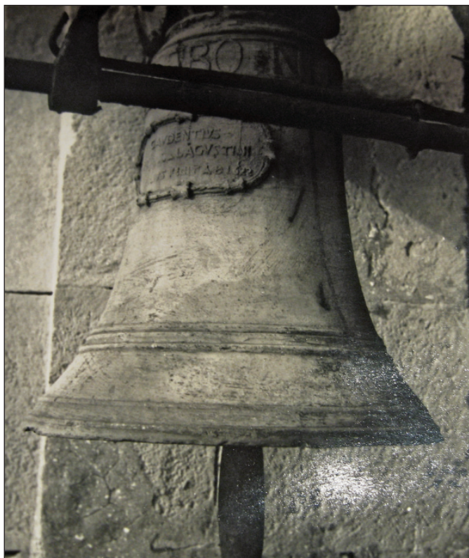
Slika 12. Zvono Gaudencija Lastovca iz 1622

Najmanje zvono ima natpis S. D. Domin. ora. pro. nob. Na zvonu postoji još jedan natpis, koji spominje autora zvona i godinu izrade. On glasi: Gaudentius Fanc. Lagustini Filius. Fecit. A. D. 1622.