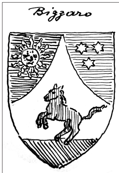
Slika 3. Grb obitelji Bizzaro ( Memoriae , sv. 149, Zbirka grbova heraldičara i crtača Pasarića, DAD-62)

Župnik Lepeš spominje još jedno zvono na kapeli u privatnom vlasništvu. Bilo je to zvono na kapeli Sv. Mihajla koja je bila u vlasništvu Zbora Popovskog u Dubrovniku, svećeničke bratovštine. 67 Namjesništvo se obratilo Ordinarijatu i "brzobjavkom" 6. veljače 1916. U brzobjavu se traži da Ordinarijat bez daljnjeg oklijevanja pošalje "listinu zvona i pojedine iskaze." Na primljeni telegram u Ordinarijatu je zabilježeno da je popis zvona otpremljen odmah sljedeći dan. 68