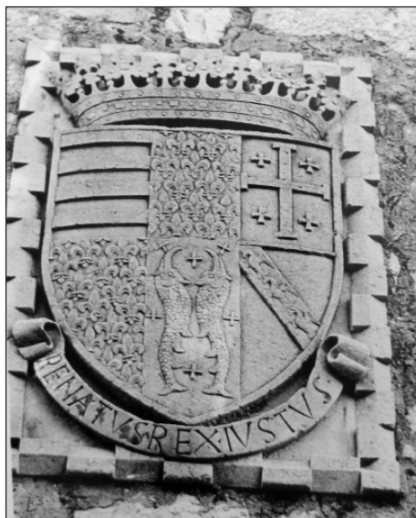
Slika 7. Grb Renea I na Šipanu ( Fototeka Konzervatorskog ureda u Splitu , inv. br. 8).

Po Niku Goravici, župniku u Sudurđu, Arthur Evans je 1878. godine odnio u British Museum donji dio grba na kojemu se nalazila uklesana godina stavljanja natpisa. Na natpisu je Rene tituliran kao francuski, a ne napuljski kralj. Vinko Milić je to objasnio kratkom vladavinom ovog Anžuvinca lenom koje je pridruženo francuskom kraljevstvu. 189 Kako je na natpisu, koji je nastao vjerojatno u drugoj polovici 15. stoljeća, Rene nazvan REX GALLICORVM, vjerojatno je natpis