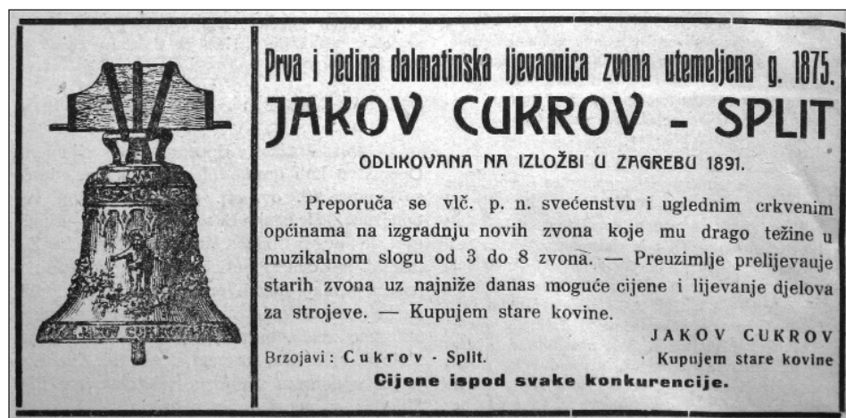
Slika 6. Oglas ljevaonice Cukrov ( Narodna svijest 53 (1924): 6)

Cukrov aktivna je sve do 1935. godine, kada se braća do 1945. godine posvećuju trgovini željeznom robom. Poslije rata, nacionalizirana je cjelokupna imovina obitelji Cukrov. 147