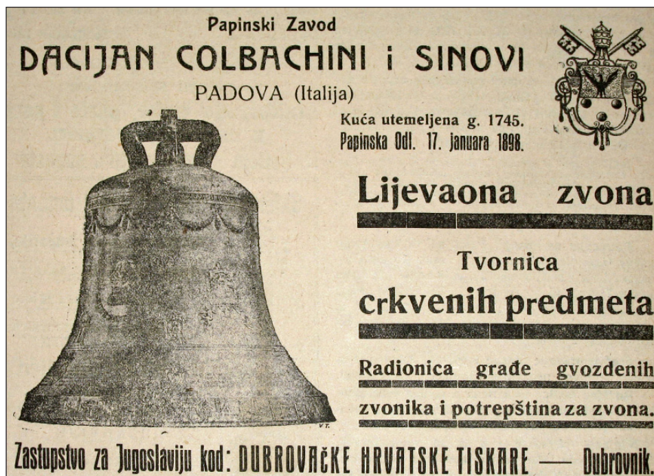
Slika 13. Oglas lijevaonice Colbachini ( Narodna svijest 53 (1924): 6)

Treće zvono oslobođeno prve rekvizicije nalazilo se na kapeli Sv. Mihajla u Trstenom. Kapela je bila u vlasništvu Zbora Popovskoga u Dubrovniku. Na zvonu je bio natpis Colbachini Utini 1817. Opus Romani . Ukrašeno je slikama Sv. Vlaha, sveca s mačem i štitom, Propeća i Bl. Gospe. Nije poznato koji je lijevač salio ovo zvono, jer njegovo ime nije spomenuto. Prema Dočkalu, u prvoj polovici 19. stoljeća u Splitu djeluju Joannes Bassanensis i njegov sin koji je 1832. na zvonu župne crkve u Karlobagu zabilježen kao Colbachini Ioannis Bassanensis Filius . 243