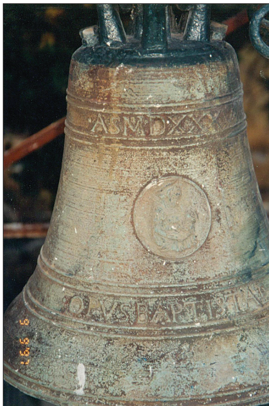
Slika 10. Zvono crkve Sv. Nikole u Donjem Čelu.

Idućeg dana uprava samostana Sv. Dominika poslala je Ordinarijatu točan opis zvona sačuvanih nakon prve rekvizicije. Istodobno, dominikanci su zamolili da se i preostala zvona dalje sačuvaju, jer su “osobite povjesničke vrijednosti” te su salivena prije 1600. godine. Prema priloženome popisu je jasno da su nakon prve rekvizicije sačuvana tri zvona na crkvi Rozarija. Prvo i najveće zvono ove crkve saliveno je 1516. Na njemu je postojao natpis sljedećeg sadržaja: