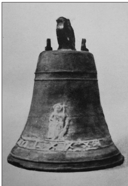
Slika 4. Zvono iz Pločica (preneseno iz: Niko Štuk, »Zvono iz XI. vijeka na Pločicama u Konavlima Kotara Dubrovačkoga.« Bullettino di archeologia e storia Dalmata , 1908, tab. XXIII)