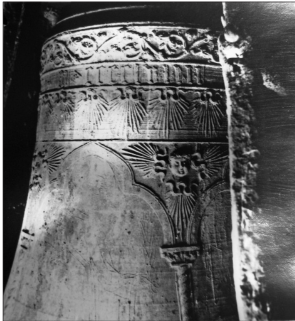
Slika 11. Zvono na Dominikanskom samostanu u Dubrovniku iz 1458

Ivan Rabljanin je očito preuzeo dio starozavjetnog teksta iz knjige proroka Joela (Jl 2,15-16) i odabrano prikazao kao zadaću i funkciju zvona. Osim natpisom, zvono je bilo ukrašeno i slikama Sv. Dominika i Sv. Tome Akvinskog. U opisu se navodi da je sadržavalo “krasne urese”. Manje zvono saliveno je 1458. godine i imalo sljedeći natpis: Bartolomeus Cremonensis fecit . Sadržavalo je i pet slika na kojima su prikazani Sv. Dominik, Sv. Toma Akvinski, Sv. Vinko, Sv. Vlaha i Sv. Benedikt. Kao i prethodno zvono, također je ukrašeno. “Radi svoje starine osobite je povjesničke vrijednosti, a radi krasnih uresa i nakita i umjetnosne je vrijednosti,” kažu dubrovački dominikanci.