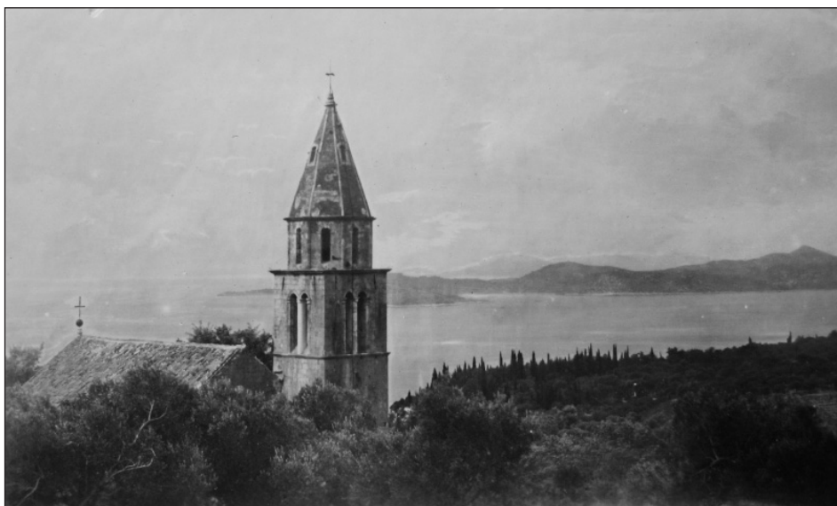
Slika 5. Zvonik crkve Sv. Vida u Trstenom