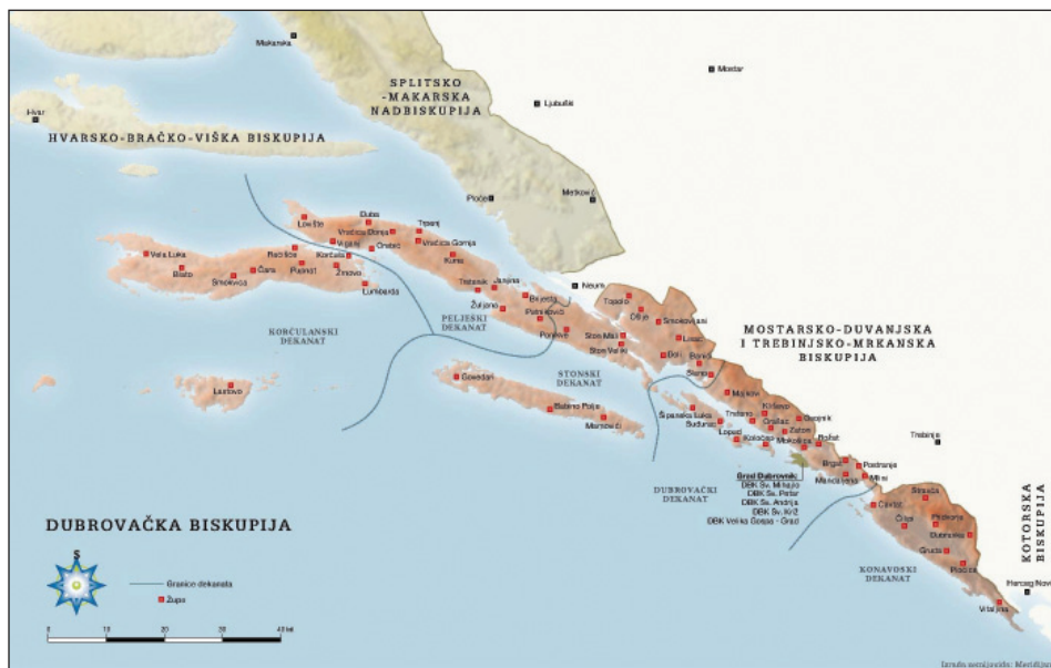
Slika 2. Karta Dubrovačke biskupije (preneseno iz: Jakša Raguž, Ohrabri se narode moj . Dubrovnik: Dubrovačka biskupija; Zagreb: Hrvatski institut za povijest; Samobor: Meridijani, 2011: 8-9)

U Arhivu Biskupije sačuvan je dopis Dalmatinskog namjesništva namijenjen Biskupskom ordinarijatu u Dubrovniku. Datiran je 31. svibnja 1915. godine. Najstariji je to dokument vezan uz ovu problematiku. Njime je Namjesništvo upozorilo Ordinarijat da ubrza akciju sabiranja kovina za ratne svrhe. Ujedno, namjesnik Attems obavijestio je Ordinarijat da u Biskupiji kod većeg broja crkava postoje zvona koja su bila suvišna u svakodnevnoj službi te bi se mogla besplatno ustupiti vojnoj upravi. Ujedno napominje da se i kod popisa, koji bi se trebao obaviti u roku od osam dana, pripazi na smjernice Ministarstva za bogoštovlje i nastavu koje je upozoravalo da se od taljenja sačuvaju zvona povijesne i umjetničke vrijednosti. 11