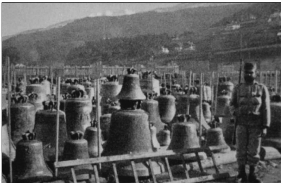
Slika 1. Groblje zvona 1916. godine

“(..). Svetogrgje bi tad ispunjeno. Sotona skinu s crkava zvona pa u zadnjem bijesu paklenog izazova oglušenoj Vječnoj Pravdi, baci ih u plamen i tako te vjesnike Božjeg Mira pretali u zjala smrti i rasula. (...)” 5