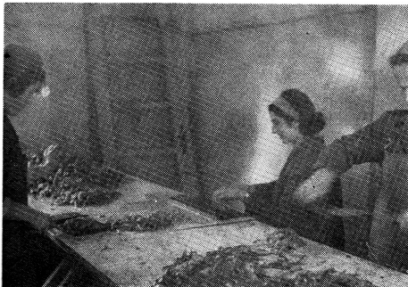
Prerada živih žaba u žablje krakove

U zadnjih 8 godina, a pogotovo od kad je Poslovnica u sastavu Agrokombinata, odkup i promet se povećava i organizira na širem području, zahvaljujući boljim uvjetima rada, financijskim sredstvima, opremi, i dr. Dokaz tome je da Poslovnica učestvuje u izvozu žaba iz SFRJ sa 80%, pijavica 70% i da je preko izvoznika — Udruženja slatkovodnog ribarstva KORNATEXPORT — IMPORT — stekla kod stranih kupaca u Evropi vrlo dobru afirmaciju, kao solidan i siguran partner. Osim stranih kupaca, Poslovnica snabdjeva žabama i pijavicama mnoge naučne institucije u zemlji kroz cijelu godinu, a rakovima hotele i bolje restorane. Da bi se taj posao mogao uspješno vršiti trebalo je riješiti mnoge probleme kod manipuliranja i transporta žaba, rakova, puževa i pijavica.