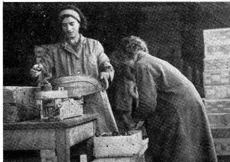
Pakovanje rakova pripremljeni za izvoz

Poznato je, da sve te životinje treba dopremiti do stranog kupca žive i tačno određene dimenzije (u skladu s određenim propisima), a to je naročito osjetljivo tokom ljetnih mjeseci, kod visokih temperatura. Taj problem uspješno se rješava pravilnom manipulacijom životinja u skladištu, izborom najprikladnije ambalaze i sigurnim transportom (kamionima - hladnjače i avioni).