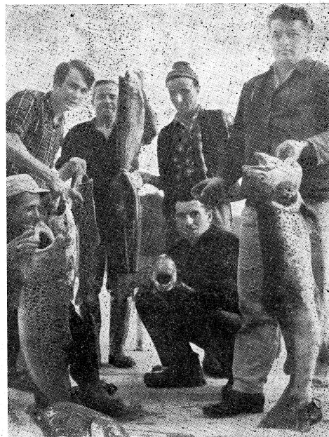
Grupa velikih pastrva iz lokvarske akumulacije

Uz velike primjerce pastrva primijećeno je mnoštvo malih, veličine 15 — 30 cm, veliki broj klenova