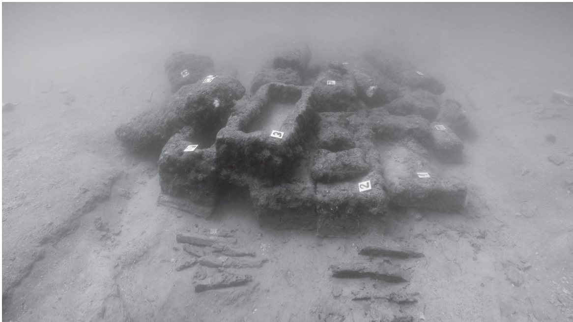
Slika 9. Fotomozaik lokaliteta, pogled s istočne strane