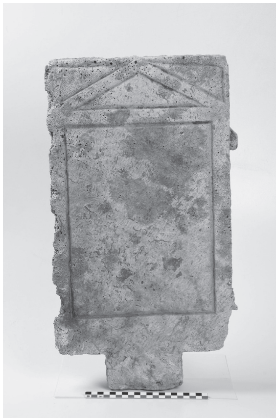
Slika 6. Posuda iz grupe Istočne kuhinjske keramike