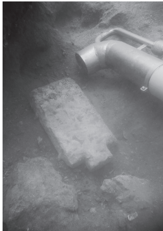
Slika 4. Stela in situ

Lokalitet se nalazi na dubini od 32 m na gotovo ravnom pješčanom dnu, a rasprostire se na otprilike 40 m 2 . Vidljiva su 24 kamena predmeta, složeni u 2 reda, od kojih je donji bio gotovo potpuno u pijesku (sl. 2). Tijekom trogodišnje kampanje iskopan je cijeli pojas oko kamenog tereta širine od 50 cm do 1 m. Dubina kultur-