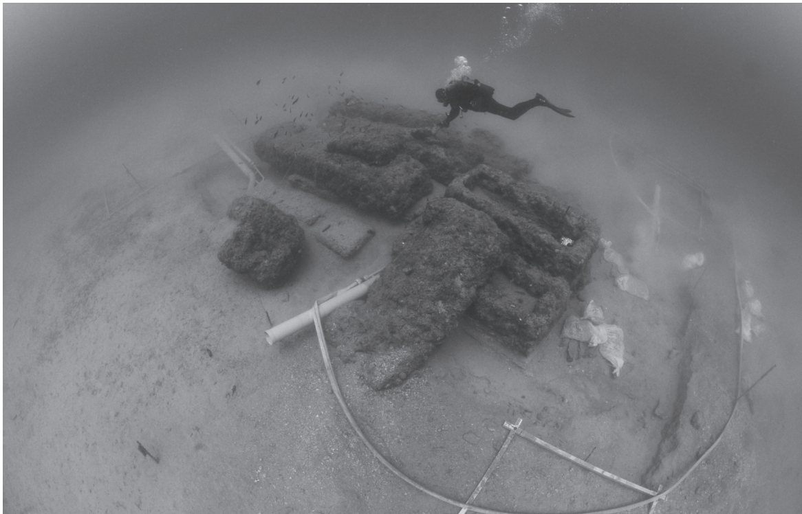
Slika 3. Jugoistočna strana lokaliteta

Treći, nedavno otkriveni lokalitet s teretom sarkofaga nalazi se kod Sutivana na otoku Braču.