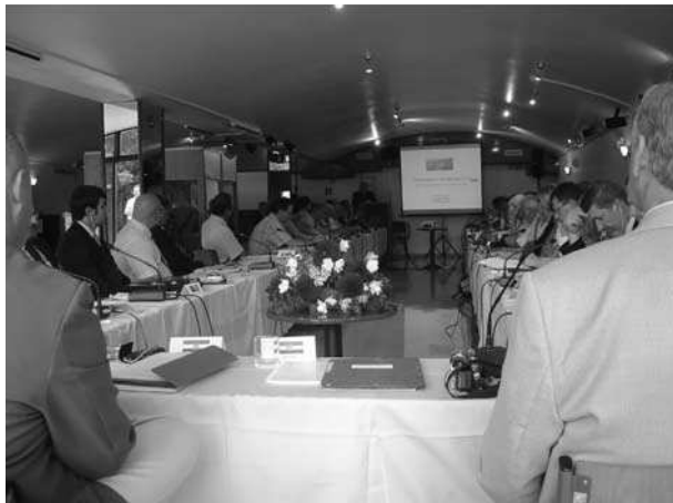
Slika 5. Radna atmosfera skupa Fig. 5. Meeting in session