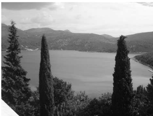
Slika 6. Panorama akvatorija Slano/Dubrovnik Fig. 6. View of Slano/Dubrovnik

edukativnim visokoškolskim programima s razmjenom iskustava i mobilnošću studenata.