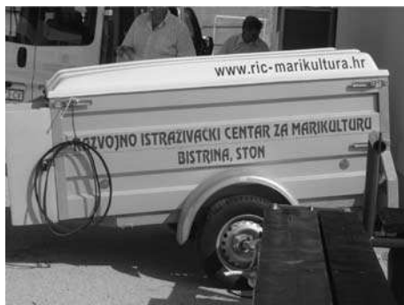
Slika 3. Domaćin skupa Fig. 3. Host of the meeting