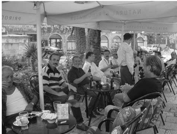
Slika 8. Trenuci predaha Fig. 8. Break

S aktivnostima NACEE-a upoznati su FAO, koji ga i financijski podržava, te EU.