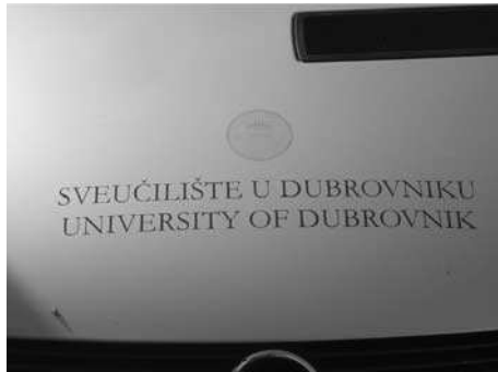
Slika 2. Organizator skupa Fig. 2. Organizer of the meeting