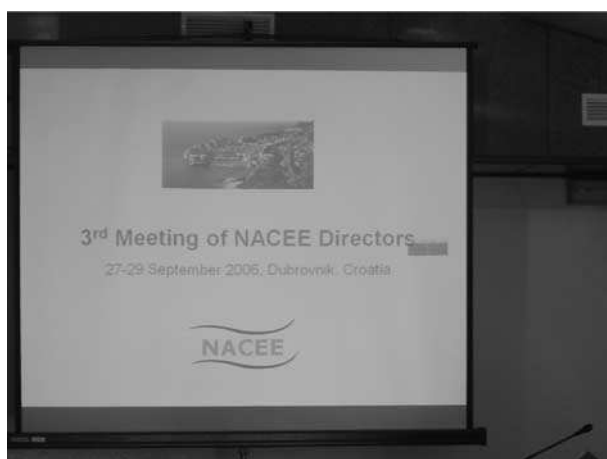
Slika 1. Treći sastanak NACEE Fig. 1. 3 rd meeting of NACEE

Glavno tijelo NACEE-a s pravom odlučivanja jest Vijeće direktora koje se okuplja jednom godišnje u nekoj od zemalja članica. Iako bez prava odlučivanja, u pratnji službenog predstavnika na sastancima sudjeluju i cijeli timovi pojedinih institucija. Do sada su održana tri takva sastanka. Prvi sastanak od 21. do 24. studenoga 2004. održan je u Szarvashu u Mađarskoj, a drugi od 8.