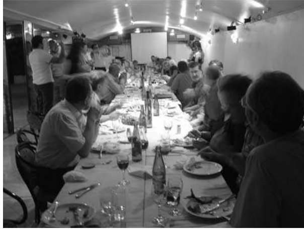
Slika 7. Trenuci okrijepa Fig. 7. Relaxation