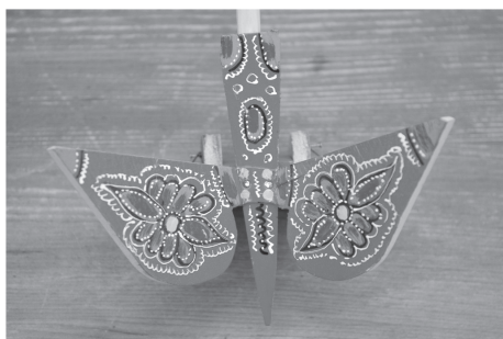
Sl. 8. Drvena igračka leptir, “leptirek” (G. Stubica)

I danas omiljene igračke za mlađi uzrast djece, leptire, “leptireke” na kotačima djeca vuku, dok igračka pomičnim krilima lupa uz zvuk klopotanja (sl. 8.).