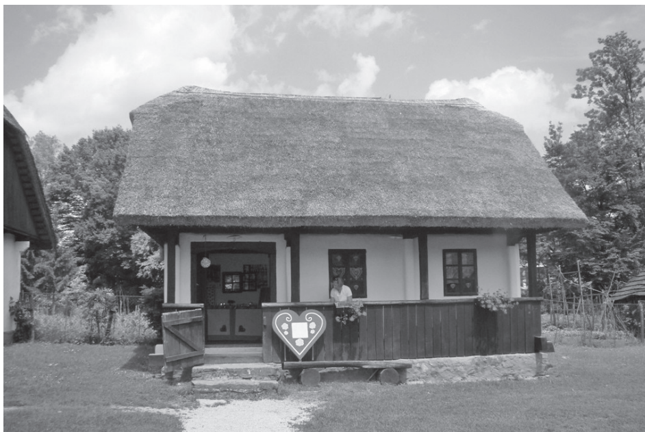
Sl. 4. Objekt s postavom "Licitari - medicarski i svjećarski obrt"

specifične muzejske koncepcije - unutrašnjost uređena bez pregradnih zidova, ne narušavajući time izvornost sačuvanog ruralnog ambijentalnog prostora interijera. Potkraj obnove "hiže mazanke", 1983. godine, eklatantnog primjerka autohtonog pučkoga graditeljstva, interijer bez pregradnih zidova omogućio je fleksibilnije izlaganje otkupljenih izložaka i nekolicine iz muzejske čuvaonice. Prostor je pregrađen staklenom stijenom na dvije nejednake cjeline koju drži improvizirana tradicijska drvena ograda s vratašcima za muzejsko osoblje. Na taj je način onemogućen direktni doticaj posjetitelja s neučvršćenim i krhkim izlošcima. (Sl.4.)