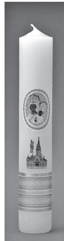
Sl. 14. Današnja svijeća, moderno urešena (licitarka Vera Zozolly, Marija Bistrica)

Licitari su djeci izrađivali omiljene bombone, "karamel" bombone i licitarske bombone, nekada rađene u drvenim ili mesinganim kalupima u obličju domaćih životinja. U kalupe se ulijevao prokuhani šećer, "karamel", a kada se stvrdnuo, vadio se iz kalupa i umatao u raznobojni staniol-papir.