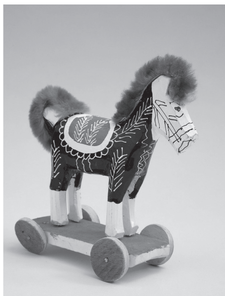
Sl. 9. Konj, “konjek” na kotačima (Drago Kunić, Laz)

Dva krila spajali su komadićem kože pričvršćenim čavlicima na oblikovani trup tako da ostanu pomična. Okretanjem alatke “forvinte” s pričvršćenim spiralnim šiljkom, poput šestara urezivali su kružiće za kotače. Dva kotačića spajali su tankom žicom i komadićem kože pričvršćenim čavlicima zakucavali na daščicu na trupu leptira. Na zadnjem kraju igračke u izdubenu rupu usadili su tanji dulji štap. Na isti način izrađuju “plesaće”, “skakaće” i zatvorena i otvorena kolica. Igračke “konjeke” same, sa zaprežnim kolima, “konjeke” u paru izrađuju na kotačima, ali bez usađenog štapa (sl. 9.).