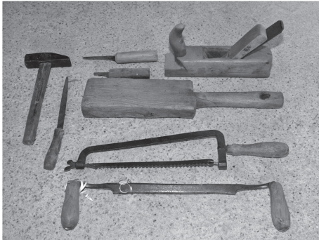
Sl. 6. Alatkne "žveglara"