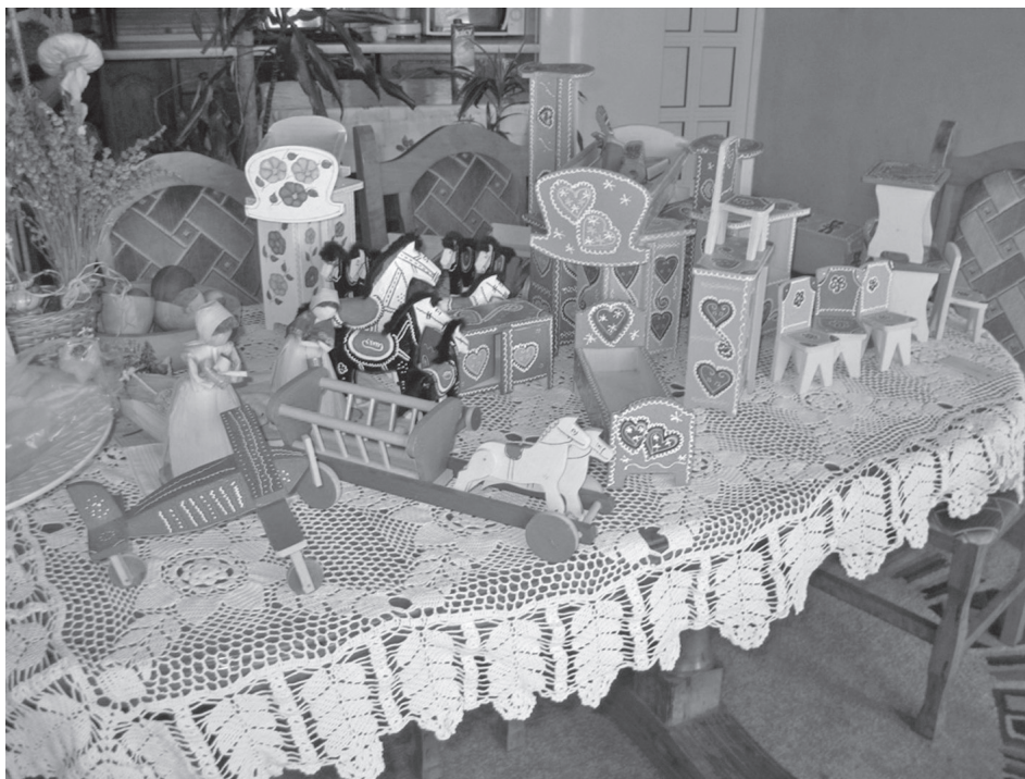
Sl. 10. Današnje drvene igračke (Drago Kunić, Laz)

Slijed vremena nošen novim običajima, navikama i potrebama zahtijevao je nadogradnju raznovrsnijim oblicima i koloriranjem. Igračke su kasnije premazi-