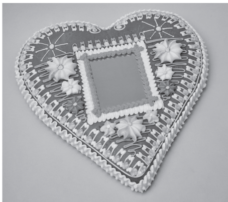
Sl. 11. Licitarsko srce (Zozolly, Marija Bistrica)

U licitarsko tijesto za brojanice, čisla ili “krunice” stavlja se žuta i ružičasta prehrambena boja. Malim okruglim kalupima, “šteherima”, oblikuju se kolutići, koji se premazuju ružičastom i bijelom bojom te iglom nižu na konac u obliku krunice s križem od istog tijesta.