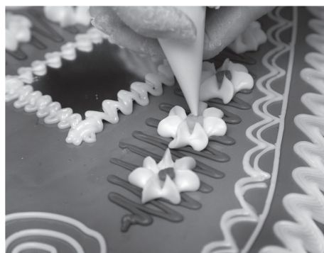
Sl. 12. Ukrašavanje licitarskog srca (Vera Zozolly, Marija Bistrica)