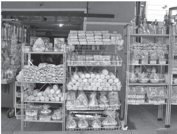
Sl. 13. Današnji štand s medenjacima, piškotama, gvircom i medicom (Zozolly, Marija Bistrica)

Na štandu licitara nekada je bilo poslagano i do sedam vrsta medenjaka s različitim dodacima, na primjer - medenjaci sa čokoladom, orasima, bademima, lješnjacima koji se danas vrlo rijetko proizvode. Tijesto se dobivalo od brašna, salakalije, jaja, vode i mirodija ili usitnjenog voća, a nakon pečenja sve su vrste medenjaka glazirali preljevom od ukuhanog šećera. Danas na licitarskim prodajnim mjestima možemo naći samo neke vrste medenjaka. Najtraženiji su medenjaci okruglog oblika različitih veličina, "pusrli, i "piškoti" ili "štangle" (sl. 13.).