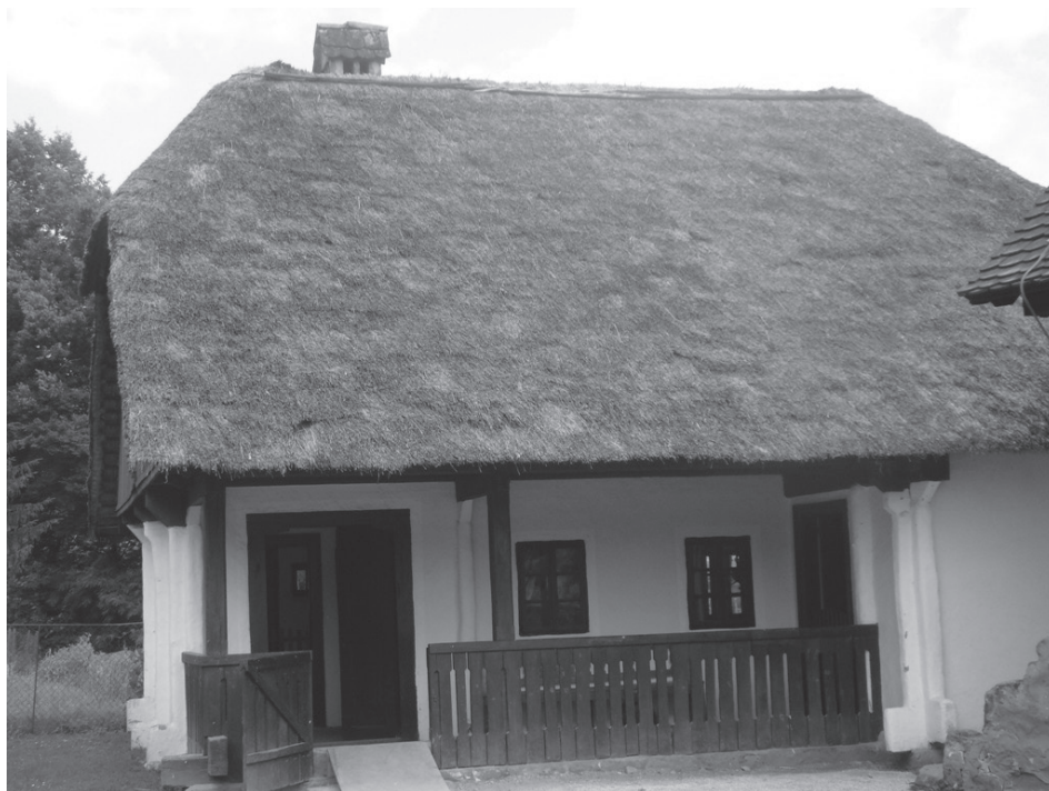
Sl. 3. Objekt s postavom “Izrada pučkih svirala i drvenih dječjih igraćaka”

stoga su radovima na starim pravokutnim temeljima, “na plitki ključ”, vraćene tradicijske graditeljske manire zagorskoga kraja. Krovište je dvoslivno, “na dvije vode”, s kapićima na zabatnim stranama i pokrovom od ražene i pšenične slame - “šopa”. Nakon zahvata rekonstrukcije i restauracije, objektu su napravljene pregradne zidne stijene u tradicijskom rasporedu pregradnje prostorija. Podovi,