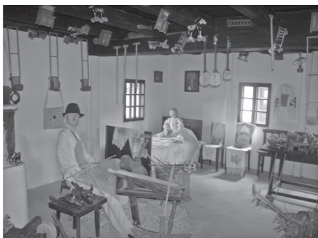
Sl. 1. Postav “Izrada pučkih svirala i drvenih dječjih igračka”

Istraživanja na terenu obavljana su u razdoblju od 1982. do 1998. godine, radi uređenja stalnih izložbi u tek obnovljenim objektima, uglavnom seljačkog i obrtničko-seljačkog stanovništva (M. Gavazzi, 1944:5). Ispitanici naselja Laz, Marija Bistrica, Tugonjica i Samobor, umijeće izrade svog obrta od djetinjstva učili su u obiteljskom krugu. Naslijeđena umijeća ispitivana su metodom intervjua, kazivanjima snimljenim na magnetofonsku vrpcu i fotoaparatom ovjekovječenih rukom izrađenih dijelova i gotovih artefakata. Nakon dovoljno prikupljenih podataka uslijedila su terenska istraživanja otkupljivanja originalnih manufakturnih predmeta i pristupilo se radu na koncepciji stalnih postava “Izrada pučkih svirala i drvenih dječjih igračaka” i “Licitari-medičarski i svjećarski obrt”. 4 Izložbe su uređene izlošcima iz muzejske čuvaonice, otkupljenim alatkama, napravama i artefaktima izrađenim za prodaju s nakanom vjerodostojnog prikaza kućnog ugođaja izrađivača drvenih dječjih igračaka, “lazanjskih žveglara”, (sl. 1.) i segmentom medičarske radionice sa “štamdom” i raznovrsnim koloritnim licitarskim i svjećarskim proizvodima (sl.2.).