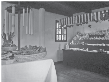
Sl. 2. Postav “Licitari - medičarski i svjećarski obrtnici” (dio štanda: starinski “ring” sa svijećom, votivi, “zagovori”)

Izložba stalnog karaktera nazvana “Izrada pučkih svirala i drvenih dječjih igračaka” postavljena je u drvenoj prizemnici, “hiži mazanki” s ganjkom, “gajničecom”. Godina gradnje nije poznata, stariji mještani spominju 1800. godinu, tako da se kuća smatra jednom od najstarijih u Muzeju. U vrijeme otkupa 1982. godine, objekt je zatečen u devastiranom stanju nastalom brojnim pregradnjama i nadogradnjama obavljanim tijekom življenja niza generacija. Konzervatorsko-restauratorskim zahvatima prioritet je bio vratiti izgled objekta iz doba gradnje;