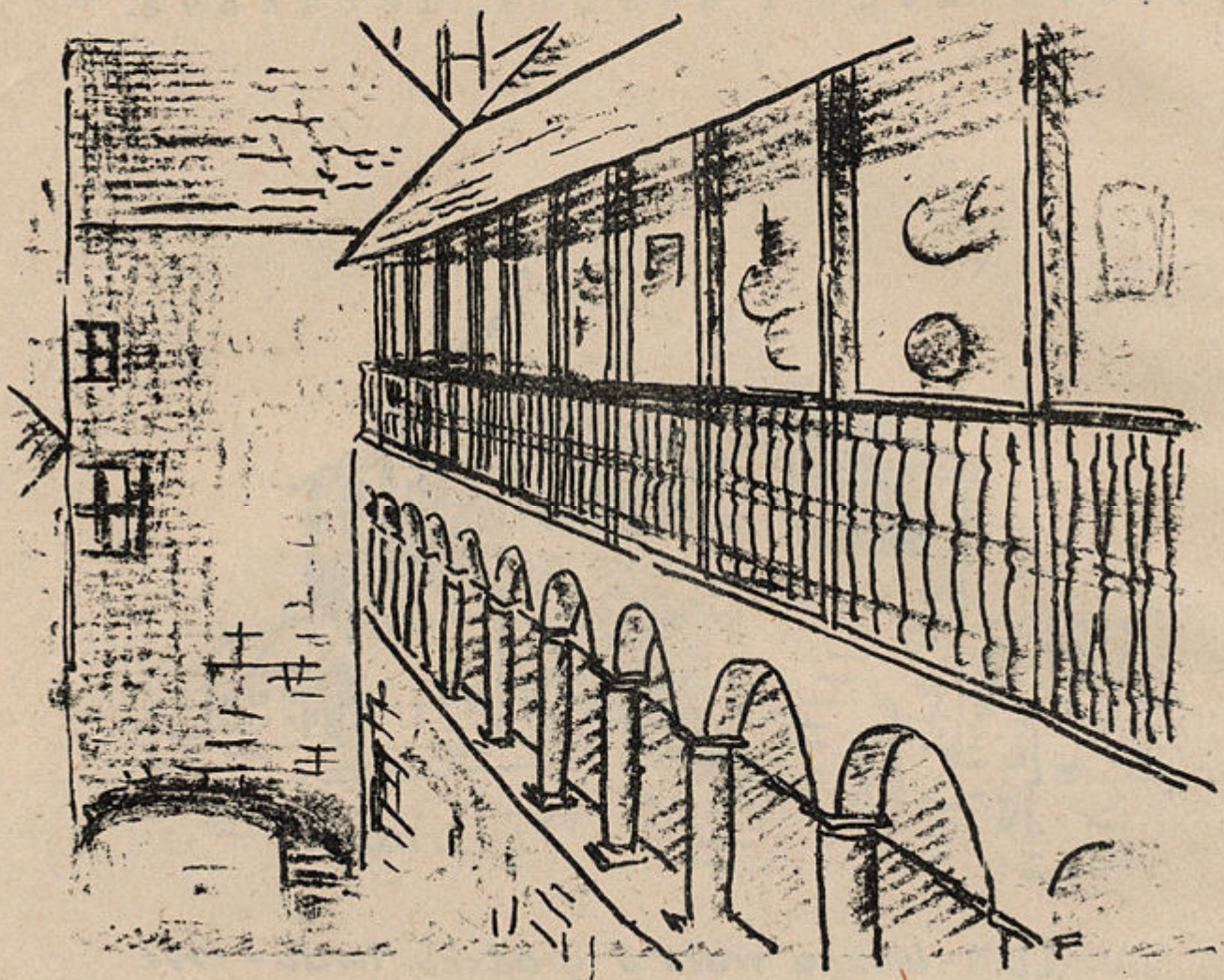
VARAŽDIN - Motiv iz Starog grada - Sada muzej Hrvatskog Zagorja