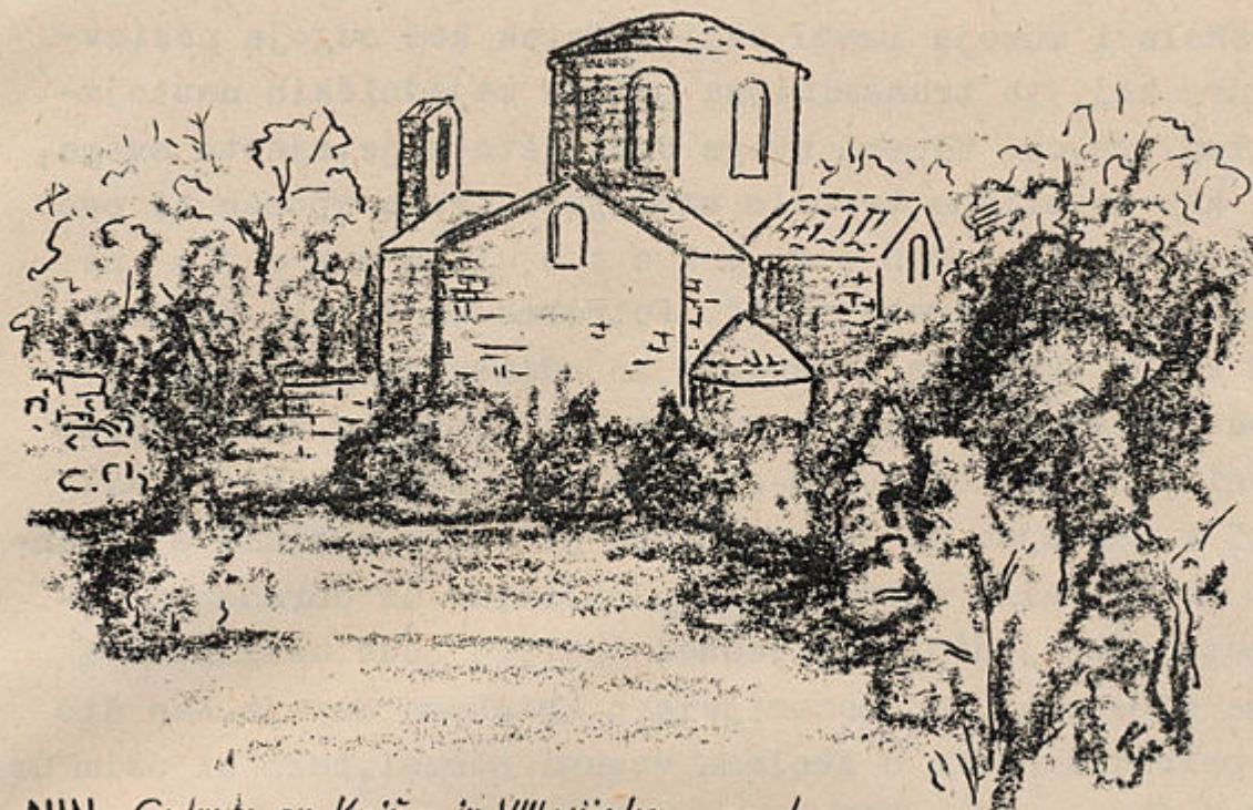
NIN - Crkva sv. Križa iz VIII vijeka - sada lapidarij starohrvatskih spomenika

organizirao je za nastavnike historije splitskih škola kratak tečaj, ali prema izvještaju muzeja rezultati još uvijek nisu zadovoljavajući. Gradski muzej u Varaždinu također je pokušao uspostaviti suradnju sa školama pomoću organiziranja muzejskog tečaja za nastavnike historije, ali se je i taj pokušaj izjalovio i tečaj se nije mogao održati.