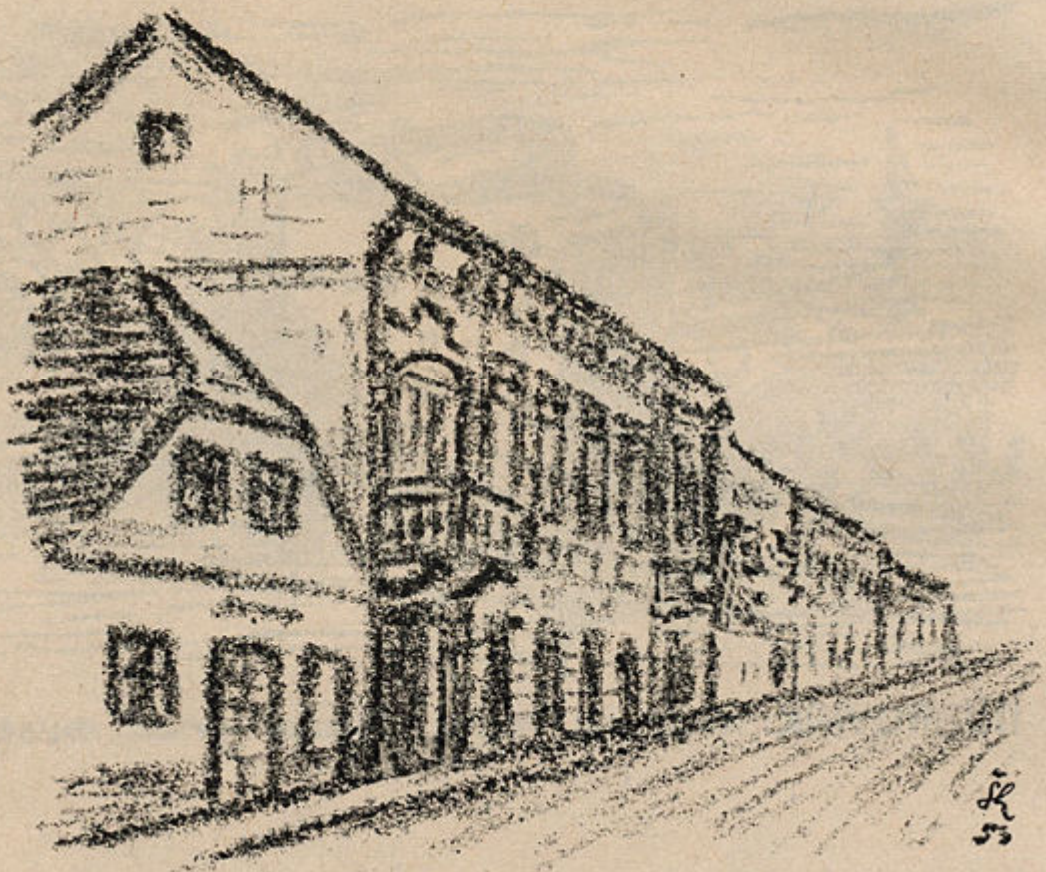
SL. BROD - Bivša zgrada GRADSKOG MUZEJA u Star- čevičevoj ul. br. 9.- Sada filijala Narodne banke