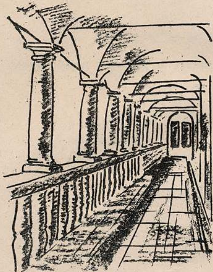
VARAŽDIN - Motiv iz starog grada - Muzej Hrvatskog Zagorja