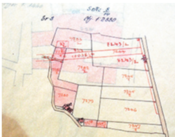
Sl. 1. Parcela u vlasništvu Državnog erara na "Kraljevoj njivi" od koje su tri čestice, 7283/1, 7243/1, 7282/3, iznad ucrtanog Puta kraljice Marije bile potrebne za gradnju katedrale

zapravo jedinstvenu zemljišnu cjelinu. Da bi se projekt gradnje mogao započeti, trebalo je najprije od države zatražiti ili ustupanje ili prodaju tog dijela parcele, a zatim ishoditi potrebne dozvole u općinskoj upravi. U razgovorima koje su predstavnici Društva vodili s Općinom, došlo se do zaključka da je spomenuta lokacija najpogodnija za gradnju nove katedrale u Splitu. U tu su svrhu gradske vlasti napravile novu regulaciju prometa i donijele novi urbanistički plan. Na lokaciji sjemenišnog vrta bila je predviđena gradnja katedrale, a na zemljištu u vlasništvu Državnog erara predviđalo se uređenje parka.