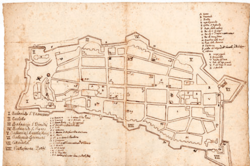
Slika 6. Plan grada Zadra iz sredine 17. stoljeća. Povijesni muzej u Zagrebu.

tanova palača ( Palazzo del Capitan Grande ). I nakon toga uslijedio je čitav niz dogradnji i izmjena južnoga 19 i istočnoga 20 dijela kompleksa kao i same providurove palače.