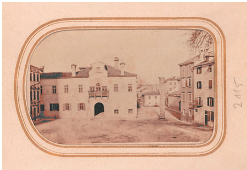
Slika 5. Fotografija baroknoga pročelja providurove palače.

kom taj se portal palače nadovezuje na zadarsku graditeljsku tradiciju Sanmichelijevih, o čemu je već bilo govora u stručnoj literaturi. 14 Općenito govoreći, može se zaključiti da glavno pročelje providurove palače, kakvo je bilo sagrađeno u 17. stoljeću, pokazuje odlike zajedničke oblicima raščlambe koji se u stambenoj arhitekturi Venecije javljaju koncem 16. i početkom 17. stoljeća. 15 Takva raščlamba uključuje središnju naglašeno rastvorenu os pročelja – s trostrukim, visokim lučno zaključanim prozorima s balkonom, uz koje su po još jedan ili dva prozora sa strane. Najčešće se takvi otvori oblikuju na prvome i drugome katu, dok su u prizemlju pravokutni prozori jednostavno oblikovanih okvira, a ispod krovne strehe samo maleni kvadratni prozori. U nekim je primjerima, kao i u Zadru, iznad samoga pročelja prisutan i zabatno zaključan uzdignuti dio središnje osi s jednim ili dva prozora.