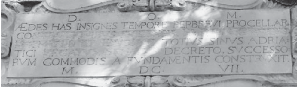
Slika 3. Ploča s natpisom iz 1607. godine na glavnome pročelju providurove palače, slikano 2011.