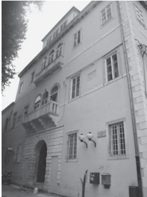
Slika 4. Glavno pročelje providurove palače slikano 2011.

dvokatno s pet osi otvora (slika 4). U sredini je ulaz u zgradu, a iznad njega na prvome i drugome katu trostruki su polukružno zaključani balkonski otvori neostilskih odlika te u vrhu zgrade izdignuti svjetlarnik s tri prozora. Sa svake strane još su po dvije prozorske osi. Takav izgled rezultat je preoblikovanja izvedenoga pri podizanju drugoga kata 1871. godine. 13 U 17. stoljeću kada se palača gradi pročelje je imalo samo jedan kat, koji je u središnjemu dijelu bio rastvoren trodijelnim balkonskim otvorom (slika 5). Središnji otvor bio je lučno zaključen i viši od ostala dva koja su bila pravokutnoga oblika. Kameni balkon bio je postavljen na četiri bogato profilirane konzole, a njegova ograda izvedena