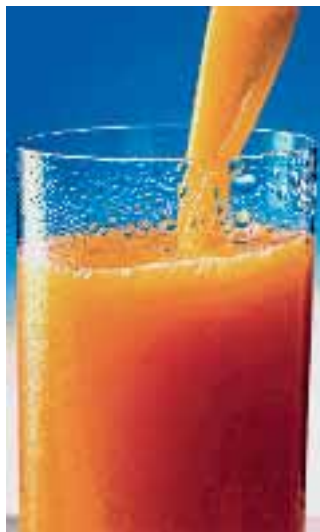
SLIKA 3. Narančasta boja soka možda je posljedica primjene nanočestica

Nanočestice u prehrambenoj industriji najčešće su u obliku pomoćnih sredstava i dodataka. Silicijska kiselina i ostale tvari koje sadržavaju silicij rabe se u proizvodnji kečapa kao ugušćivala da bi se spriječilo sljepljivanje kristala natrijeva klorida i tvari u obliku praška te omogućilo lakše istjecanje iz ambalaže. U obliku nanočestica također se primjenjuju silicijev dioksid, koloidno srebro, kalcij i magnezij. 2 Tvrtna BASF proizvodi karotenoide, pigmente topive u mastima koji daju narančastu boju, a prirodno se nalaze u mrkvama i rajčicama, u nanoveličini. Neke vrste karotenoida su antioksidanti i mogu se pretvoriti u vitamin A u tijelu. BASF prodaje sintetske nanokarotenoide velikim proizvođačima hrane i pića za primjenu u limunadama, voćnim sokovima i margarinima (slika 3). Njihova nanoveličina omogućuje bržu apsorpciju u tijelu te produljuje vijek trajanja na policama. 11