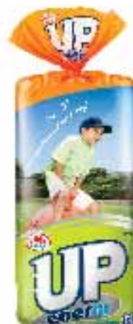
SLIKA 4. Kruh s ribljim uljem koji ne miriše na ribu 13

sadržava mikrokapsule tunina ribljeg ulja s visokim sadržajem omega 3 masnih kiselina. Kruh nema okus po ribi budući da se omega 3 masne kiseline otpuštaju tek u želucu. 11 Ista tehnika primjenjuje se u jogurtima i dječjoj hrani. U Izraelu je na tržištu repičino ulje koje dodani inhibitor kolesterola otpušta iz nanospremnik u crijevima. 12 Nanovozilo koje prenosi aktivne sastojke u i kroz tijelo, a otapa se u ulju ili vodi bez utjecaja na aktivni sastojak, patentirala je tvrtka Nutralease . 11