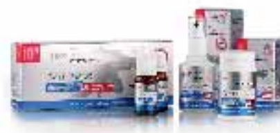
SLIKA 5. Neosino dodatci prehrani s nanočesticama 14

Nanočestice se u hranu mogu dopremiti i usitnjavanjem sastojaka. Njemačka tvrtka Neosino nanotechnologies AG na tržište je uvela paletu dodataka hrani za sportaše (slika 5), pri čemu se dodatci kao što su magnezij i kalcij samljeveni do veličina nanočestica, čime se omogućuje brže otpuštanje tih sastojaka u tijelo, a time i postizanje boljih sportskih rezultata. 12