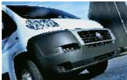
SLIKA 6. Novi izgled odbojnika Fiatova Ducata

ukupan estetski dojam određenih unutar-njih (slika 6) i vanjskih elemenata posljednje serije Ducata . To je postignuto razvojem posebnih varijanti Deplena , polipropilena poboljšane preradljivosti, niskoga sjaja i otpornosti na ogrebotine.