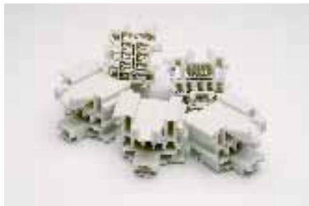
SLIKA 5. Otpresak za automobilske industrije načinjen od Valox PBT materijala GE Plastics Press Release, 12/2006.