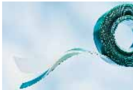
SLIKA 4. Novi Borealis ov polipropilen

Tvrtka Borealis ponudila je tržištu BA110CF , novi tip polipropilena namijenjen lijepljenju i pakiranju, koji osigurava izradbu filma boljih svojstava u usporedbi s dosadašnjim proizvodima (slika 4). Nudi se jedno rješenje za one primjene u kojima je potrebno prevlačenje filma silikonom, što snižava proizvodne troškove jer uklanja potrebu za primjenom različitih postupaka spajanja filma.