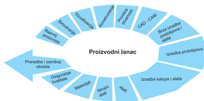
SLIKA 3. Izlagači na sajmu Euromold po područjima

Izložba je od svog početka usmjerena na izlaganje novosti s područja razvoja alata s velikim udjelom kalupa za proizvodnju polimernih dijelova, pa je i ove godine najviše izlagača s tog područja (slika 3). Slijede izlagači koji se bave brzim izradbom prototipova i kalupa, a zatim zastupnici opreme za povratno inženjerstvo (razni 3D skeneri i kamere) te računalne programe za konstruiranje, izradbu NC programa i računalnu simulaciju najčešće injekcijskog prešanja.