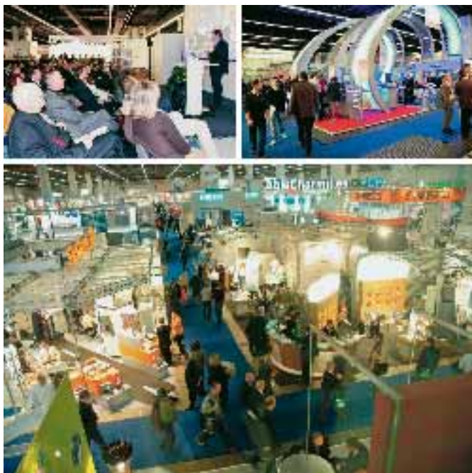
SLIKA 1. Sajam Euromold 2006

Od 29. studenoga do 2. prosinca 2006. u Frankfurtu je u organizaciji tvrtke DEMAT GmbH po trinaesti put održana izložba Euro-mold 2006 , svjetski događaj s područja alatničarstva i popratne opreme (slika 1). Unatoč teškoj ekonomskoj situaciji i regresivnim trendovima na tržištu alatničarstva, sajam Euromold ponovno bilježi porast u površini izložbenog prostora (80 050 m 2 ), broju izlagača (1 674 iz 41 zemlje) te broju posjetitelja (60 376 iz 72 zemlje). Osnovna ideja organizacije ovoga sajma od samog je početka predstavljanje svjetskih postignuća s područja alatničarstva od ideje do serijske proizvodnje (slika 2). Stoga sve vodeće svjetske tvrtke s tog područja već tradicionalno nastupaju sa svojim proizvodnim i uslužnim programom na Euromoldu .