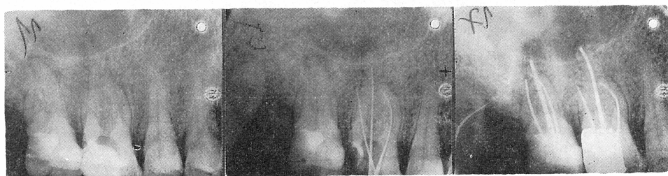
1 2 3 Sl. 1. Gornji prvi i drugi molar s periapeksnim promjenama. — Sl. 2. Sondiranje kanala prvog molara proširivačima. — Sl. 3. Definitivno punjeni korijenski kanali prvog i drugog molara.

Prvi slučaj: Pacijent star 50 godina. Gornji prvi i drugi molar pokazuju vidljive periapeksne promjene (sl. 1 do 4).