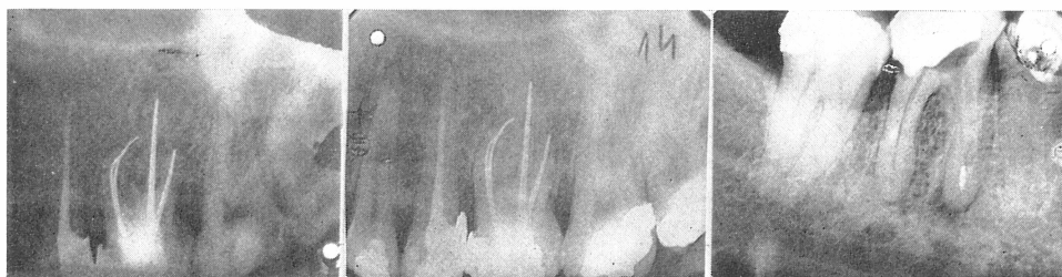
Sl. 7. Definitivno punjeni korijenski kanali. — Sl. 8. Kontrolna snimka nakon 2 godine. — Sl. 9. Frakturirani fragment instrumenta u mezijalnom kanalu prvog donjeg molara.

Treći slučaj: Pacijent star 52 godine, s frakturiranim fragmentom instrumenta u mezijalnom kanalu prvog donjeg molara (sl. 9 do 11).