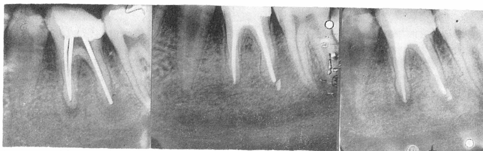
Sl. 13. Sondiranje kanala srebrnim kolčićima. — Sl. 14. Definitivno punjeni korijenski kanali. — Sl. 15. Kontrolna snimka nakon 7 mjeseci.

Višegodišnja iskustva u liječenju molara su pokazala evidentne uspjehe. Rezultati, koji su postignuti, potvrđuju opravdanost egzaktnog endodontskog liječenja višekorijenskih zubi, bez obzira na poteškoće, kojima je stomatolog izložen tijekom rada.