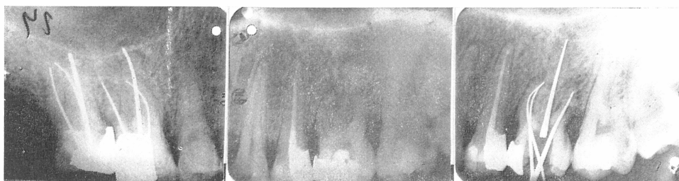
Sl. 4. Kontrolna snimka nakon 8 mjeseci. — Sl. 5. Periapexne promjene iznad svih triju korijena prvog molara. — Sl. 6. Četiri kanala sondirana srebrnim kolčićima.

Drugi slučaj: Pacijent star 28 godina, s periapexnim promjenama iznad svih triju korijena prvog molara. Postojala su četiri kanala (sl. 5 do 8).