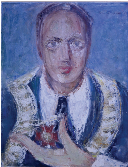
Slika 1. Marino Tartaglia (Zagreb 1894. – 1984.), Portret Andre Mohorovičića kao rektora Sveučilišta u Zagrebu , 1973., ulje na platnu, 65 x 59,5 cm. Zagreb, Sveučilište u Zagrebu, Velika vijećnica (snimila Ema Čerimagić)

Pred kraj Priloga [...] akademik Andre Mohorovičić popisuje »Prirodne rezervate, parkove, posebne primjere vegetacije, terena, vodotoka« za čije se očuvanje također zalaže 28 i naglašava: »Varaždin – zaštita brisanog prostora oko Starog grada i nekadanje konture sjevernih bedema«. 29