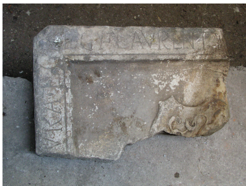
Slika 2. Varaždin, crkva sv. Ivana Krstitelja, spolij izvađen iz zvonika crkve

Prilikom čak i najmanjih radova čišćenja i uređivanja okoliša crkve sv. Ivana Krstitelja nailazi se na spolije ili na zakopane fragmente klesanog kamenog materijala koji je pripadao ranijim fazama gradnja i razvoja crkve. Tako smo otkrili fragmenat nadgrobne ploče nepoznatog odličnika pokopanog u crkvi, s vidljivim malim dijelicom štita (Sl. 2) te veliki blok obrađenog kamena s jako uništenim reljefom (Sl. 3).