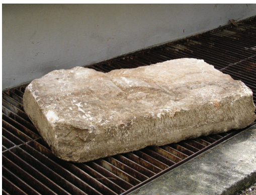
Slika 3. Varaždin, crkva sv. Ivana Krstitelja, kameni fragmenat pronađen prilikom radova