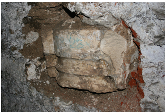
Slika 8. Varaždin, kriptna župne crkve sv. Nikole, ključni kamen u tijeku vađenja iz zida

Prvi pisani spomen sv. Nikole kao patrona župne crkve nalazimo 1454. godine u gradskim zapisnicima, 27 a ta je posveta ostala i do današnjeg dana. Što se tiče sedmerokrake zvijezde koja se nalazi u desnom gornjem dijelu grba, zvijezda na grbu ima značenje plemenite osobe, vodstva, izvrsnosti ili nebeske dobrote. Sedmerokraka zvijezda vrlo je rijedak prikaz, koji do sada nismo pronašli na komparativnim primjerima. Povezivanje novopronađenog ključnog kamena iz gotičke faze župne crkve sv. Nikole sa obitelji Korvin (Hunyadi) kao vjerojatnom donatorskom obitelji te faze izgradnje crkve, otkrilo je nove činjenice ne samo o povijesno-umjetničkim slojevima izgradnje crkve već i o čvrstoj povezanosti grada Varaždina sa kraljevskom obitelji.