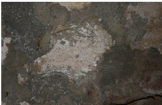
Slika 6. Varaždin, kripta crkve sv. Ivana Krstitelja, detalj