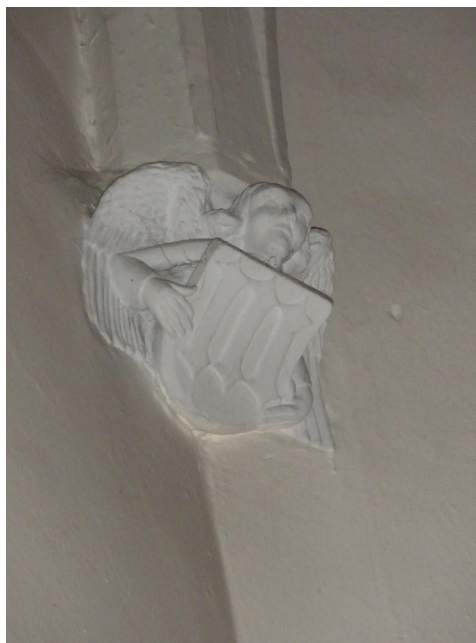
Slika 13. Sveti Martin na Muri, crkva sv. Martina, konzola u svetištu