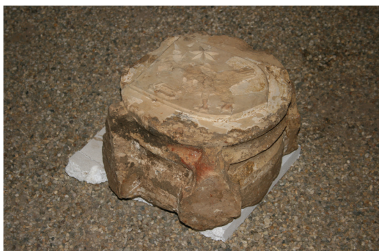
Slika 9. Varaždin, kriptu župne crkve sv. Nikole, ključni kamen