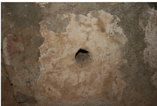
Slika 5. Varaždin, kripta crkve sv. Ivana Krstitelja, detalj