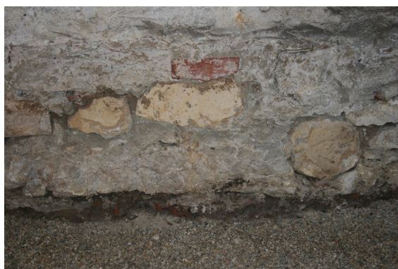
Slika 10. Varaždin, kriptu župne crkve sv. Nikole, spolije u zidu crkve