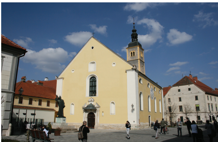
Slika 1. Varaždin, crkva sv. Ivana Krstitelja