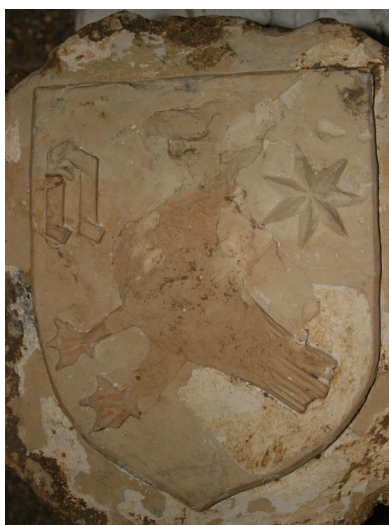
Slika 11. Varaždin, kriptu župne crkve sv. Nikole, grb na ključnom kamenu