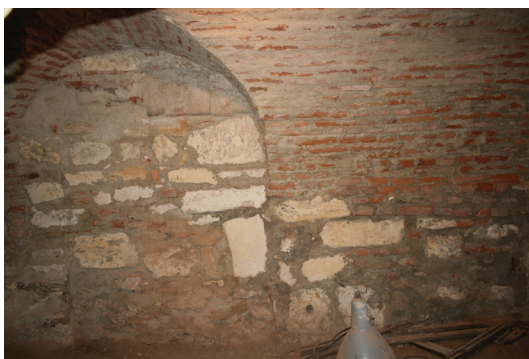
Slika 4. Varaždin, kripta crkve sv. Ivana Krstitelja