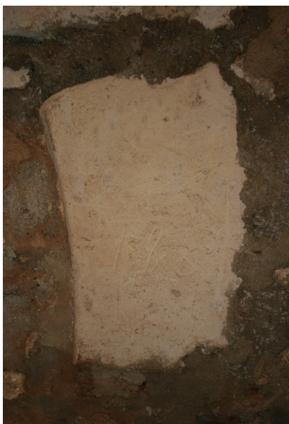
Slika 7. Varaždin, kripta crkve sv. Ivana Krstitelja, detalj

Što se komparativnog materijala tiče, identičnu profilaciju ima spolij ugrađen u peti svoda kapele na Grebengradu, datiran okvirno u drugu polovicu 13. stoljeća. 14 Na Grebengradu se radi o ulomku polurebra svoda, a rekonstrukcijom punog profila dobivamo istu profilaciju kakvu nalazimo na rebu u varaždinskoj franjevačkoj crkvi. Ista takva profilacija, koja se može datirati u drugu polovicu 13. ili u 14. stoljeće nalazi se na svodnim rebrima u slavonskim crkvama - sv. Augustin u Velikoj te crkva sv. Dimitrija u Brodskom Drenovcu. Tamo se radi o romaničko – ranogotičkom razdoblju te se samo oblikovanje očuvanih elemenata – svodnih rebara, sedilija i trijumfalnih lukova – vežu uz cistercitsku prisutnost. 15