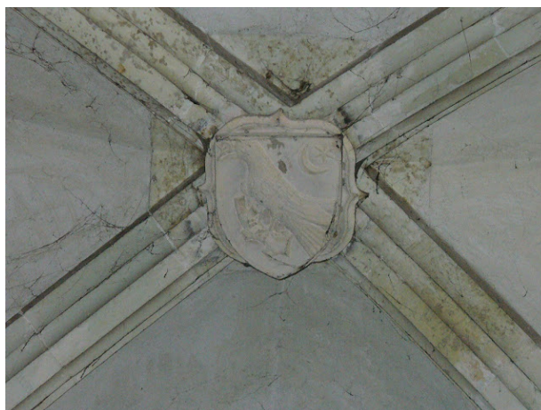
Slika 12. Vajdahunyad, Rumunjska, ključni kamen s grbom Hunyadi, Vajdahunyad, Hunyadi cimer