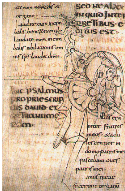
Slika 3. Psaltir iz Corbie kraj Amiena. Prema Hrvati i Karolinzi 2000.