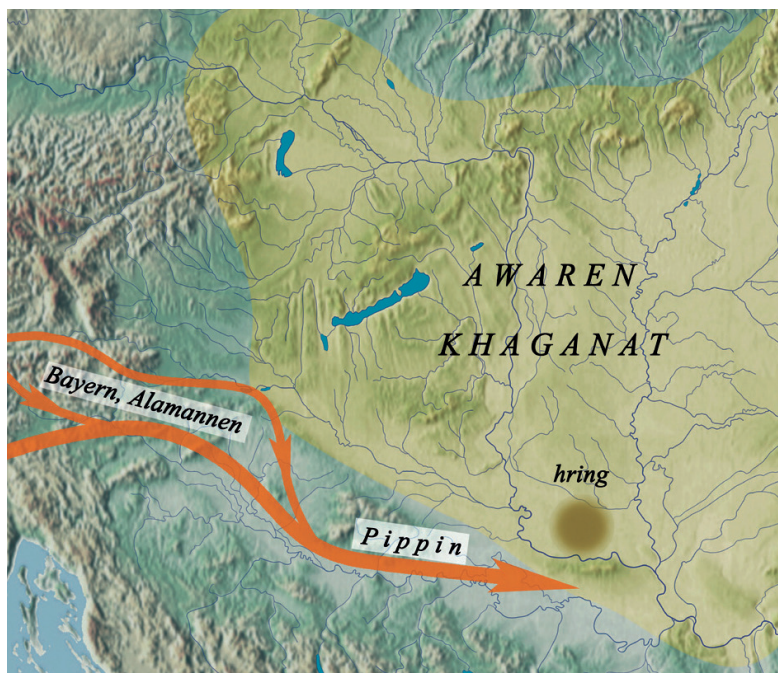
Slika 8. Prikaz Pipinova pohoda 796. godine. Prema Szöke 2009.

U ljeto 796. sakupili su se biskupi koji su marširali s Pipinom na Conventus episcoporum ad ripas Danubii 11 , pod protokolarnim vodstvom Paulina II., patrijarha Akvileje. O mjestu koncila se u Dictatus 12 navodi da se održao u Castra... super flumen albidum Danubium 13 i to ondje gdje je Pipin već ranije primio zakletvu vjernosti Kagana, i odakle se nakon pljačkanja i uništenja Hringa vratio. Kako se Pipinov logor nalazio negdje u dravsko-savskom međuriječju ili vrlo vjerojatno neposredno na Dunavu, to znači da se ondje održao i spomenuti koncil.