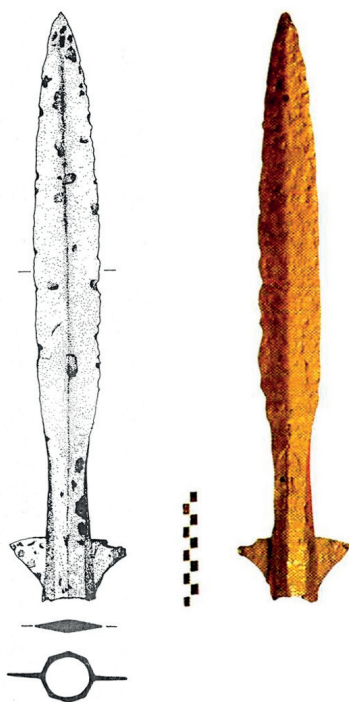
Slika 1. Karolinško koplje s krilcima iz Varaždina. Snimak i crtež Ž. Tomičić.