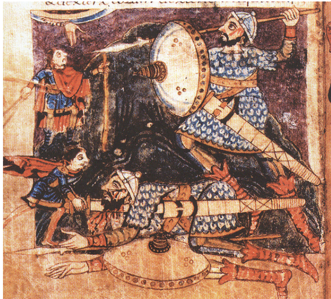
Slika 2. Psaltir iz Stuttgarta. Prema Hrvati i Karolinzi 2000.