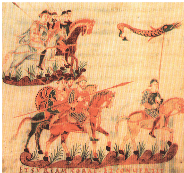
Slika 6. Psalterium aureum iz St. Gallena. Prema Hrvati i Karolinzi 2000.

Na prostoru današnje Hrvatske, susjedne Slovenije (korito rijeke Ljubljanice) 6 te Bosne i Hercegovine koplja s krilcima su učestala pojava (Slika 7). 7 Primjetan je njihov pretežit raspored uz vodotoke, dakle i potencijalne onodobne prometnice. 8