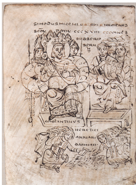
Slika 4. Kanonski zbornik spisa iz Vercellia. Prema Hrvati i Karolinzi 2000.