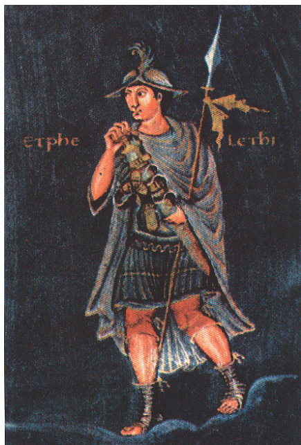
Slika 5. Prva Biblija cara Karla Čelavog. Prema Hrvati i Karolinzi 2000.