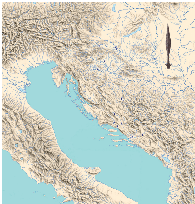
Slika 7. Zemljovid s rasporedom karoliških kopalja s krilcima na prostoru Slovenije, Hrvatske te Bosne i Hercegovine. Prema zamisli autora izradio Hrvoje Jambrek.

literaturi. 9 Pritom posebice izdvajamo zanimljiva promišljanja Željka Deme općenito o kopljima s krilcima unutar kojih se varaždinsko koplje uvrštava u njegov Tip III, odnosno vremenski na svršetak 8. st., prvu polovinu i početak druge polovine 9. st. (Demo, 2010, 72, Tablica 3). Na taj način naše ranije datiranje varaždinskog koplja, prigodom prve njegove objave, nailazi na pouzdanu i utemeljenu potvrdu (Tomičić, 1968, 53 –61).