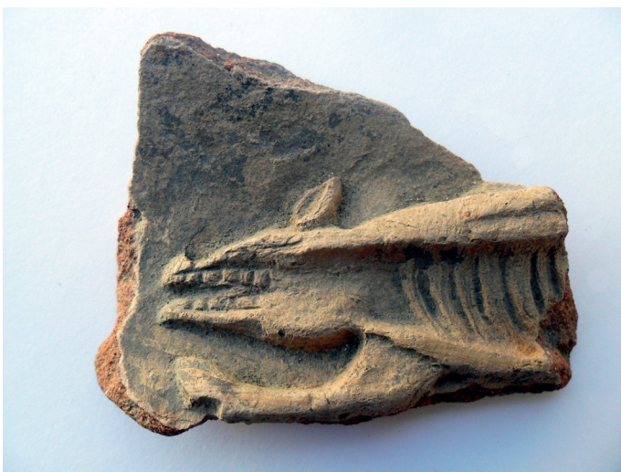
Slika 36. Fragment s prikazom zaklane i rasporene svinje