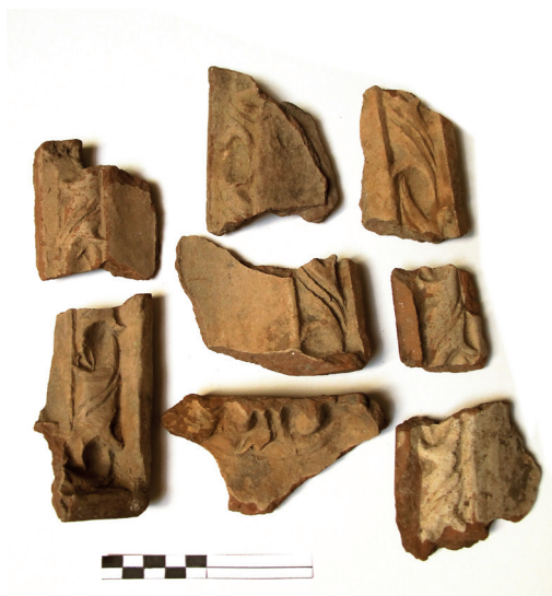
Slika 14. Fragmenti više pećnjaka; vjerojatno pripadaju motivu sv. Nikole