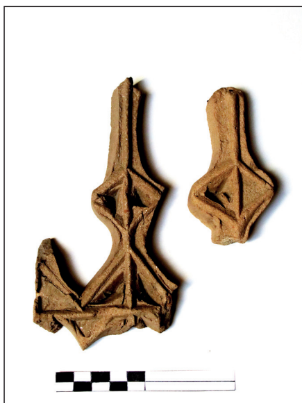
Slika 28. Dijelovi kruništa peći

Kruništa na gotičkim pećima najčešće završavaju križnim ružama – drugačije oblikovanim elementima, dok nam primjerci analogni ovima sa Staroga grada za sada nisu poznati.