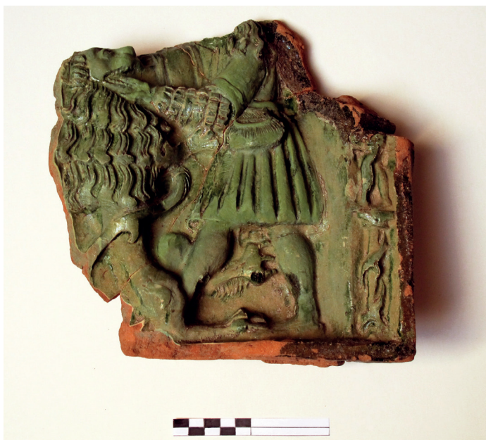
Slika 10. Nalaz iz sonde VIIA nakon čišćenja i restauracije