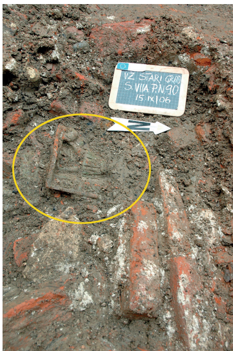
Slika 9. Pećnjak iz sonde VIIA (2006. g.) in situ