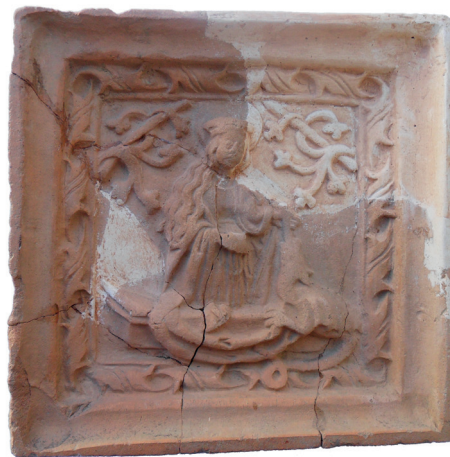
Slika 21. Pećnjak s prikazom sv. Margarete, nalaz iz 1971. god.