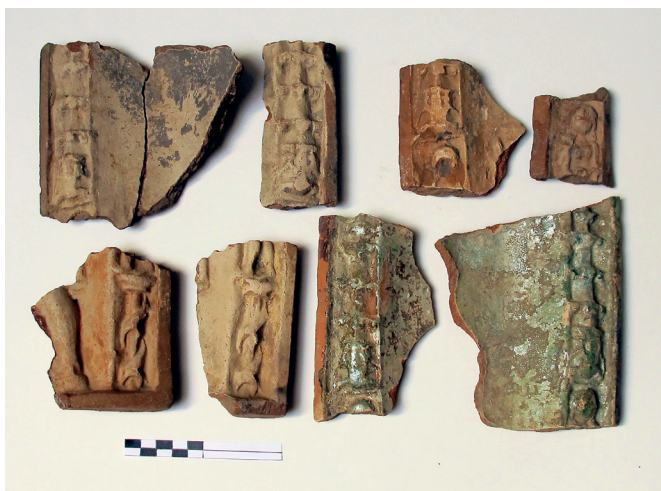
Slika 8. Dijelovi više pećnjaka s motivom Samsona