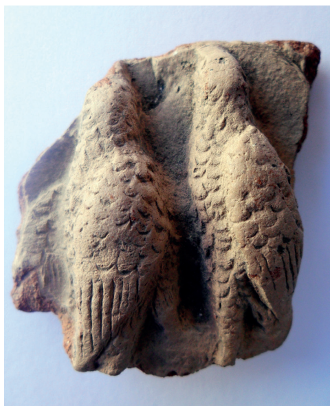
Slika 35. Dvije prepelice, fragment nepoznate scene