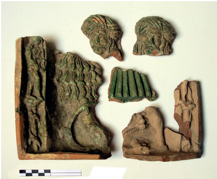
Slika 5. Dijelovi pećnjaka s prikazom Samsona