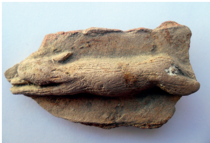
Slika 34. Prikaz zeca u trku, nalaz iz 1971. god.

6. S iskopavanja 1971. g. potječe još nekoliko dijelova pećnjaka, spomenutih u radu M. Ilijanić (ILIJANIĆ 1973: 198). Radi se o ulomcima s prikazima životinja. Kahle su bez cakline, ali su prevučene svijetlom engobom, s prikazom zeca u trku (sl. 34), dviju prepelica (sl. 35) te zaklanom i rasporenom svinjom (sl. 36). Analogije za ove prikaze dosada nam nisu poznate.