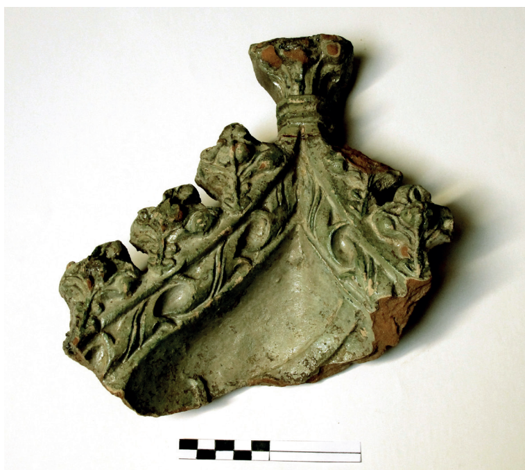
Slika 16. Dio zabatnog pećnjaka, nosio je prikaz sv. Jurja