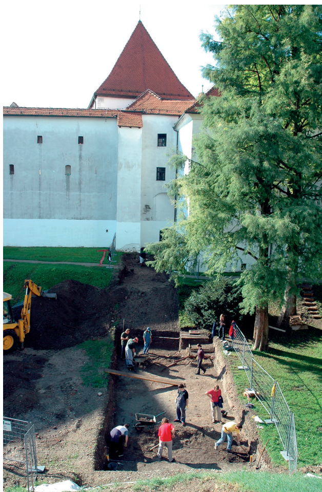
Slika 2. Stari grad – istraživanje sjeverne mokre grabe 2006. god.

nekim slojevima, definiranim tijekom iskopavanja, miješa se starija građa s onom novijom pa se zaključuje da se u tim slučajevima radi o sekundarnim zasipima. U kojim je prilikama i na koji način pomiješan materijal različite starosti, to se na ovom stupnju istraženosti varaždinske utvrde ne može utvrditi. Kako analiza pokretnih nalaza iskopanih 2006. g., osobito onih koji potječu iz starijih slojeva, omogućava uvid u život, mogućnosti i navike, a naposljetku i u socijalni status stanovnika castruma, tako su i pećnjaci dobar pokazatelj nekih aspekata razdoblja u kojem su nastali: obrtničke djelatnosti, tehnoloških postupaka, umjetničkih strujanja, utjecaja i trgovine.