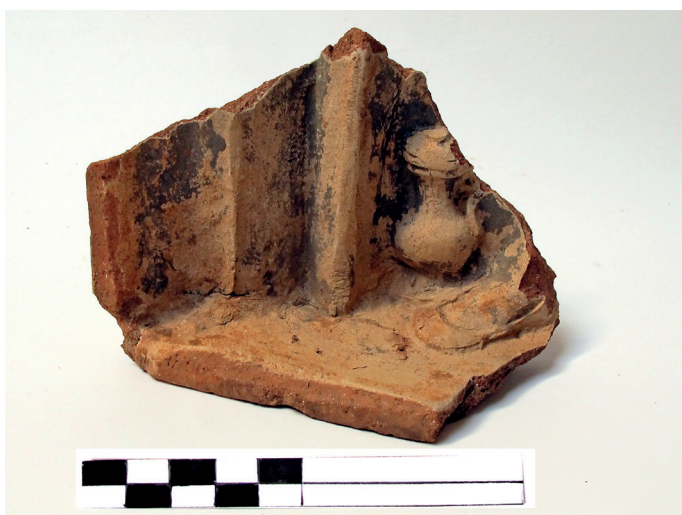
Slika 32. Fragment niše sa stopalom i vrčem