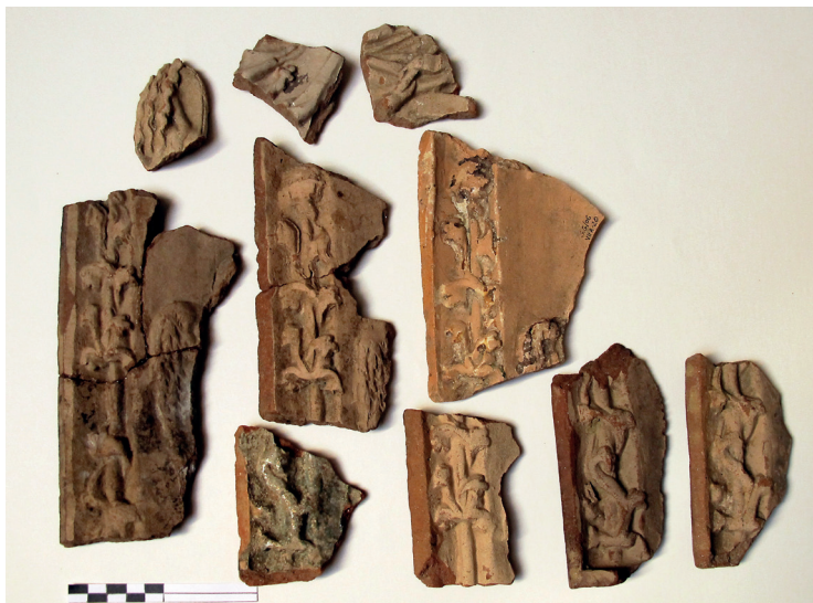
Slika 18. Fragmenti više pećnjaka s istom scenom Navještenja