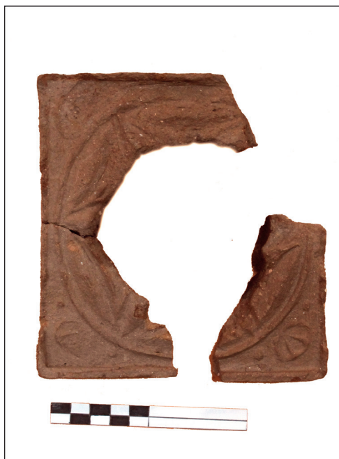
Slika 27. Fragmentirani pećnjak s rozetom, nalaz iz 2006. god.