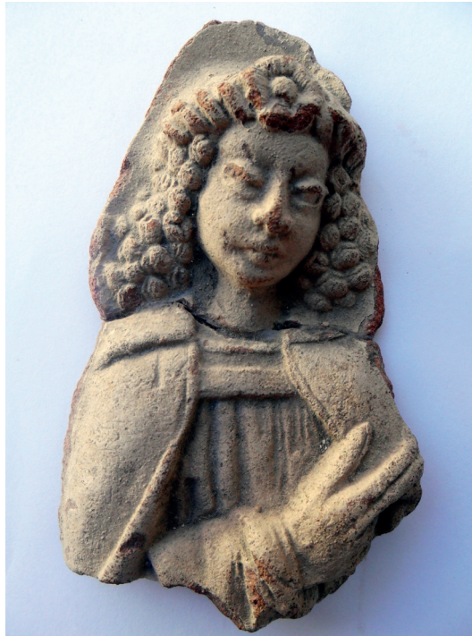
Slika 23. Prikaz viteza, nalaz iz 1971. god.