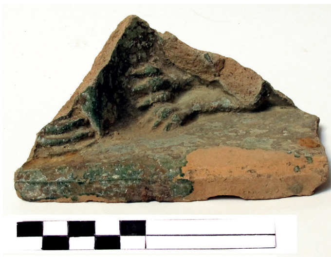
Slika 31. Fragment niše s (lavljim?) šapama

4. Tijekom istraživanja 1971. g. pronađen je donji dio necakljenog pećnjaka kojem je dekorativna površina prevučena engobom (sl. 32). Rubni dio višestruko je profiliran, jednostavan je i bez plastične dekoracije. Od reljefno izvedene scene vidi se samo ljudska noga u obući i do nje lijepo izveden vrč s poklopcen. Na engobi se mjestimice vide ostaci crvene boje. Cjelokupni dekorativni prikaz nije poznat.