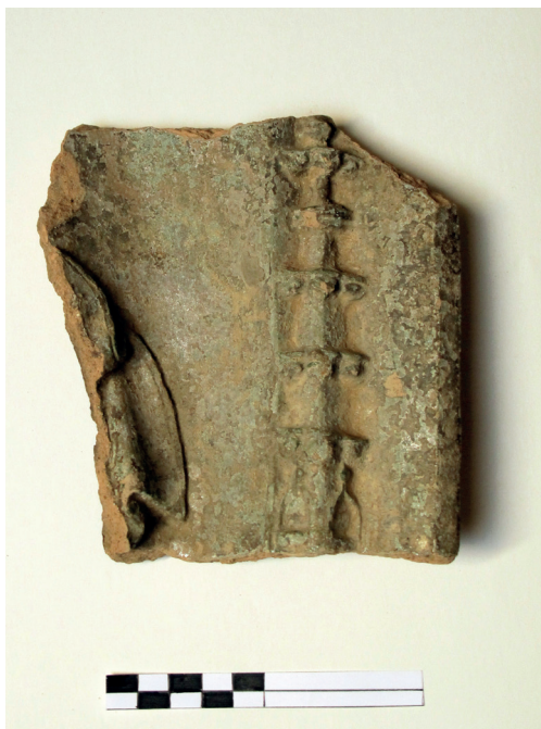
Slika 29. Desni dio pećnjaka s fijalom i dijelom plašta

dinski nalaz se u nekim detaljima ne podudara sa spomenutom scenom pa je atribucija zasada upitna. 12 Ulomak je otkriven u sondi VIIA, u SJ 17, s nalazima kasnog 15. i 16. st.