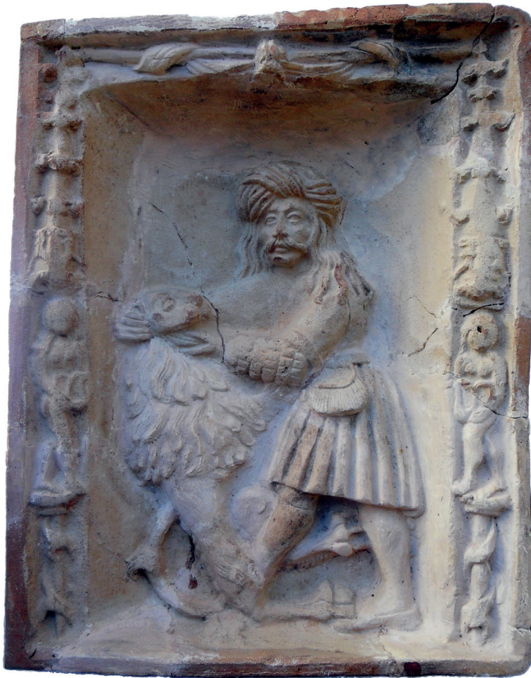
Slika 4. Samson u borbi s lavom

de (ILIJANIĆ 1973: 199; FRANZ: 1981). S obzirom na to da je Ivaniš Korvin bio vlasnik varaždinske utvrde, M. Ilijanić smatra kako je moguće da je sa sobom doveo nekog od budimskih majstora koji je s proizvodnjom kvalitetnih pećnjaka nastavio u Varaždinu.