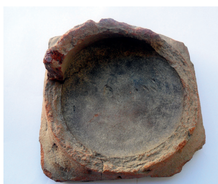
Slika 26. Stražnji dio pećnjaka s rozetom