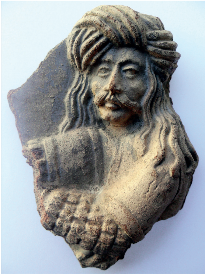
Slika 7. Fragment – lik Samsona

Arheološkim istraživanjem 2006. g. otkriveno je još nekoliko dijelova istovrsnih pećnjaka: dva fragmenta s prikazom glave, ulomak s haljetkom, veći desni dio pećnjaka s rubnim i središnjim motivom te dva nasuprotna rubna dijela koji izgledom cakline pripadaju istom pećnjaku (sl. 5, sl. 8). Zanimljivo je da su svi nalazi iz 2006. g. zeleno cakljeni, dok su oni s ranijeg istraživanja i s drugog mjesta nalaza dijelom cakljeni, a dijelom prevučeni svjetlom engobom. Također se i kod cakljenih primjeraka radi o posebnom postupku završne obrade jer je pečena kahlja najprije premazana svjetlom engobom koja služi kao podloga zelenoj caklini. Na većem desnom dijelu pećnjaka pronađenog 2006. g. (sl. 9, sl. 10) vidi se oštećenje, no ne može se utvrditi je li ono nastalo u proizvodnji ili nakon što je peč-