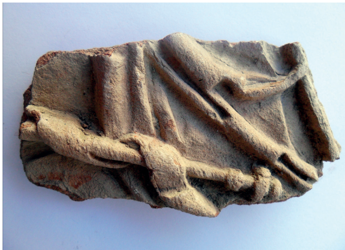
Slika 19. Mali ulomak gornjeg dijela pećnjaka – Navještenje