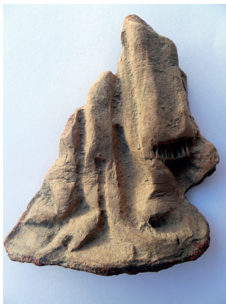
Slika 15. Donji dio prikaza sv. Nikole, nalaz iz 1971. g.