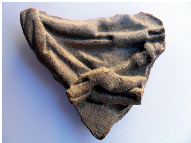
Slika 20. Mali ulomak gornjeg dijela pećnjaka – Navještenje