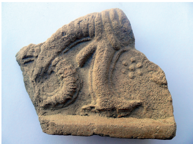
Slika 24. Fragment s prikazom noge i repa zmaja

kalup, što je dovelo do razlike u dimenzijama (TOMANIČ - JAVREMOV 1997: 122). Fragment sa Staroga grada u svim se vidljivim detaljima može poistovjetiti s cjelovitim pećnjakom iz Ormoža: jednaka je noga s pandžama, raščlanjeni uvinuti rep, te motiv cvijeta koji popunjava prostor uz nogu zmaja, također se podudaraju. Primjerci iz Ormoža datiraju se prema sličnim pećnjacima iz grada u Slovenskim Konjicama i iz Planine kod Sevnice u drugu polovicu, odnosno na kraj 15. st. (STOPAR 1976: T.IV:3, VI:1, VII:2). Opisani ulomak s motivom zmaja jedini je dosada takav poznat ulomak s varaždinskog Staroga grada.