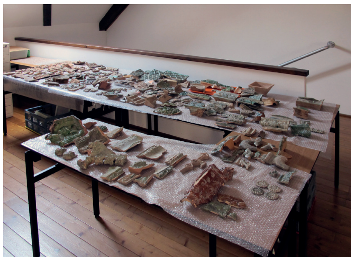
Slika 1. Dio pećnjaka tijekom obrade

Tragom riječi akademika Mohorovičića, a sa željom da i ova odabrana tema bude jedan od malenih dijelova u mozaiku sveukupne prošlosti Varaždina, predstavlja se izbor novijih arheoloških nalaza sa Staroga grada, prikupljenih 2006. g. arheološkim istraživanjem. Iz velike količine pokretnih arheoloških predmeta izrađenih od različitih materijala, predmeta različitih funkcija i starosti, za ovu su priliku izdvojeni pronađeni dijelovi zidanih peći – pećnjaci, kaljevi ili kahle kasnog srednjeg vijeka. 1 Već je ranije spomenuto da će se u ovom tekstu pažnja posvetiti samo određenom broju pećnjaka, odnosno da će se iz velike količine građe te vrste izdvojiti kahle kasnog srednjeg vijeka (sl. 1). No, brojnost predmeta, također i unutar tako zadanih kronoloških okvira, određuje u ovom slučaju pristup temi: za obradu i predstavljanje građe odabrani su samo najinteresantniji primjerci, dok će se drugdje kataloški obraditi svi nalazi. 2