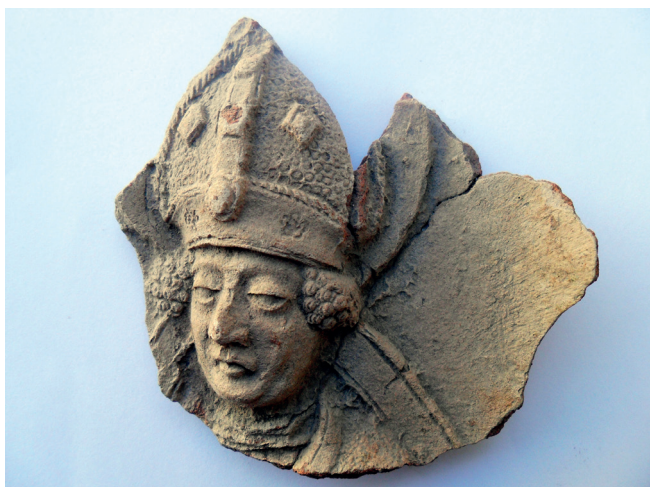
Slika 12. Prikaz sv. Nikole, nalaz iz 1971. g.