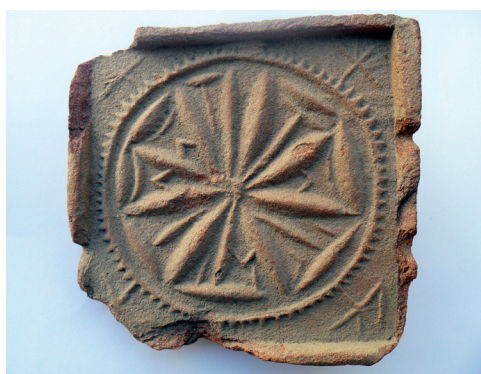
Slika 25. Pećnjak s rozetom, nalaz iz 1971. god.