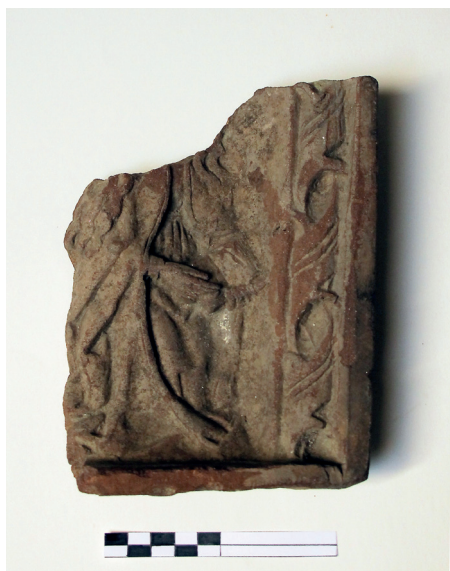
Slika 17. Donji fragment pećnjaka s motivom Navještenja