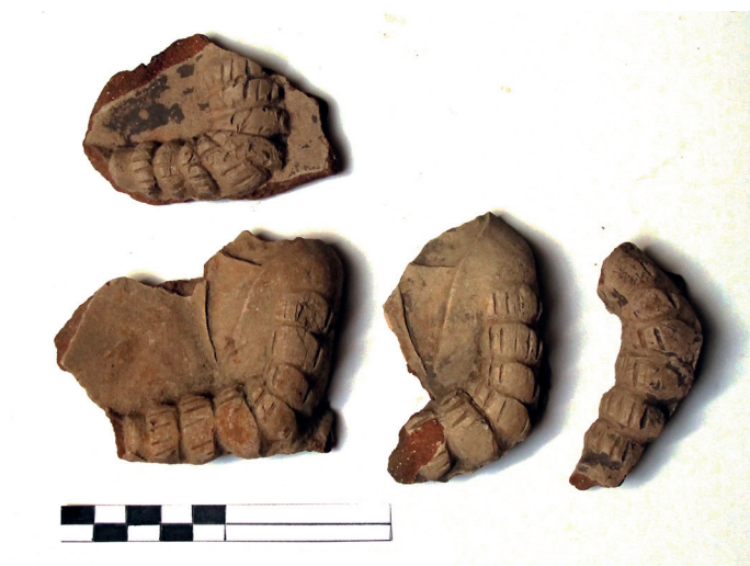
Slika 33. Ulomci s istim prikazom, dijelovi više pećnjaka