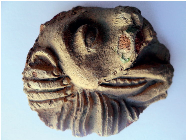
Slika 6. Fragment s prikazom lavlje glave - pripada cjelini s prikazom Samsona