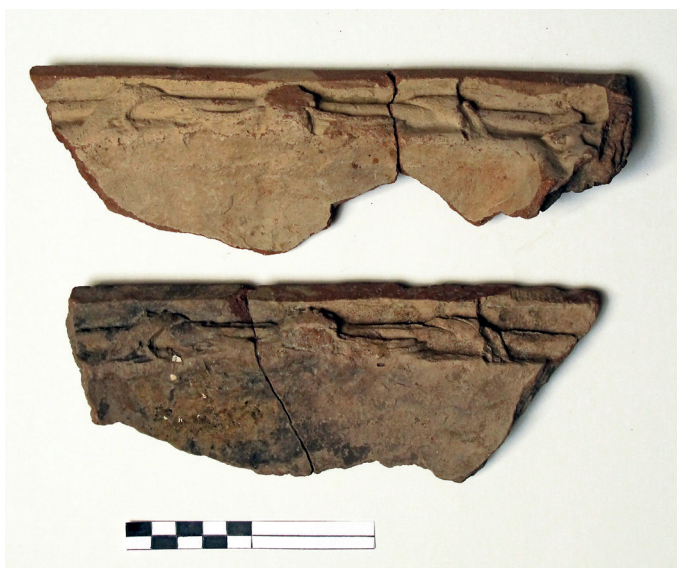
Slika 11. Gornji rubni dijelovi scene sa Samsonom