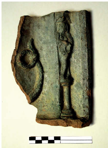
Slika 30. Ulomak s nepoznatim prikazom

pećnjak mogla koristiti dva kalupa – u jednom je kalupu nastao okvir, a u drugom središnji motiv (HOLL 1995: 272). Od scene u niši vidi se samo dugi uvinuti životinjski rep, prekriven krljuštima pa takav prikaz upućuje na rep zmaja ili grifona. Ovaj nalaz iz 2006. g. jedini je sa Staroga grada s ovakvim detaljom. Zasad se nije uspjelo pronaći pećnjake s drugih lokaliteta koji bi se mogli povezati s našim primjerkom.