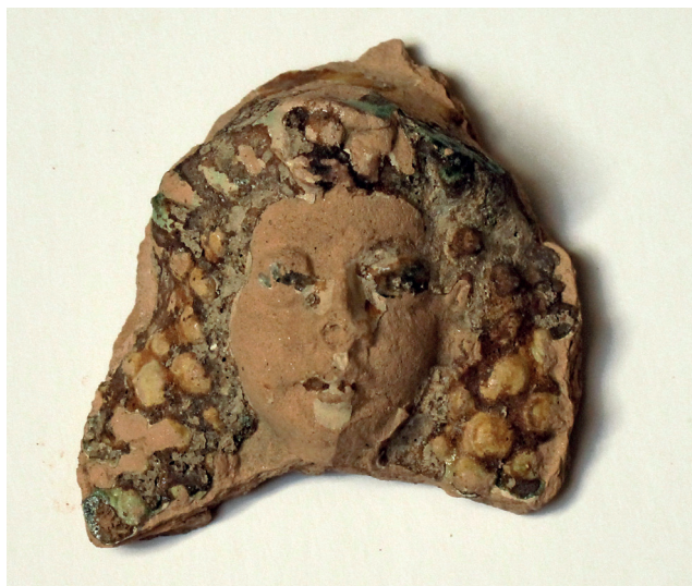
Slika 22. Prikaz glave viteza, nalaz iz 2006. god.

S Ružice grada objavljen je ulomak s prikazom muške glave s dugom kovrčavom kosom te dijademom s cvijetnim ukrasom. Za ovaj manji fragment navodi se mogućnost da možda pripada prikazu sv. Jurja (RADIĆ, BOJČIĆ 2004: 612). Glava identična ovoj s Ružice potječe i sa Staroga grada, samo što njena caklina nije zelena, već je višebojna (sl. 22). Kod završne obrade našeg pećnjaka primjenjena je tehnika pomiješanih caklina (žuta-smeđa-zelena) prepoznatljiva na proizvođačima ugarskih radionica Korvinova vremena (BIRTAŠEVIĆ 1970: 25). Nažalost, ovo je dosada jedini pronađeni primjerak ovako cakljenog pećnjaka, ukoliko nijedan ulomak lijevog rubnog dijela Navještenja nije bio cakljen na sličan način. Istraživanjima 1971. g. također je iskopan fragment s prikazom istovjetne glave s dijademom i cvijetom, ali bez cakline (sl. 23). Osim glave s kovrčavom kosom, vidi se i poprsje, te desna ruka, šake usmjerene prema gore. Predstavljeni lik vrlo je lijepo oblikovan, kvaliteta i preciznost izrade svrstavaju i ovaj pećnjak među izuzetne proizvode. Ulomak sa Staroga grada očuvan je u tolikoj mjeri da može pomoći kod pojašnjenja fragmenta s Ružice, za kojeg se smatra da bi mogao pripadati sv. Jurju. Međutim, varaždinski komad, zahvaljujući očuvanom poprsju, pokazuje da niti odjeća, a niti ruka ne mogu pripadati sv. Jurju pa prikaz na oba varaždinska kalja zasada treba odrediti kao glavu viteza (usporedi: RADIĆ, BOJČIĆ 2004: 611, 612).