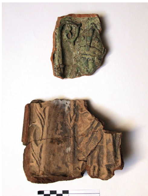
Slika 13. Dijelovi raznih pećnjaka s istim prikazom sv. Nikole iz Barija