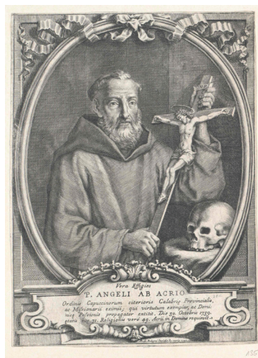
Slika 10. Andrea Bolzoni, Vera Effigies P. ANGELI AB ACRIO , 1743., bakrorez, 290 x 210 mm, Beč, Österreichische Nationalbibliothek, Porträt-sammlung.

Kvalitetom najslabiji među opisanim portretima u samostanskoj blagovaonici jest onaj bl. Bernarda iz Offide (lat. b. Bernardus ab Offida ; Villa d'Appignano kod Offide, 7. XI. 1604. – Offida, 22. VIII. 1694.; Sl. 11.). 58 Poput čitavoga niza