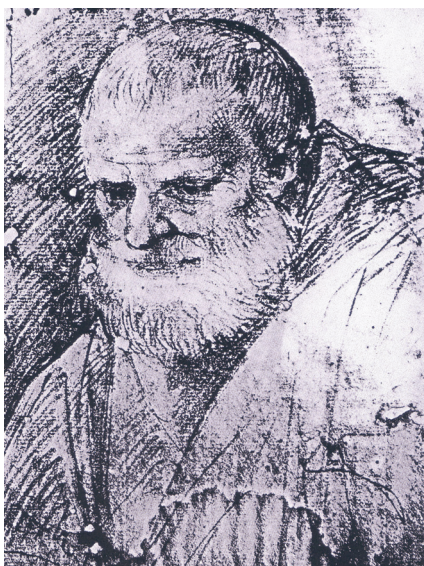
Slika 1. Giuseppe Cesari, Portret Feliksa Kantalicijskoga , detalj, oko 1582., Rim, Zbirka Caetani

ven u kapucinski habit, s torbom prebačenom preko ramena. Na licu, u lijevom poluprofilu, ističe se zamišljen, spušten pogled i okrugla, gusta brada i brkovi. 16 O uspjehu Cesarijevoga crteža svjedoče mnoge grafike kojima je poslužio kao predložak. Među njima se kvalitetom i utjecajem na čitav niz kasnijih prikaza sv. Feliksa kao sakupljača milostinje ističe bakrorez Rafaela Sadelera I. (Antwerpen, oko 1560./61. – Venecija ili München, između 1628. i 1632.) nastao 1615. godine, deset godina prije svečanosti beatifikacije. (Sl. 2.). 17