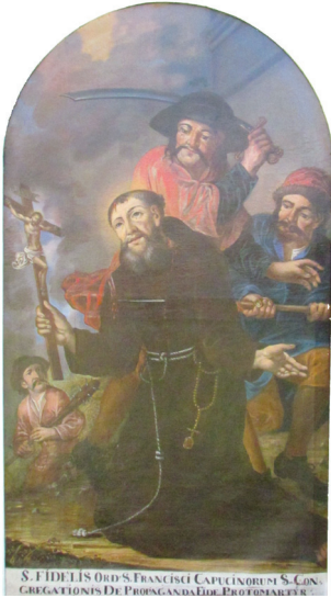
Slika 13. Blasius Grueber, Mučeništvo sv. Fidelija iz Sigmaringena , sredina XVIII. st. (?), ulje na platnu, 187 cm x 101, 5 cm, Varaždin, hodnik klaustra kapucinskoga samostana