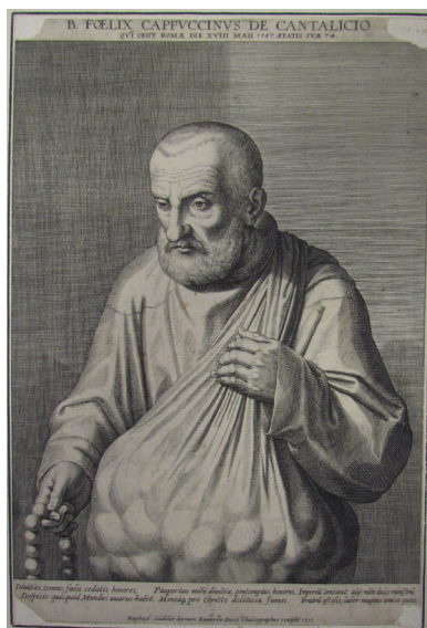
Slika 2. Rafael Sadeler I., Feliks Kantalicijski , 1615., bakrorez, Rim, Museo Francescano