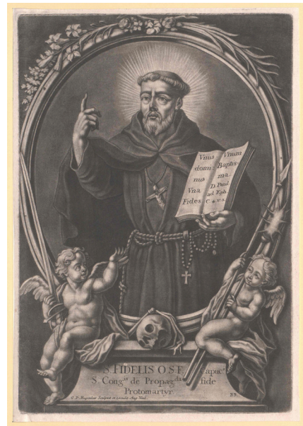
Slika 6. Georg Philipp Rugendas, S. Fidelis , sred. XVIII. st., mezzotinta, 110 x 77 mm, Beč, Österreichische Nationalbibliothek, Porträtsammlung

preko kojega je prebačen težak plašt. U struku je opasan dugim, od konopca pletenim pojansom s krunicom. Na prsima se ističe raspelo ovješeno o uzici oko vrata. Glava, blago okrenuta udesno, okružena je aureolom. U skladu s propisima kapucinskoga reda, svetac ima tonzuru i bradu. Prikaz samoga svetca na varaždinskoj slici odstupa od opisanoga tek u detaljima: u lijevoj ruci je uz knjigu prikazana palmina grančica, brada je duža i gušća, a mladenačkije lice je ovjenčano tankim, u perspektivi prikazanim svetokrugom. Za razliku od grafike, preuzeti motivi putta i lubanje, smješteni su unutar ovalnoga formata, u razini donjega dijela svečevoga tijela: umjesto dva putta na slici je prikazan samo jedan, urav-