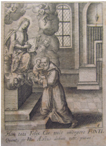
Slika 3. Neznani autor, Bogorodica pruža dijete Isusa sv. Feliksu Kantalicijskom , 1626. bakrorez, oko 85 x 58 mm, Rim, Museo Franceseano

svetom utemeljitelju franjevačkoga reda – sv. Franji Asiškom – i najvećem čudotvorcu – sv. Antunu Padovanskom 23 – ubrzo je postala najčešćom i najomiljenijom scenom iz svečeva života. 24