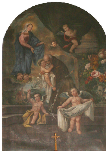
Slika 4. Neznani slikar, Viđenje sv. Feliksa Kantalicijškoga , prva pol. XIX. st. (?), ulje na platnu, 256 cm x 147, 5 cm, Varaždin, kapucinska Crkva Presvetoga Trojstva, prva bočna kapela na strani Poslanice, in situ

Osobito su ju propagirali kapucini slikama nad oltarima posvećenim sv. Feliksu, kakve nalazimo u većini kapucinskih crkava. 25 Iznimka nije ni crkva varaž-