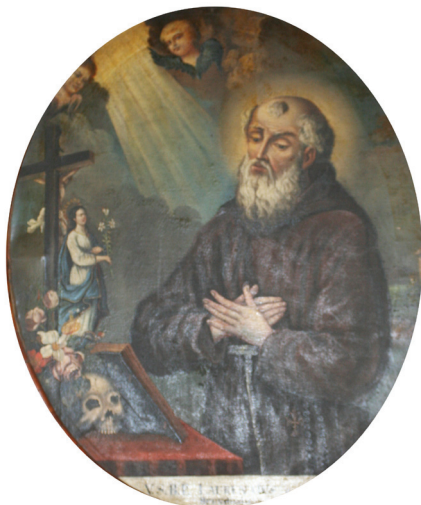
Slika 7. Neznani slikar, Sv. Lovro Brindiški , druga pol. XVIII. st. (?), ulje na platnu, 104 x 83, 5 cm, Varaždin, blagovaonica kapucinskoga samostana

Sličan odnos prema grafičkome predlošku nalazimo i na varaždinskom portretu Sv. Lovre Brindiškoga (lat. s. Laurentius a Brundisio ; tal. Lorenzo Russo da Brindisi ; Brindisi, 22. srpnja 1559. – Belem, kod Lisabona, 22. srpnja 1619.). 52 Dlanova prekriženih na grudima i spuštenoga pogleda u znak poniznosti i kontemplativnosti, svetac, prikazan u laganom poluprofilu, okrenut je prema stoliću na lijevoj strani kompozicije (Sl. 7.). Na njemu su prikazani lubanja i raspelo o koje je