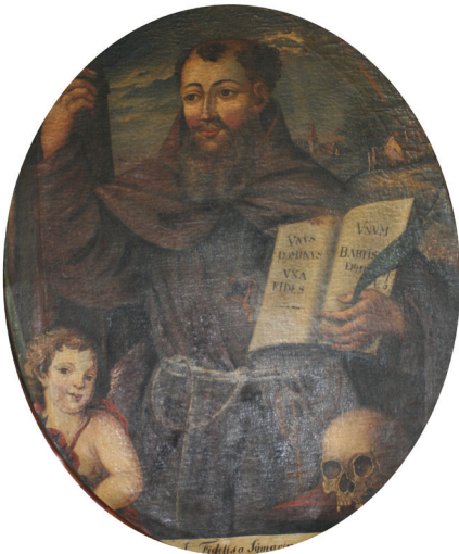
Slika 5. Neznani slikar, Sv. Fidelije iz Sigmaringena , druga pol. XVIII. st. (?), ulje na platnu, 104 x 84 cm, Varaždin, blagovaonica kapucinskoga samostana

znakove njegovoga mučeništva – mač, koplje i buzdovan. Između njih, prebačen preko lubanje prikazan je bič (lat. flagellum ), simbol svakodnevne prakse mrtvljenja tijela. Jedan od putta rukom pokazuje prema knjizi u svečevoj lijevoj ruci. Riječima ispisanim na njezinim rastvorenim stranicama i uzdignutom desnom rukom s ispruženim kažiprstom, Fidelije je predstavljen kao propovjednik spreman podnijeti mučeništvo. Prikazan u polufiguri, odjeven je u kapucinski habit