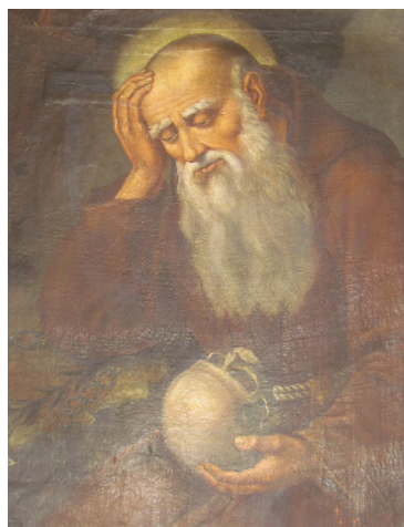
Slika 12. J. M. Lichtenreiter (?), Bl. Bernard iz Offide , druga pol. XVIII. st., ulje na platnu, 103 x 75, 5 cm, Vipavski Križ, blagovaonica kapucinskoga samostana

kojega je vidljiva strma stijena i njezin ravni izbojak na koji je bl. Bernard rukom podbočio glavu. U svemu ostalom (kompozicija, položaj tijela, fizionimija lica, atributi) slika i njezin grafički predložak odgovaraju opisanom prikazu blaženika u interijeru. 66