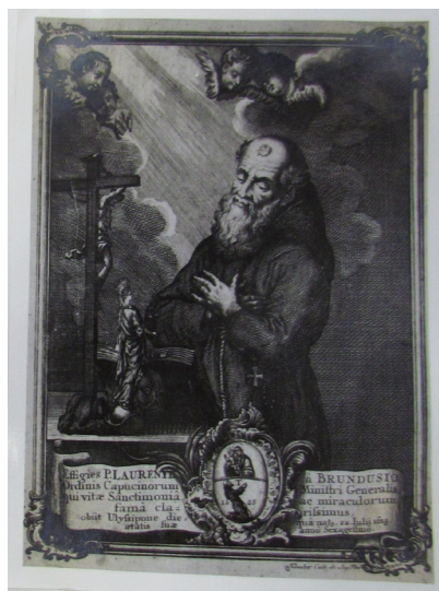
Slika 8. Braća Klauber, Effigies P. LAURENTI a BRUNDUSIO , sred. XVIII. st., bakrorez, 40 x 88 mm, Rim, Museo Francescano