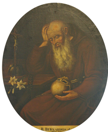
Slika 11. Neznani slikar, Bl. Bernard iz Offide , druga pol. XVIII. st. (?), ulje na platnu, 105 x 84, 5 cm, Varaždin, blagovaonica kapucinskoga samostana