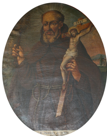
Slika 9. Neznani slikar, Bl. Anđeo iz Acrija , druga pol. XVIII. st. (?), ulje na platnu, 105 x 84, 5 cm, Varaždin, blagovaonica kapucinskoga samostana

i na bakrorezu Andrea Bolzonija iz 1743. godine (Sl. 10.), 57 istaknut palicom za mrtvljenje tijela – simbolom svakodnevne discipline kojom se bl. Anđeo pripremao za propovjedi i misijske djelatnosti među stanovništvom Kalabrije. Blaženik je prikazan u polufiguri, lagano okrenut prema lijevoj strani kompozicije, odjeven u kapucinski habit s dugim pojasom i krunicom. Kao i na ranije opisanim portretima kapucinskih svetaca, prikazan je s bradom, tonzurom i svjetlosnim svetokrugom uokolo glave. U pozadini, s desne strane slike, vidi se detalj brdovitoga pejzaža naslikan plavičastim i ružičastim tonovima s istaknutim stablom čempresa.