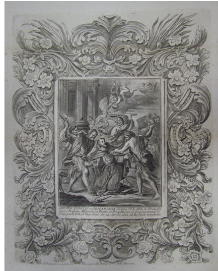
Slika 14. Sebastiano Conca, SANCTUS FIDELIS a SIGMARINGA , 1729., bakrorez, bakropis, 406 x 320 mm, Rim, Museo Francescano

na iza mučenikovih leđa zamahuju prema njemu bodljikavim mlatom i mačem. Pogleda usmjerenoga prema nebesima, iz svečevih usta izlaze riječi Iesus! Maria! Miserere Mei Deus! U donjem desnom kutu kompozicije, jedan od sudionika mučeništva pada na tlo vidjevši anđela kako, noseći lovorov vijenac i palminu grančicu, silazi s rastvorenih nebesa u gornjem desnom kutu. Grafika je kao predložak poslužila nizu kasnijih slikarskih i grafičkih djela. Jedno od njih je slika Mučeništvo sv. Fidelija (1729.) koju je povodom proslave Fidelijeve beatifikacije, 24. ožujka 1729., za baziliku sv. Ivana Lateranskoga u Rimu, u kojoj je svečanost održana, naslikao Sebastiano Conca (Gaeta, 8. I. 1680. – Napulj, 1. IX. 1764.). Sliku koja se, nažalost, nije sačuvala, u medij grafike je preveo sam Conca (1729.; Sl. 14.). 79 Fidelijevi mučitelji na njoj su prikazani kao rimski vojnici, a čitav je prizor smješten u rimski ambijent dočaran masivnim klasičnim stupovima, kojima je perspektivno iluzionirana prostorna dubina. U stražnjem planu, djelomično zakrivena drve-