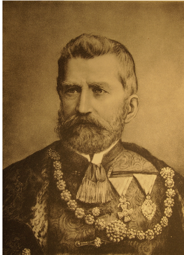
Slika 1. Portret Ognjeslava Utješenovića Ostrožinskog; Andra Gavrilović, Znameniti Srbi XIX. veka , godina II., Srpska štamparija, Zagreb, 1903., slika II.

Do izgradnje crkve zasigurno nikada ne bi došlo da se stjecajem okolnosti početkom 1880-ih godina na čelnim mjestima županije te grada nisu nalazili pravoslavci: varaždinski veliki župan bio je Ognjeslav Utješenović Ostrožinski (Ostrožin, 21. 8. 1817. – Zagreb, 8. 6. 1890.; veliki župan varaždinski 1875. – 1886.), a gradonačelnik Milan Vrapčević (Vrabčević) (1834. – 1899., varaždinski gradonačelnik 20. 7. 1881. – 9. 6. 1885.). 2 Kao pripadnici političke i kulturne elite tadašnje Hrvatske oni su osigurali potrebne dozvole te sredstva za gradnju, pa i pomoć (od 200 forinti) samog vladara Franje Josipa I. 3