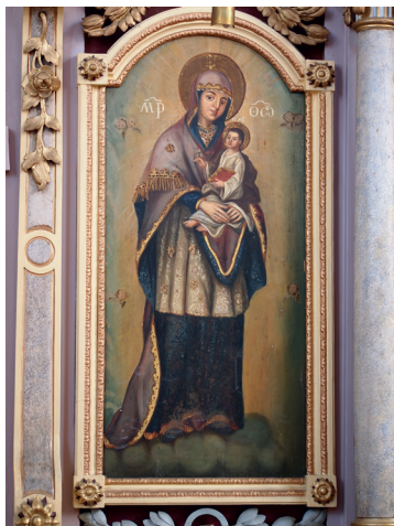
Slika 12. Ikona Bogorodice s ikonostasa crkve svetog Đurđa u Varaždinu

što je odraz okolnosti da ikone nisu namjenski slikane za Varaždin već Zagreb. Na carskim dverima uz uobičajene Blagovijesti ( Navještenje ) prikazani su i Kralj David s lirom te lik nepoznatoga kralja (možda Solomon), a na bočnim dverima Sveti arhidakon Stefan i Arhanđel Mihajlo ( Mihovil ). Iznad bočnih vrata stoje scene iz Abrahamova života – Abraham žrtvuje Izaka i Susret Abrahama i Mekisedeka , a iznad središnjih uobičajena ikona Tajne ( Posljednje ) večere .