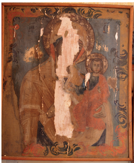
Slika 17. Ikona Bogorodice s djetetom u vlasništvu crkve svetog Đurđa u Varaždinu