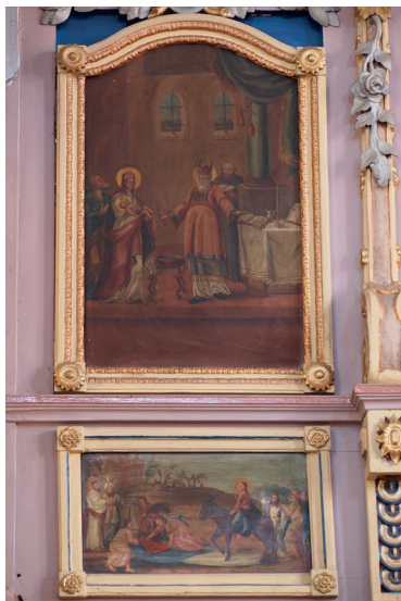
Slika 10. Obrezanje Kristovo i Ulazak u Jeruzalem, ikone s ikonostasa crkve svetog Đurđa u Varaždinu