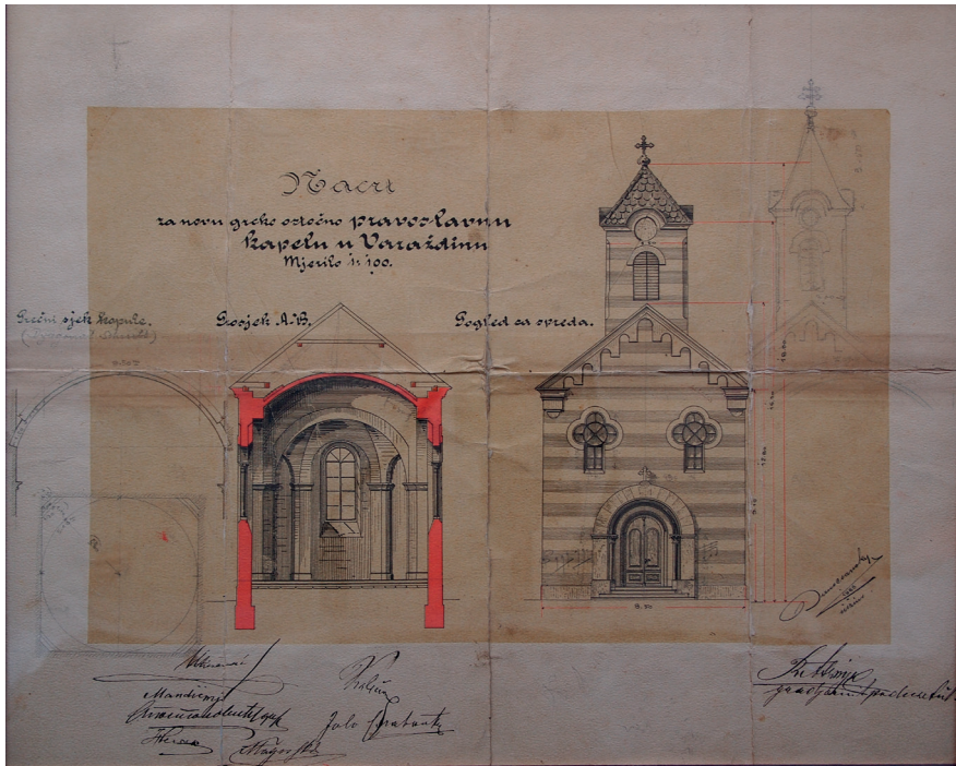
Slika 3. Žiga Baločanski, Projekt za glavno pročelje i poprečni presjek, 1883.

pravokutnog tlocrta i poligonalnog svetišta dugoj 14,5, širokoj 7,30, a visokoj do svoda 9 metara. Iznad ulaza podignut je zvonik visok 22,75 metara. 28