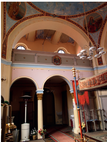
Slika 18. Unutrašnjost crkve svetog Đurđa u Varaždinu, pogled prema koru s ikonom Krunjenja Bogorodice