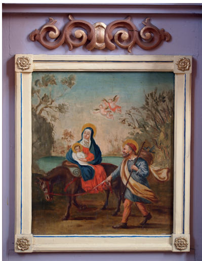
Slika 9. Bijeg u Egipt, ikona s ikonostasa crkve svetog Đurđa u Varaždinu

izrazito su nevješto naslikane ikone Susreta Abrahama i Melkisedeka , Večere u Kani Galilejskoj , Tajne (Posljednje) večere ... Na većini ikona uočavaju se nespretnosti u konstrukciji linearne perspektive, likovi imaju prevelike glave, pokreti su im shematizirani, a kompozicija često nedovoljno čvrsta.