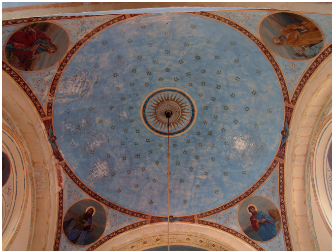
Slika 6. Kupola crkve svetog Đurđa u Varaždinu, današnje stanje