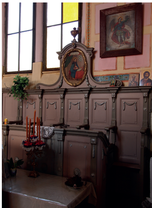
Slika 15. Pjevница s ikonom Svetog Romana Meloda (Slatkopjevca) crkve svetog Đurđa u Varaždinu

S obzirom na stilske odlike drvorezbarije te ikona Raspeća, Bogorodice, Svetog Ivana i Polaganja u grob na križu na oltaru crkve vjerojatno je i ovaj komad crkvene opreme u Varaždin dospio iz Zagreba. Zagrebačka parohijska crkva poklonila je varaždinskoj, naime, osim ikonostasa i pjevница i stolice, zatim četiri drvena i nepoznati broj metalnih „čirjaka“ (svijećnjaka), zatim rebnice (?) te polijelej, luster, koji je nedavno uklonjen i mjesto njega je postavljen novi. 42 Osim polijeleja sva stara oprema zagrebačke crkve nalazi se i danas u Varaždinu čime je vrlo vrijedna cjelina, rijetko reprezentativna za pravoslavne crkve zapadnog dijela Hrvatske, te općenito za hrvatsku umjetnost samoga početka 19. stoljeća, ostala sačuvana.