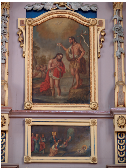
Slika 14. Krštenje Kristovo i Uskrsnuće Lazarevo, ikone s ikonostasa crkve svetog Đurđa u Varaždinu

Središnja je zona ikonostasa podijeljena u dva reda. Donji čine vodoravno položene manje ikone s temama iz života Krista i Bogorodice – Ulazak u Jeruzalem , Svadba u Kani Galilejskoj , Prikazanje Isusovo u hramu , Preobraženje Kristovo , Smrt Bogorodice , Uskrsnuće Lazarevo i Rođenje Bogorodice .