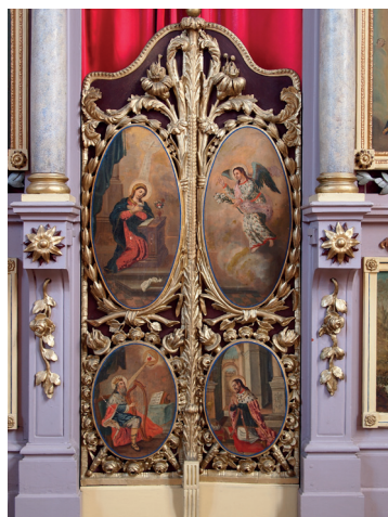
Slika 13. Carske dveri ikonostasa crkve svetog Đurđa u Varaždinu