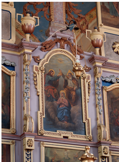
Slika 11. Krunjenje Bogorodice, ikona s ikonostasa crkve svetog Đurđa u Varaždinu

Središnja ikona na ikonostasu, Krunjenje Bogorodičino, kasniji je rad. Stilsko rješenje odaje kako se radi o djelu oslonjenom na nazarensko slikarstvo. Moguće je da je prvotna ikona bila uništena (možda se i zapalila budući da se ispred nje nalazi jedna od svjetiljki ikonostasa), pa je zamijenjena novom, ili je stara radikalno preslikana.