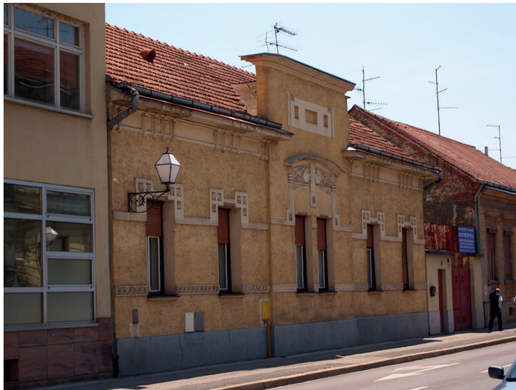
Slika 19. Parohijski dom u Varaždinu