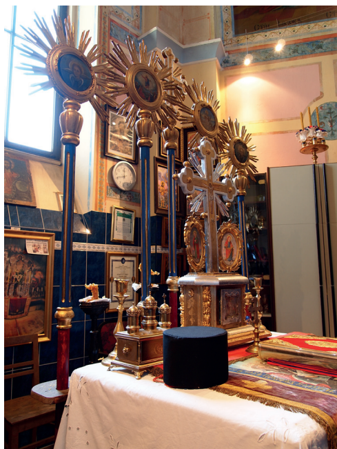
Slika 16. Ripide i oltar crkve svetog Đurđa u Varaždinu, novosadski rad