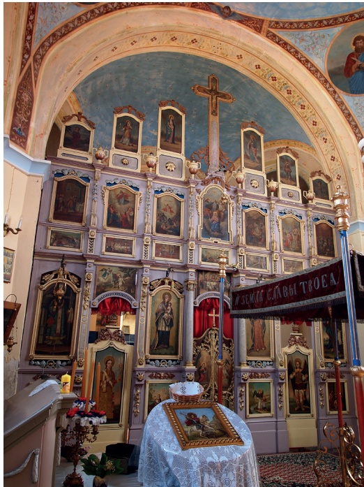
Slika 7. Ikonostas crkve svetog Đurđa u Varaždinu, sadašnje stanje

Kada je točno izrađen zagrebačko – varaždinski ikonostas, tko je autor njegova stolarskog okvira, a tko ikona, nije se moglo ustanoviti budući da je arhivsko gradivo iz prve polovine 19. stoljeća u Srpskoj pravoslavnoj crkvenoj općini u Zagrebu tek fragmentarno sačuvano. Gotovo je sigurno, međutim, da je izveden ili u drugom ili trećem desetljeću 19. stoljeća.