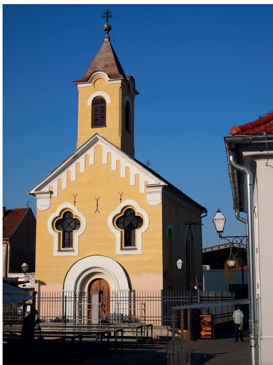
Slika 2. Pravoslavna crkva svetog Đurđa u Varaždinu, današnje stanje