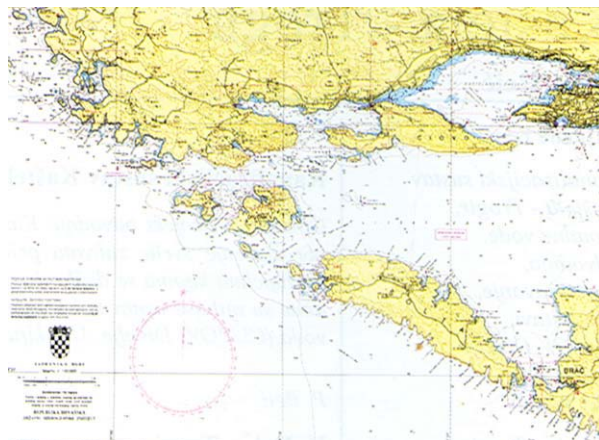
Slika 1. Širi prostor Kaštelanskog zaljeva i Splitskog kanala-sluzbena pomorska karta

va trebaju učiniti i konkretna rješenja u smislu sanacije jednog od najzagađenijih dijelova istočne jadranske obale.