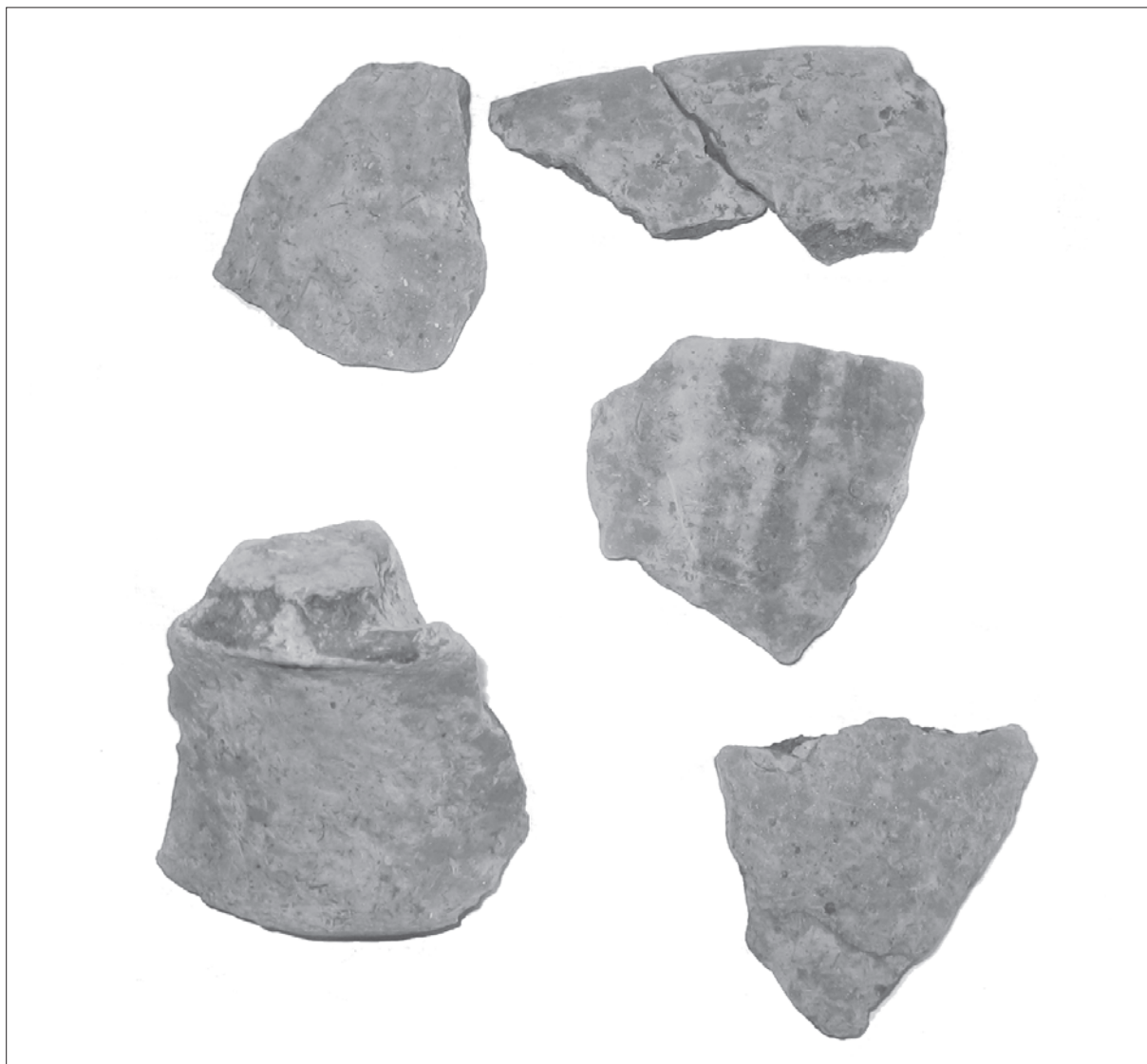
Sl. 4 Slavonski Brod, Galovo, grobni prilozci – slikana keramika.

Fig. 4 Slavonski Brod, Galovo, grave goods – painted pottery.