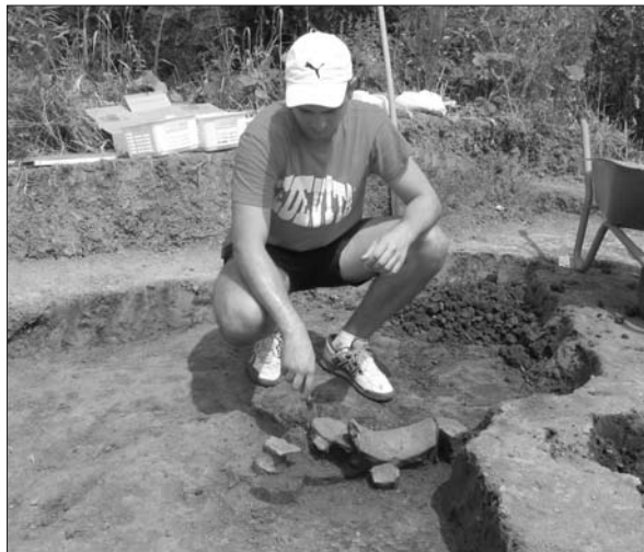
Sl. 3 Slavonski Brod, Galovo, skupina posuda kao prilog uz pokojnika.

Fig. 2 Slavonski Brod, Galovo, burial pit 2242/2243 during the excavations.