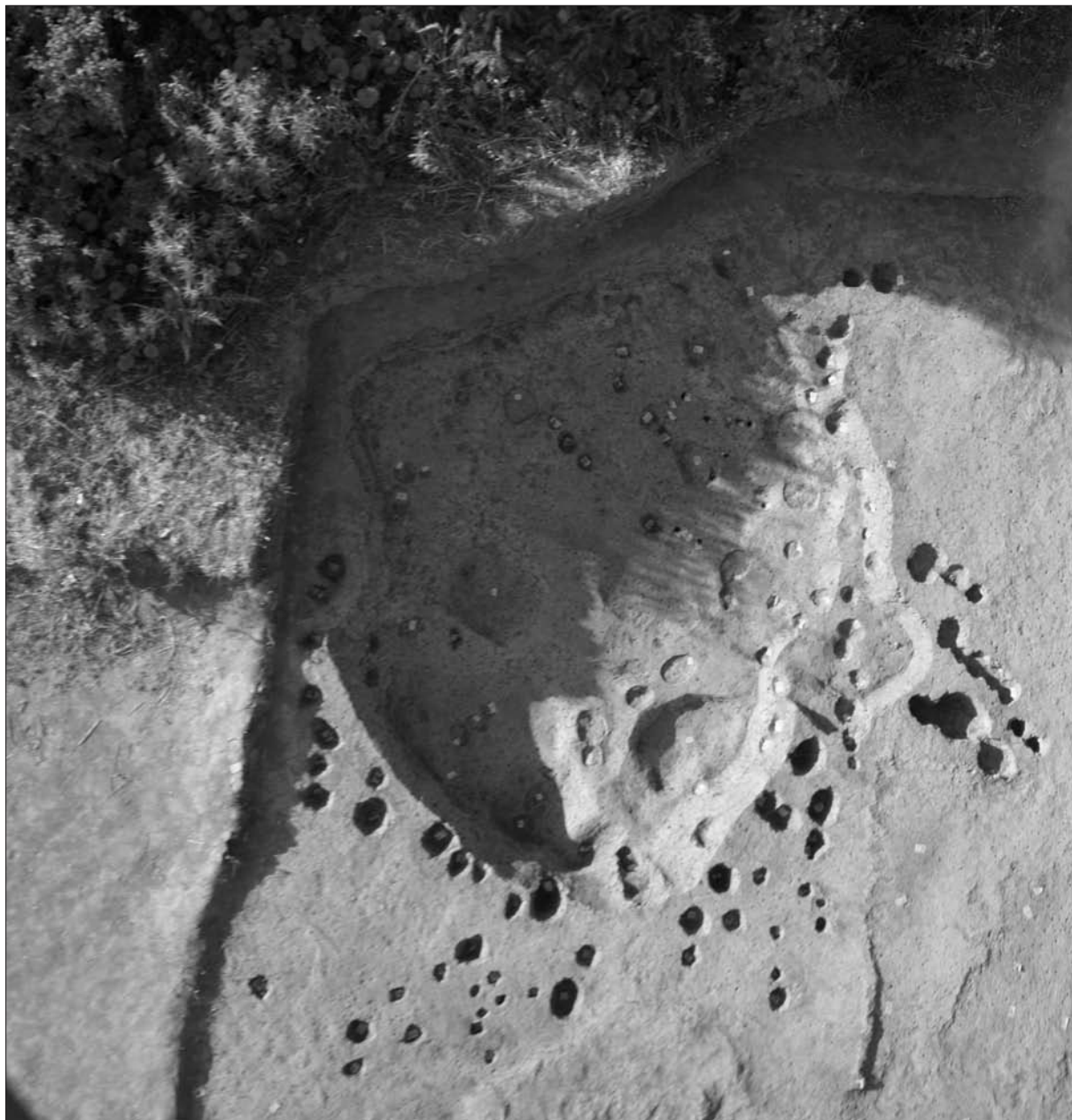
Sl. 1 Slavonski Brod, Galovo, zračna snimka grobne jame 2242/2243 (snimio: J. Sudić).