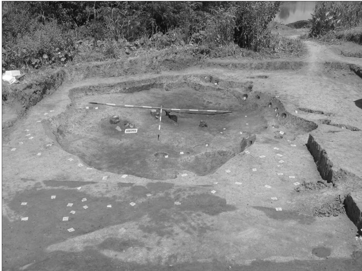
Sl. 2 Slavonski Brod, Galovo, grobna jame 2242/2243 u tijeku istraživanja.

Fig. 2 Slavonski Brod, Galovo, burial pit 2242/2243 during the excavations.