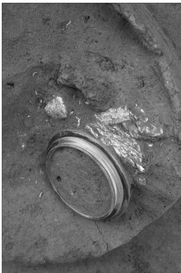
Sl. 5 Grob LT 86 – staklena narukvica, spaljeni ostaci pokojnice i željezni pojas u zdjeli u funkciji urne.

Fig. 4 Grave LT 89.