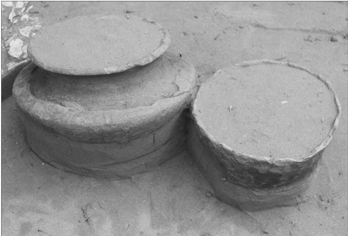
Sl. 6 Grob 90 – lonac i zdjela.