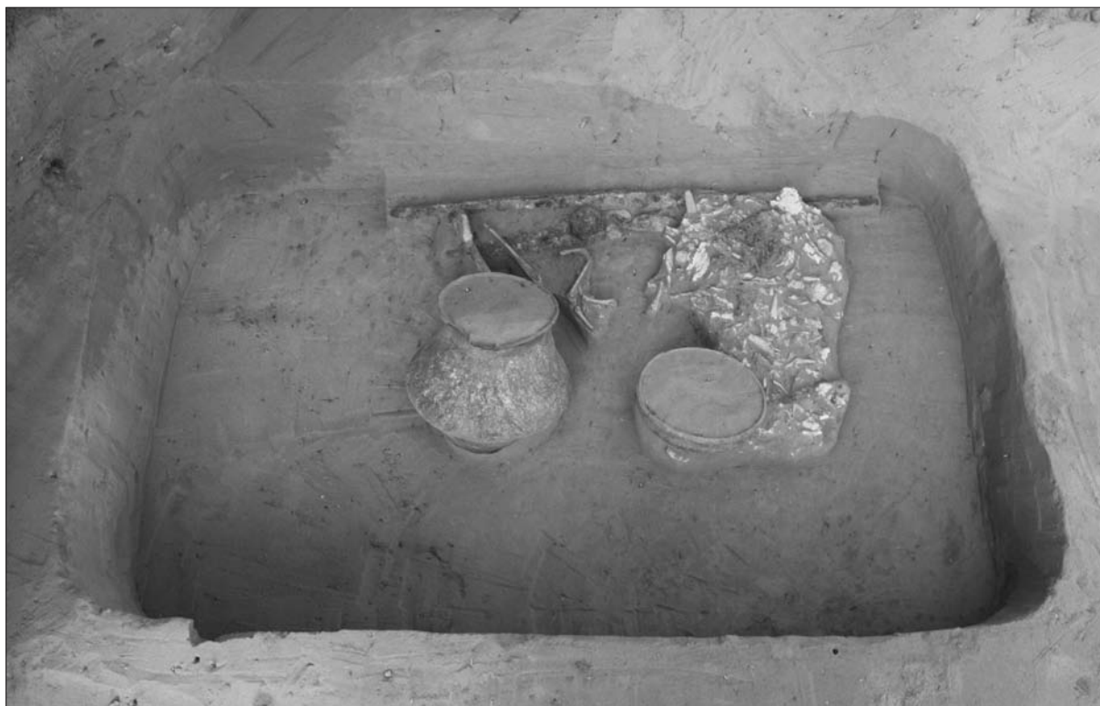
Sl. 4 Grob LT 89.

Fig. 4 Grave LT 89.