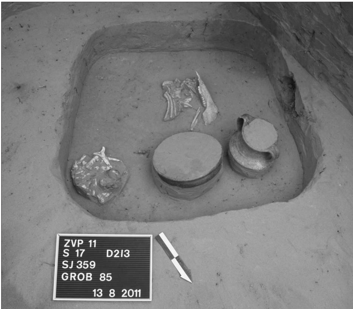
Sl. 3 Grob LT 85.