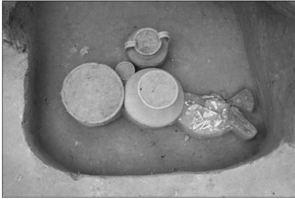
Sl. 2 Grob LT 83 – sjeverni dio groba sa spaljenim ostacima pokojnika, nalazima i popudbinom.