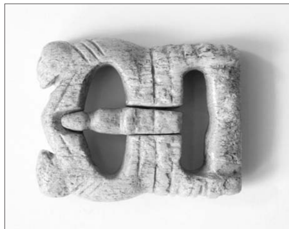
Sl. 3 Rezbarena koštana predica.

Starije cjeline srednje faze ukopavanja predstavljaju osobito vrijednost ovoga lokaliteta jer je to kontekst u kojem su utvrđeni sitni nalazi koje možemo povezati s prisutnošću viteških redova u Gori, ivanovaca i, osobito, templara. Od pronađenih novaca vremenu ivanovaca pripadaju, kao prvo, dva primjerka srebrnog denara ugarsko-hrvatskoga kralja Ludovika I. s motivom saracenske glave (datiraju se od 1373. do 1382.). Među prstenjem se ističe primjerak srebrnog pečatnog prstena s