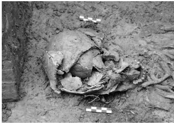
Sl. 5 S-karičica in situ , grob 423.