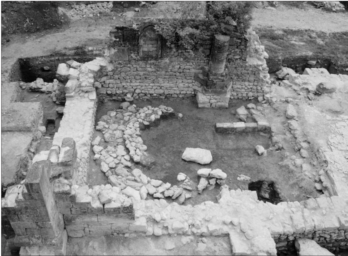
Sl. 2 Pogled tijekom istraživanja na ostatke romaničke apside unutar svetišta ranogotičke crkve.

Fig. 2 View of the research on the remains of a Romanesque apse within the sanctuary of the early Gothic church.