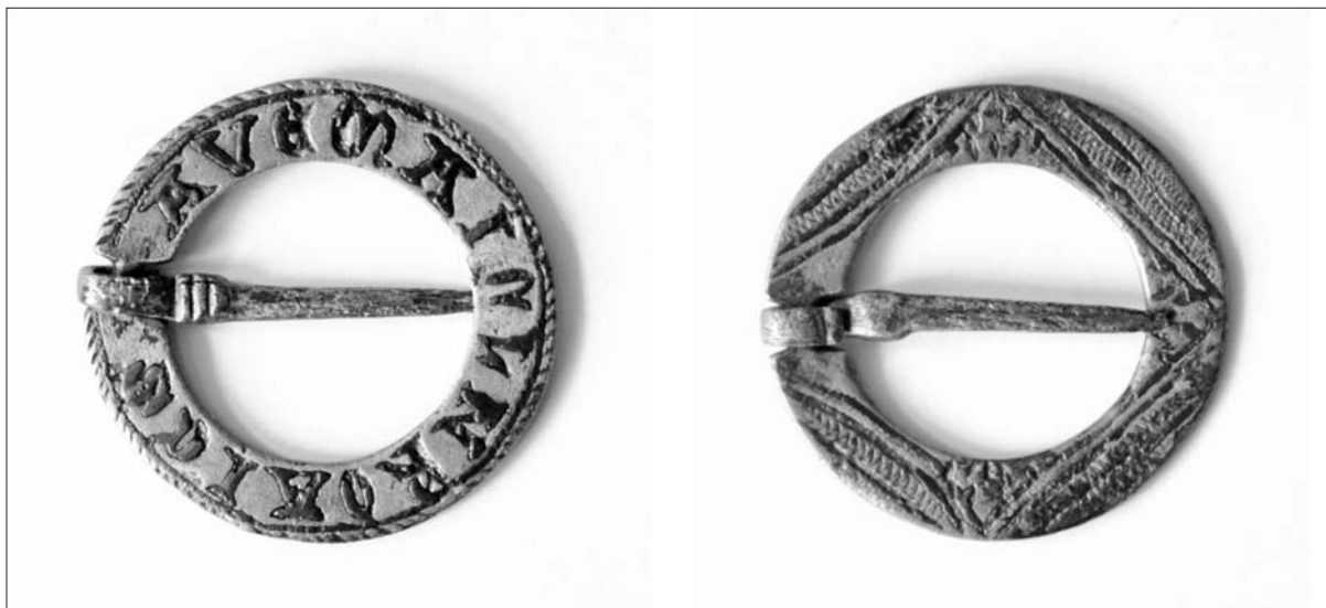
Sl. 4 Okrugli broš s natpisom.