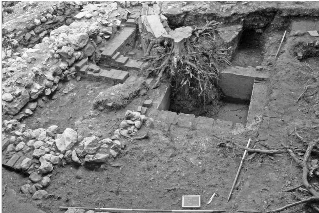
Sl. 2 Sektor Zapadno od sjeverne kule tijekom istraživanja.