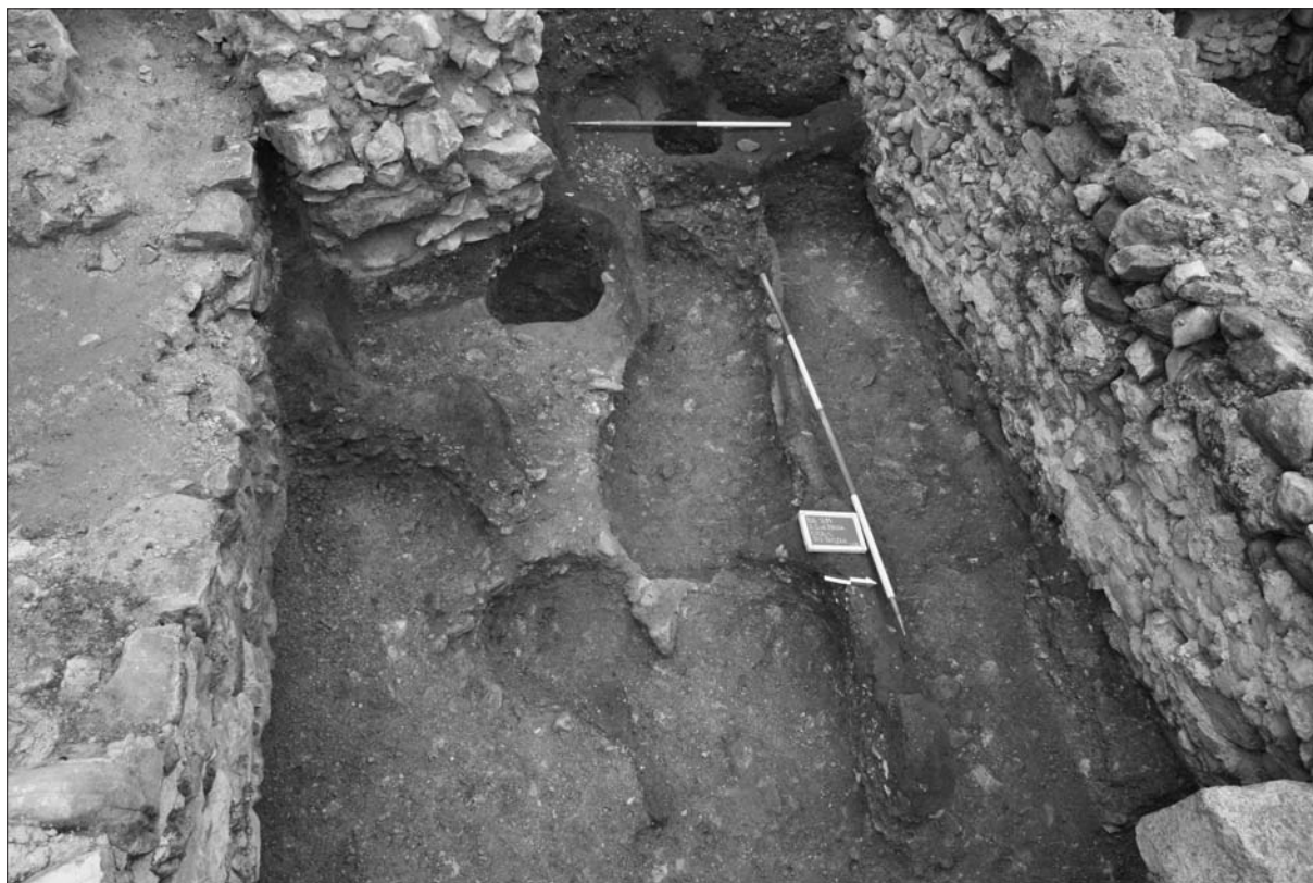
Sl. 1 Ostaci crnog i smeđeg kulturnog sloja ustanovljeni u zapadnom dijelu sektora Sjeverno od broda.

Fig. 1 The remains of black and brown cultural layers established in the North of the nave western sector.