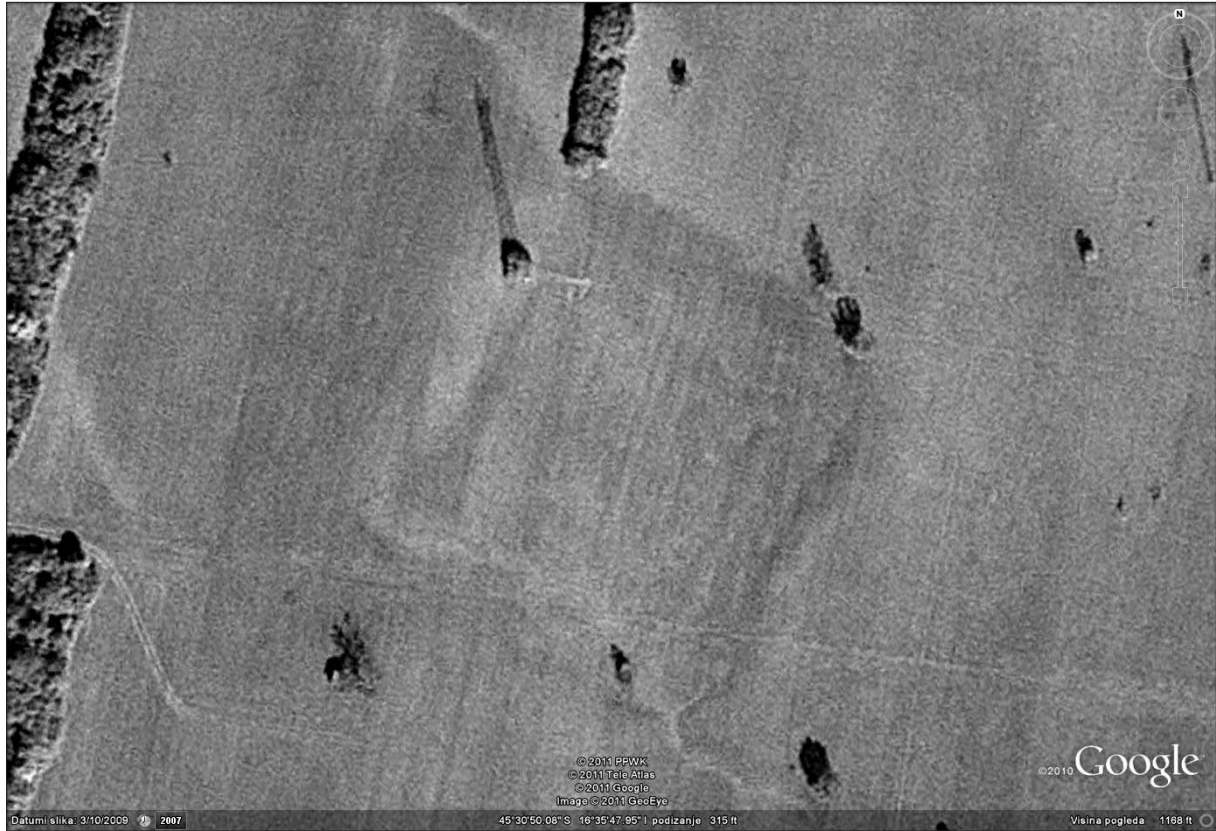
Sl. 2 Uvećani satelitski snimak gradišta.