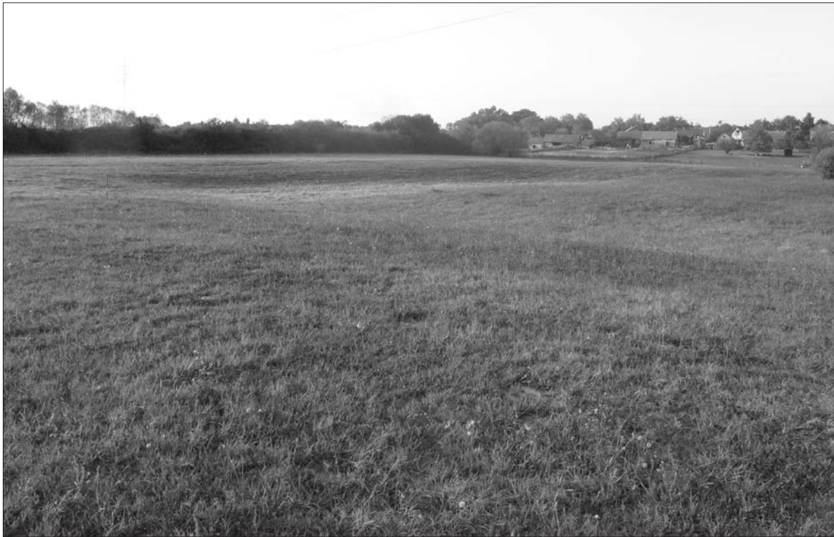
Sl. 5 Pogled na jugozapadni dio gradišta Osekovo – Srednje Selo.