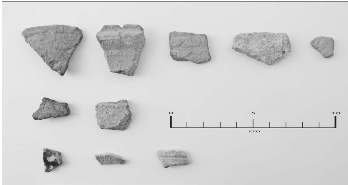
Sl. 4 Površinski nalazi keramike s lokaliteta Osekovo – Srednje Selo (autor: H. Kalafatić).

Fig. 4 Surface finds of pottery from the Osekovo - Srednje Selo site (autor: H. Kalafatić).