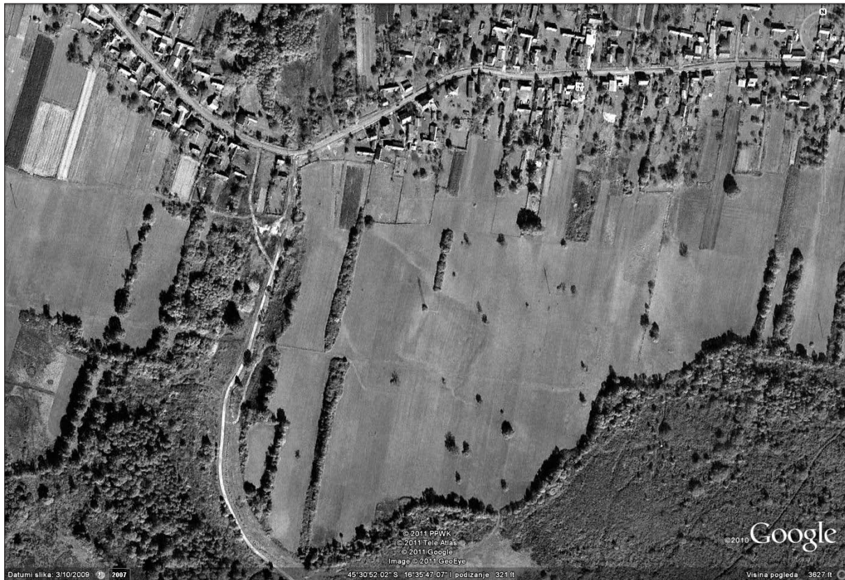
Sl. 1 Satelitski snimak gradišta.

Key words: Field Survey, earthen fortification, Late Middle Ages, remote interpretation, Moslavina