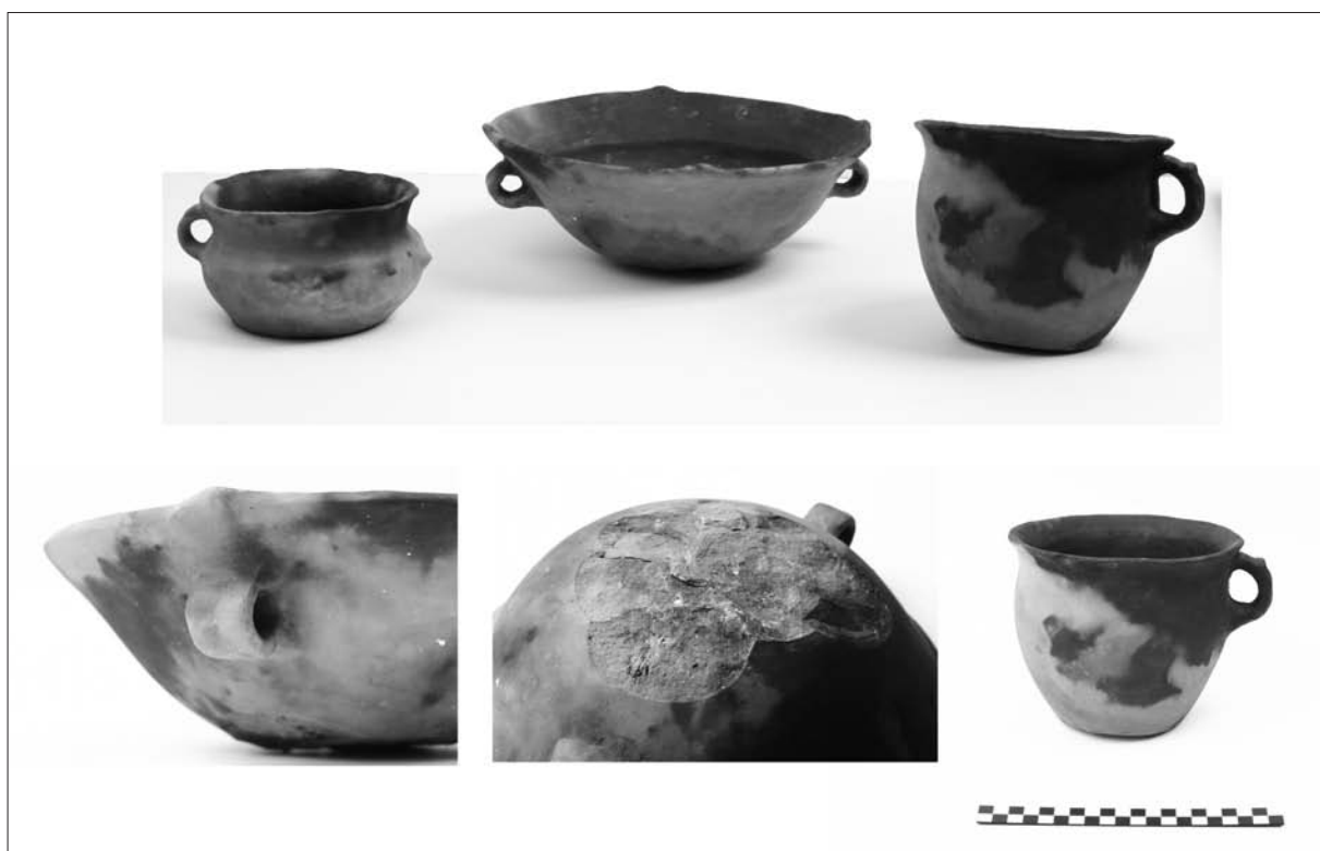
Sl. 4 Tragovi na keramičkim posudama kao posljedica pečenja na otvorenoj vatri.

de tragove vatre, a jače je zapečen dio kupole koji se nalazi direktno iznad ložišta. Originalna je jama bila ukopana u sloj šljunka i pijeska, a takva se podloga nameće kao idealna za konstrukciju peći. Tragovi vatre teže se materijaliziraju na takvoj podlozi, a iz tih razloga potrebno je izvesti test na izvornoj lokaciji.