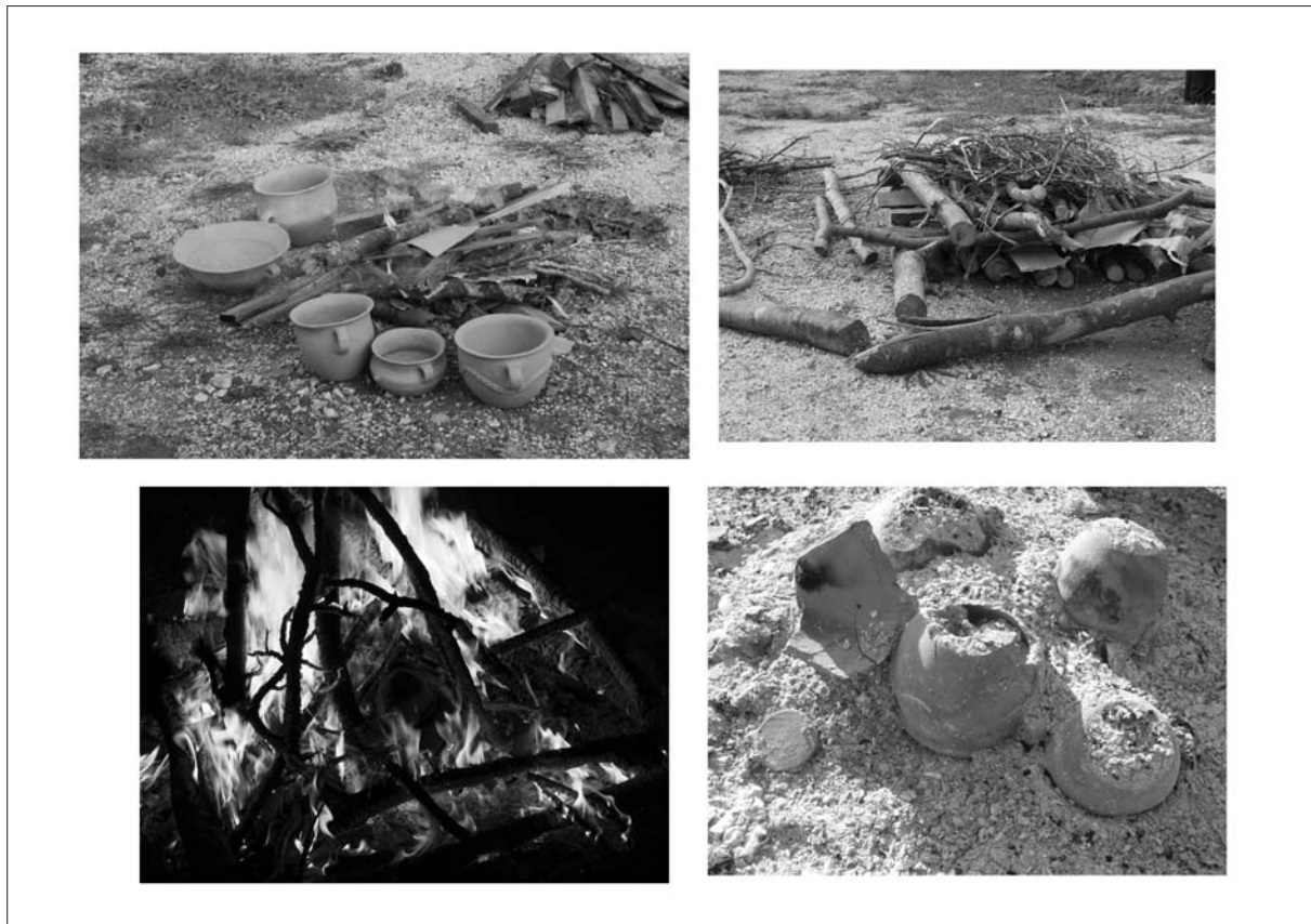
Sl. 3 Crikvenica - pečenje na otvorenoj vatri.