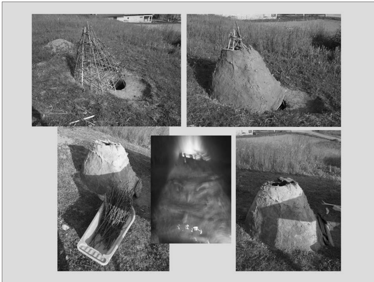
Sl. 2 Faze gradnje peći - eksperiment treći.