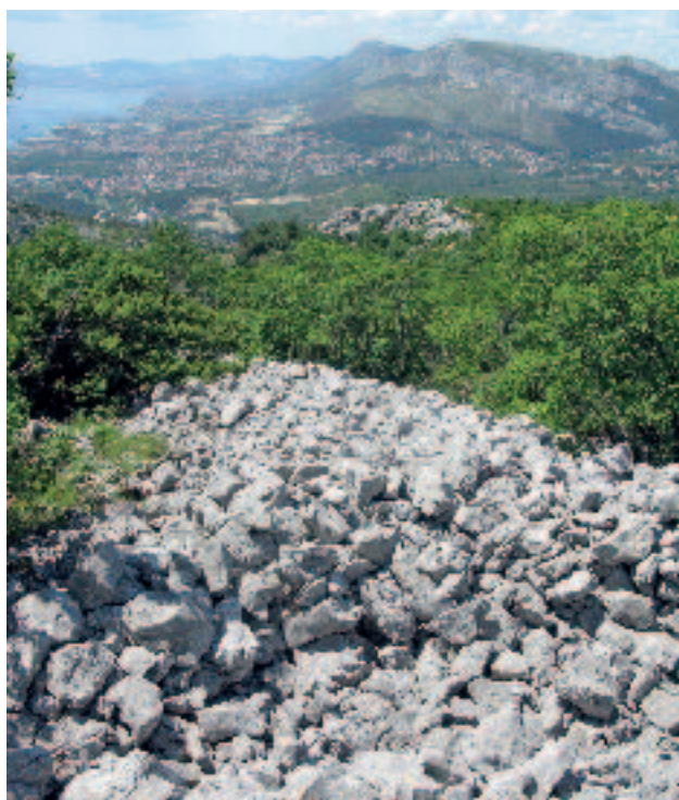
Slika 13. Bedem gradine na Kučinskim docima. U pozadini Kozjak, Solin i Kaštela