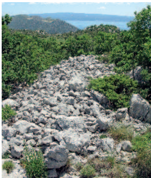
Slika 12. Bedem gradine na Kučinskim docima