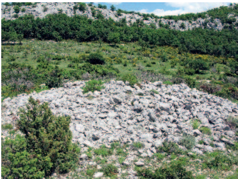
Slika 10. Gomila na Kučinskim docima