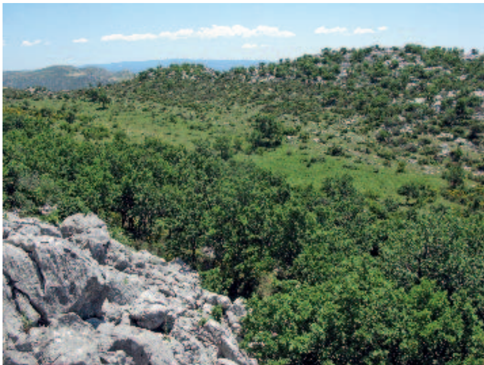
Slika 9. Pogled na Kučinska doca