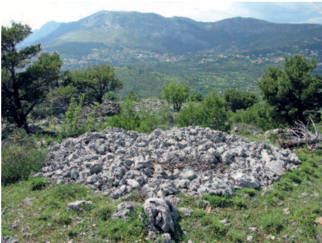
Slika 3. Gomila Mačkovac