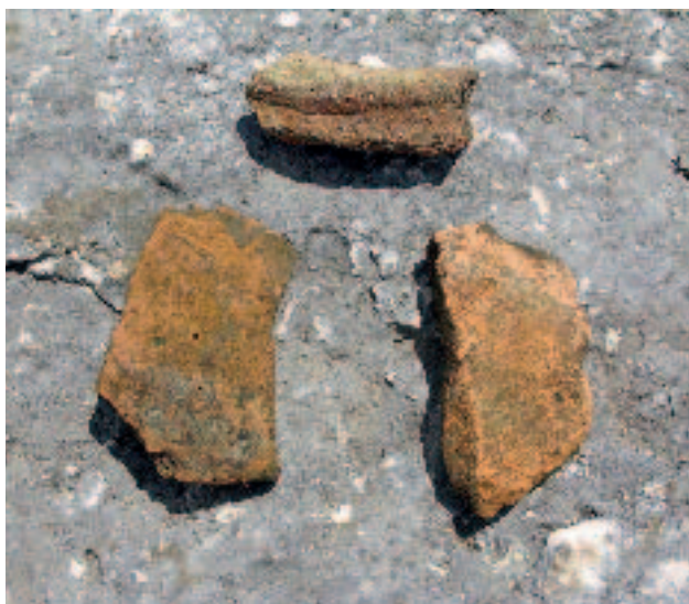
Slika 7. Rimska keramika s Kapine – tegule i ulomak drške