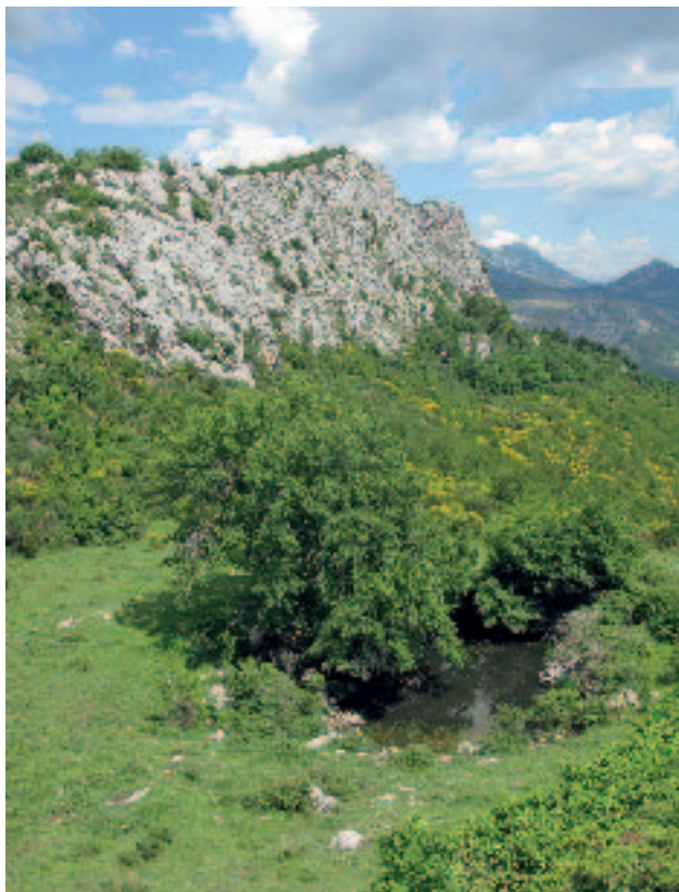
Slika 5. Lokva na prijevoju kod gradine na Kapini