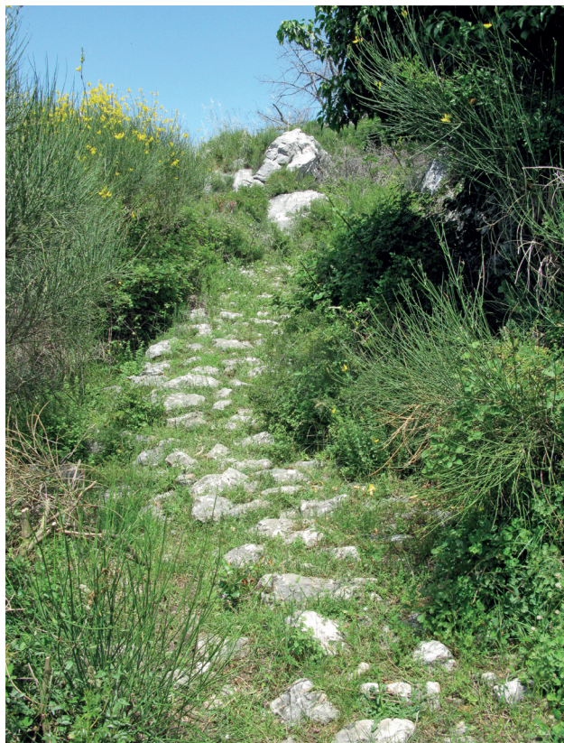
Slika 8. Put od Kapine prema Kučinskim docima

Iz opisa je jasno da sjeverna strana ove zaravni završava također strmim liticama mosorskih obronaka. Na najvišem krševitom vrhu s te strane, gotovo iznad spomenute lokve, nalazi se do sada u literaturi nezabilježena prapovijesna gradina (sl. 11). Južna i veći dio zapadne strane gradine je strm. Vrh je kamenit, prepun škrapa i potpuno erodiran. Kameni nasip – ostatak bedema – sačuvan je u dužini od oko 120 metara i brani dio sjeverne i zapadnu stranu odakle je pristup gradini iz pravca Mosora vrlo lagan. Bedem, mjestimične širine i do 7 m i visine maksimalno 2 m, započinje gotovo na rubu gradine s istočne strane vrha te se spušta prema sjeveru i u zadnjih dvadesetak metara skreće prema zapadu (sl. 12 i 13). Na tom dijelu vidljivo je ulegnuće na bedemu širine 1 do 2 m – vjerojatno tragovi ulaza. Neposredno do pretpostavljenoga ulaza planinarska staza presjekla je bedem gradine.