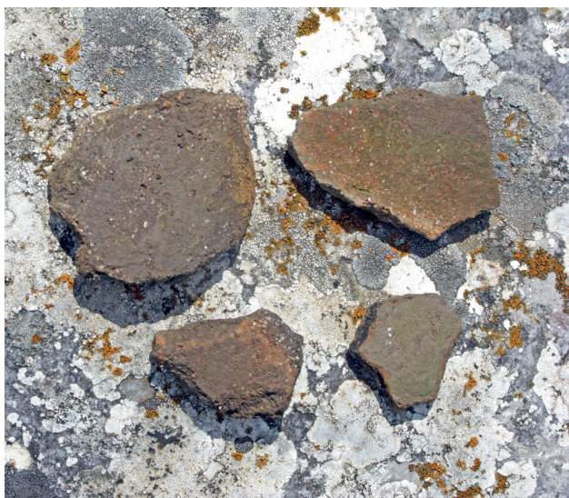
Slika 6. Prapovijesna keramika s Kapine