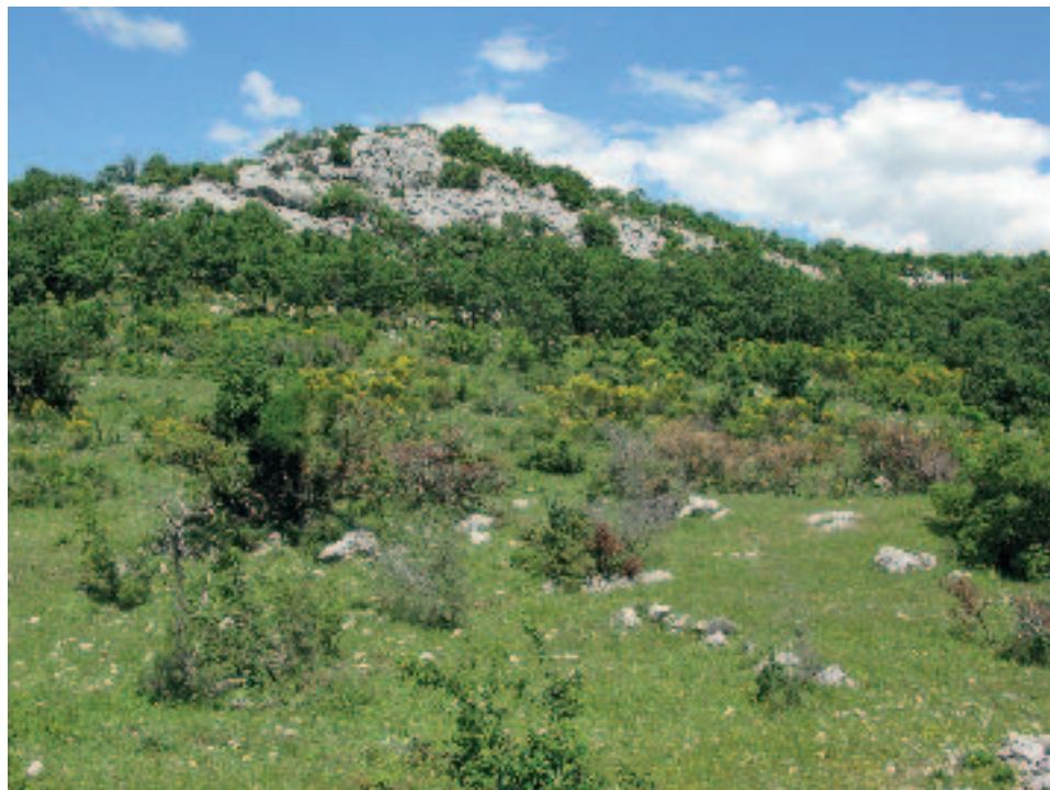
Slika 11. Južna strane gradine na Kučinskim docima