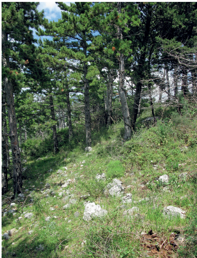
Slika 4. Bedem na Kapini – zapadna strana