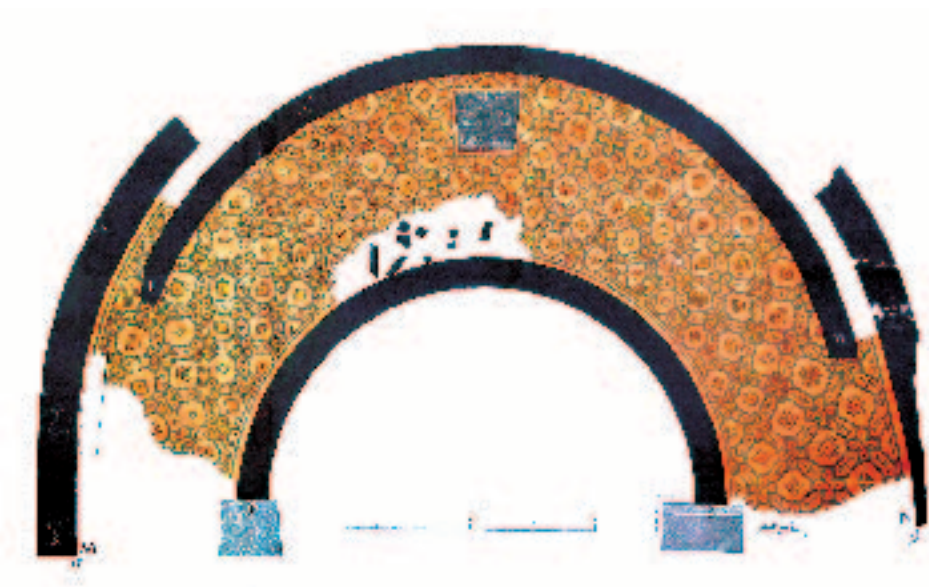
Slika 2. Crtež mozaika u ambulatoriju katedrale s posvetnim natpisom biskupa Simferija i Hezihija (F. Bulić 1904)