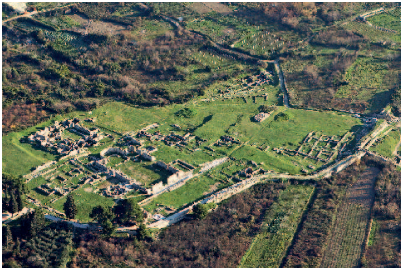
Slika 1. Episkopalni kompleks u Saloni