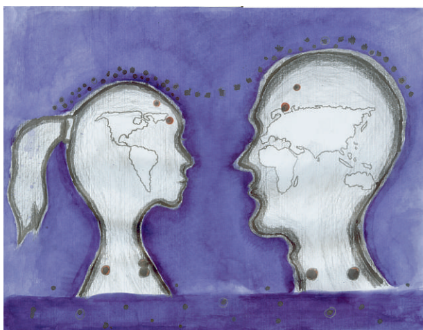
Vilim Borovnjak (15): Pogled u budućnost / Looking to the future OŠ Kralja Tomislava, Nova cesta 92, 10000 Zagreb