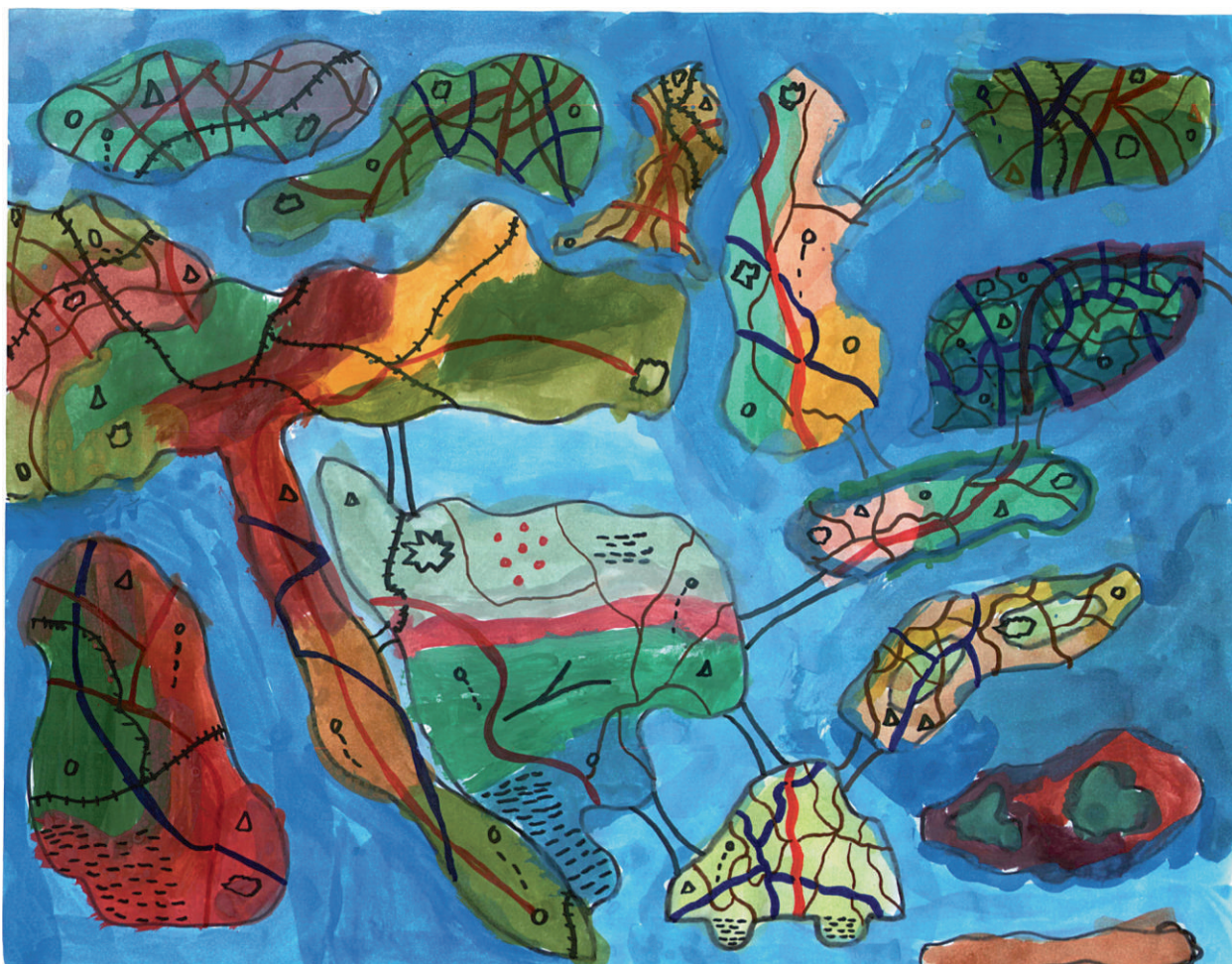
Jakov Jugović (9): Čudne države / Strange countries Osnovna škola Brod Moravice, Školska 3, 51312 Brod Moravice

Pobjednički dječji radovi za koje navodimo ime i prezime autora, njegovu starost (zapravo mladost!) i adresu škole: