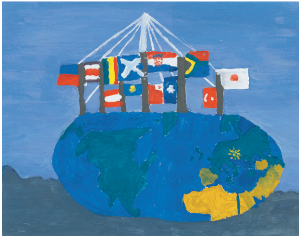
Ivan Hećimović (9): Plovimo zajedno / Sailing together

In addition to the six winning drawings, the jury decided to acknowledge ten additional drawings: