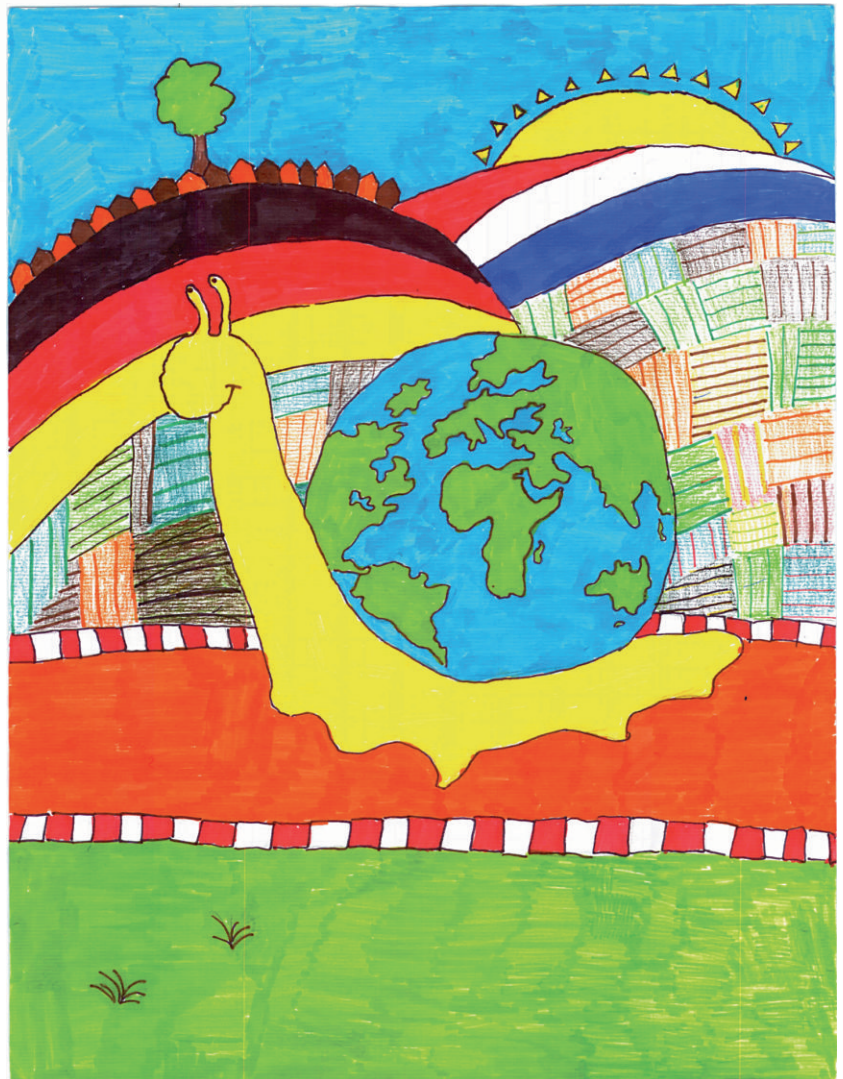
Lucija Ćosić (13): Tlo i čovjek – budimo suradnici / Earth and man – Let's be associates Osnovna škola braće Radića Školska 20, 10312 Kloštar Ivanić