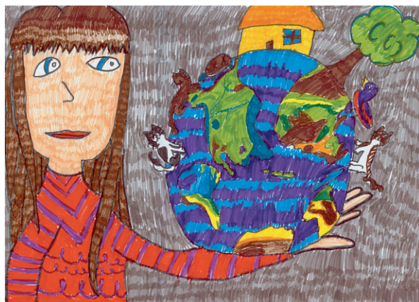
Laura Pavić (8): Pružam ruku svijetu / Reach out worldwide III. Osnovna škola Bjelovar, Tome Bakača 11d, 43000 Bjelovar