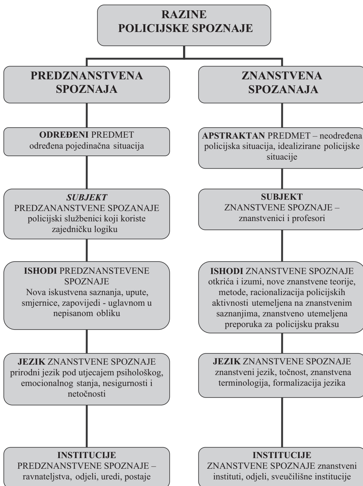
Slika 1: Shema razina policijske spoznaje (Izvor: Porada, Erneker, Holcr, Holomek, 2006:24)