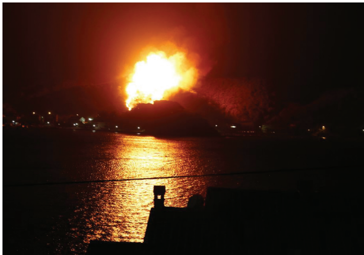
Slika 4. Noćni požar u Supetarskoj Drazi snimljen prije dolaska vatrogasaca

Dana 23. srpnja 2012. pod naletima orkanskih udara bure došlo je do požara na području Supetarske Drage. Iako je opožarena površina za mnoge beznačajna, za nas, ona je najveća od 1983. Dojavu o požaru VOC Rab zaprimio je u 00:38, a dojava je glasila kako gori šuma te da se radi o većem požaru (slika 4.)