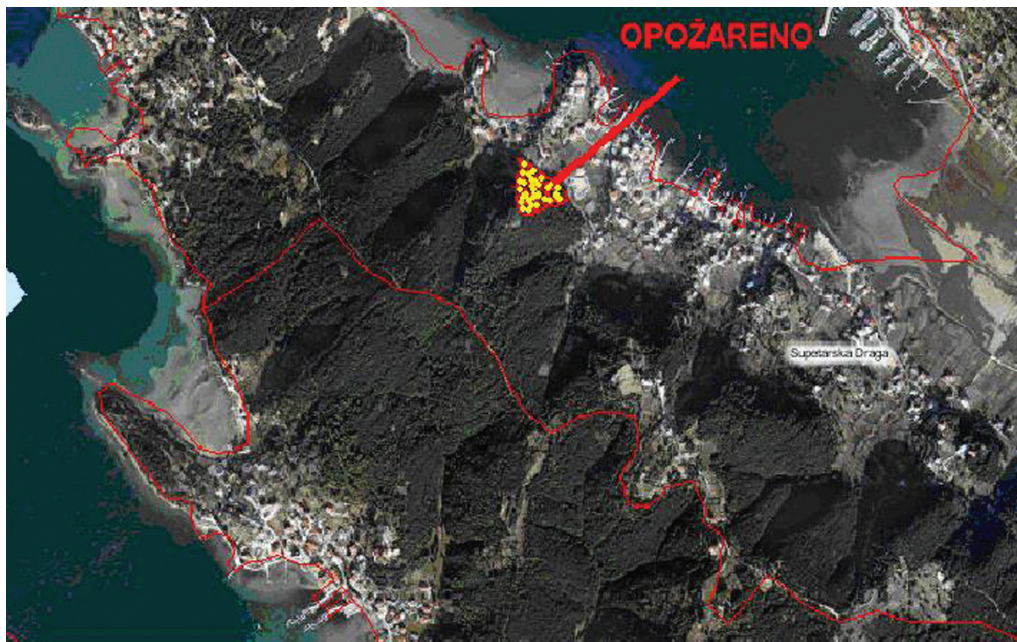
Slika 5. Makrolokacija nastanka požara u Supetarskoj Drazi