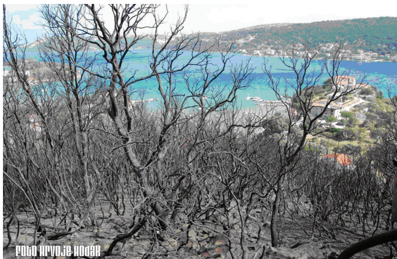
Figure 6. Part of the burnt areas

Iz ovog požara je vidljiva važnost napornog rada vatrogasaca u podizanju vatrozaštite. Svaka informacija o bilo čemu važnome za ovakav događaj, poput raspoređene opreme za gašenje unutar firmi, autocisternama na otoku i sl. koje se godinama prikupljaju, pokazale su se izuzetno značajne. Također i sam angažman građana koji su se ponudili da sudjeluju na pomoćnim poslovima te koordinacija i uvježbanost postrojbi za ovakve događaje ključ su uspjeha. A sve potvrđuje organizacija zaštite od požara svih subjekata na svim razinama.