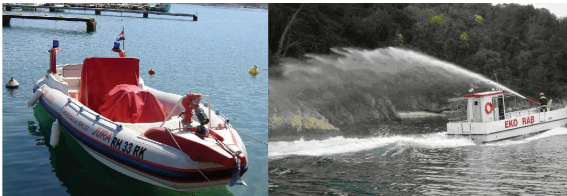
Slika 1. Plovila za gašenje požara