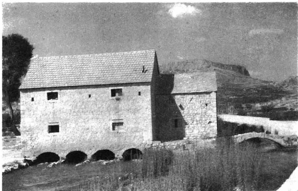
Sl. 1. Velika Gabriča. Veća zgrada obnovljena mlinica. Manja je stara kula sa stupom, valjda najstarija sačuvana mlinica. Do nje vodi jednooki stari mostić