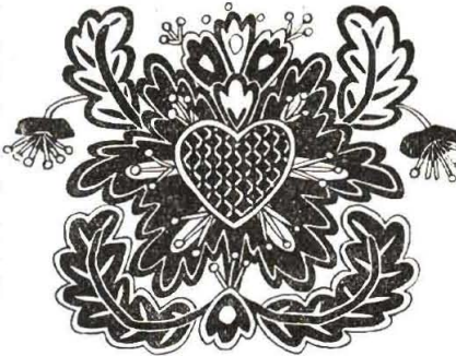
7. Barokni ukras sa motivom srca na alovcu poculice iz Gušće (kot. Sisak). (Crtež Zdenke Sertić).

Ali od presudnog značenja je jedna druga činjenica. Kršćanstvo nije primilo u svoj sakralni inventar životinjsko srce, ali je pokraj toga ipak