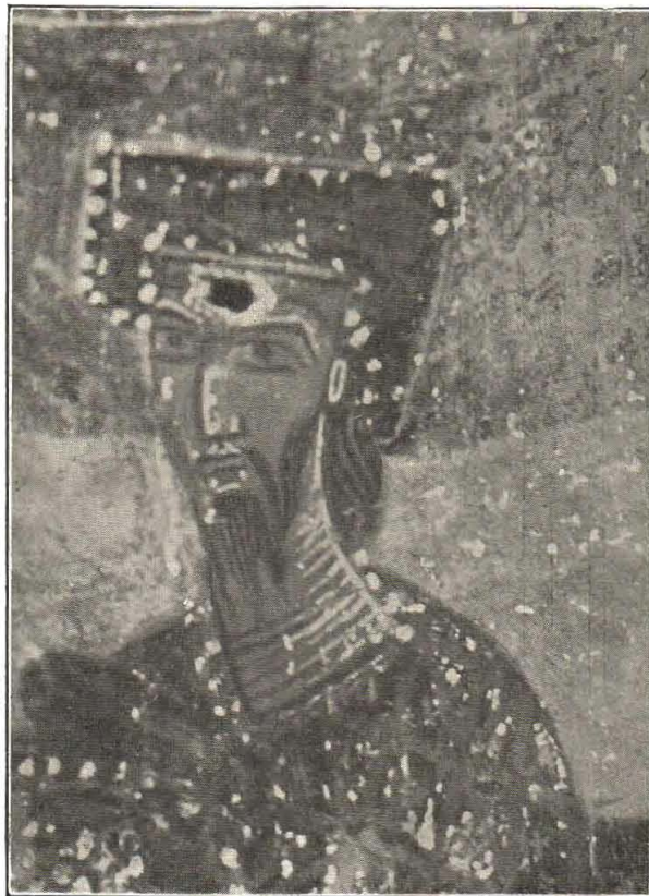
(Slika 7.) Hrvatska kruna u Stonu.

Koji je od ovih hrvatskih vladara predstavljen ovom slikom? Ili Mihajlo Tomislav prvi hrvatski kralj, ili Mihajlo Kresimir II., jedan od te dvojice hrvatskih kraljeva, koji su imali krsno ime Mihajlo. Zato mi držimo, da je crkvice i slika iz X. vijeka. Da je Tomislav imao krsno ime Mihajlo, pokazuje kronika grada Barija (u južnoj Italiji), koja piše: regi Michaeli Sclavorum , a u ono doba u X. vijeku nije bilo drugog okrunjenog vladara kod Hr-