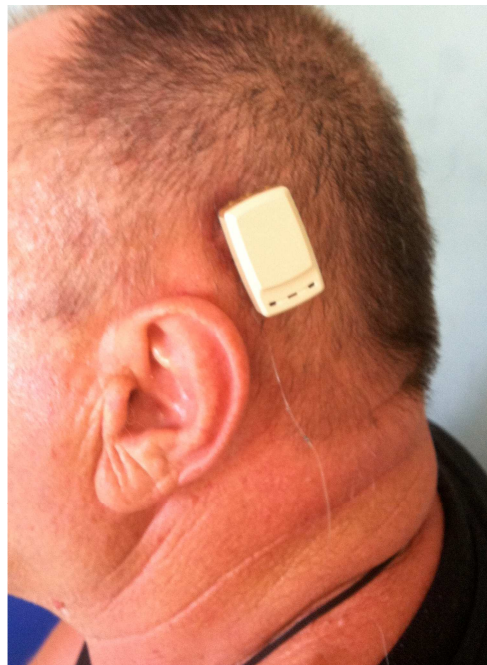
Slika 1. Uredan položaj titanijskoga implanta po završenom procesu osteintegracije (ugrađen BIA300 implant 4 mm w abutment 6 mm)