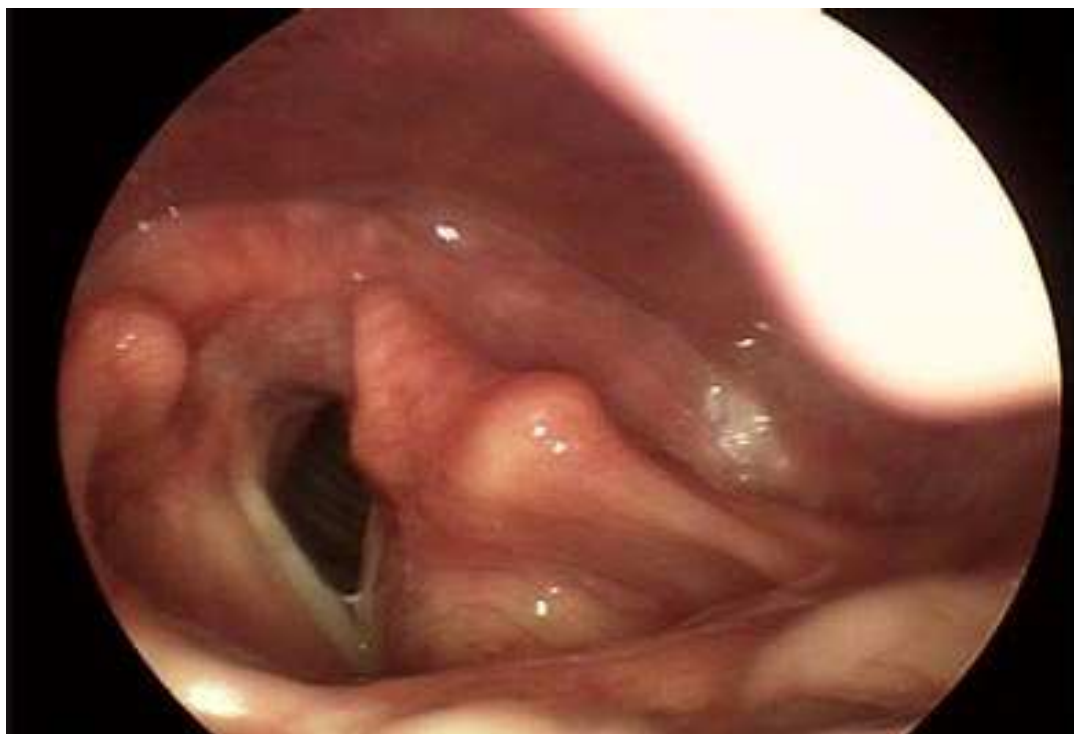
Slika 2. Fiberendoskopski prikaz lijeve paretične glasnice nakon ozljede povratnoga živca tijekom operacije Figure 2 Fibre endoscopic view of the left paretic vocal cord after the recurrent laryngeal nerve injury during the surgery