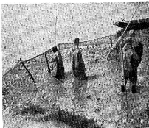
U mreži je 10 tona šarana