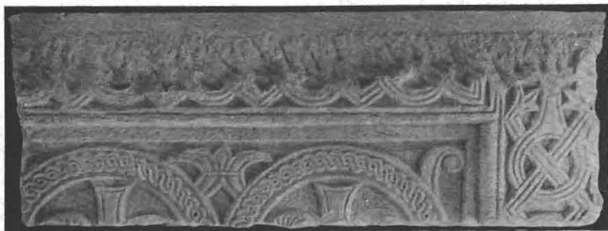
Sl. 3. Ulomak oltarne ograde iz stolne crkve u Splitu (sada u Arheološkom Muzeju).

ploča među njima. Pleterni ures stupića obično svršava ili prelazi u oblik križa, kako to vidimo na više komada iz Splita i okolice u splitskom arheološkom Muzeju 2) (slika 2.), a ploče-ograde, ispunjene geometrijskim motivima, križem i palmetama ispod lukova arkada i rijetko kad ljudskim likovima 3) , imaju obično samo na gornjem rubu široki, gdje god izbočeni i uvijek pleternom dekoracijom ispunjeni trak 4) (slika 4. na primjer predložuje nam ovakovu jednu ploču; komad je iz Trogira još neobjelodanjen). Katkad stupići nisu napose izrađeni, nego su ploča i pilaster u jednom komadu, to jest na istoj ploči se nalazi l. i d. dekorativni motiv stupića. Ovakovih oltarnih ograda klesar našega reljefa možda je vidio i u crkvi Srednjega Vijeka u samoj Žrnovnici (premda do danas još nemamo osta-