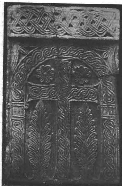
Sl. 4. Oltarna ograda ( pluteus ) iz Trogira (sada u lapidariju Sv. Ivana u Trogiru).

Nesumnjivo bila mu je poznata i ploča s likom narodnog vladara 6) slično uokvirena. I baš ovakove oltarne ograde mogle su biti i bile su našem