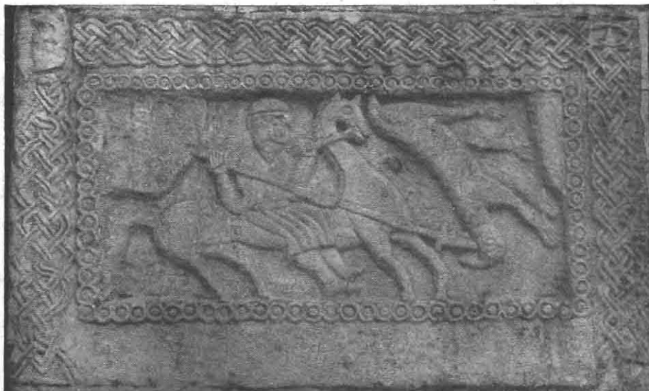
Sl. 1. Relijef na župnoj crkvi u Žrnovnici.

gornjem tijelu, samo od pasa dolje do preko koljena ima nekoliko širokih nabora. Jedino mu je oružje dugačko koplje, čiji je šiljak s prečkom nesumnjivo od željeza, dok držak moramo zamišljati od drva. Ni konj nije uspješnije izrađen od jahača. Njegov suviše dugačak trup čini nam se kao da je prelomljen likom jahača. Dok je glava na vitkom vratu s kratkom grivom prilično pogođena, potpuno su slabo isklesane konjske