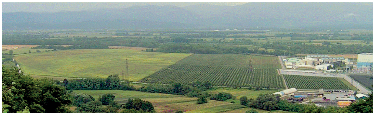
Slika 1. Lokacija budućeg slovenskog odlagališta nisko i srednjeradioaktivnog otpada, u neposrednoj blizini NEK (EGE, 2010).

venija ili neka druga) ili će sama ući u dugotrajan i složen posao izgradnje odlagališta. Jedna od opcija je svakako i podjela otpada nastalog u NEK, gdje bi Slovenija prihvatila odlaganje NSRAO, a Hrvatska VRAO. Premda se ova opcija čini naizgled nepovoljnom za Hrvatsku, količina VRAO je mala u odnosu na količinu NSRAO, a i „ponašanje“ VRAO je predvidljivije, obzirom na poznati i homogeni sastav, u odnosu na pepeo, organsku tvar, plastiku, papir i druge materijale koji se nalaze u sastavu NSRAO.