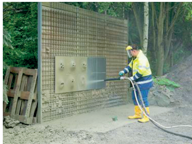
Slika 6. Poduka za ugradnju bentonita.

Praktični dio treninga uključivao je više zadataka vezanih uz istraživačke radove, ugradnju otpada i naknadnog opažanja (slika 6).