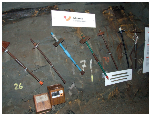
Slika 7. Izložci sustava podgrađivanja i oglašavanje sponzorskih tvrtki u UEF Josef.

Glavni razlog izgradnje PIL-ova svakako su znanja i iskustva koja se stječu radom u takvom objektu. Tijekom rada odlagališta RAO nužno je osigurati trajnost i funkcionalnost spremnika, bentonitnih i drugih inženjerskih barijera, a jedini način da se to ispita i nauči je rad u istraživačkom objektu, u naravnoj veličini. U realističnoj geološkoj sredini i uvjetima koji se mogu naći u odlagalištu RAO (Åspö Hard Rock Laboratory, 2004; Martin i dr. 2006; NEA, 2001; Martino i dr., 2006). Znanja i iskustva stečena kroz rad i tečejeve u PIL-u svakako su nezamjenjiva, osobito uzmemo li u obzir da se u njima razvijaju različite metode i oprema za podzemnu karakterizaciju i ispitivanje stijenske mase i inženjerskih barijera. Vjerojatno najveće prednosti PIL-ova su ispitivanje i razvoj konceptualnih i numeričkih modela procesa relevantnih za transport radionuklida kroz inženjerske barijere i stijensku masu. Istraživanja provedena u standardnim laboratorijima u većini slučajeva nedostatna su te ne mogu nadomjestiti in situ istraživanja.