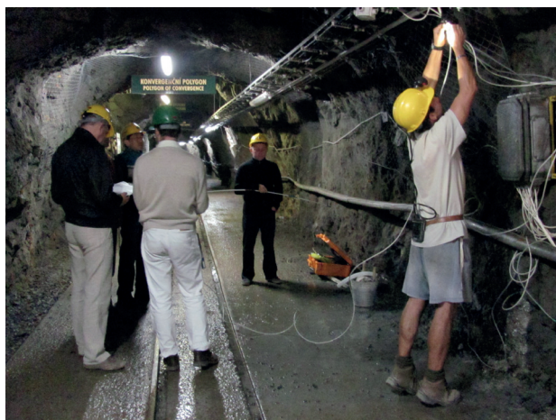
Slika 5. Ugradnja osjetila za insitu mjerenje temperature u stijeni u UEF Josef.

Podzemni objekt za edukaciju (Underground Educational Facility – UEF) Josef nije podzemni istraživački laboratorij u užem smislu. Organizirao ga je i njime upravlja Faculty of Civil Engineering, Czech Technical University – CTU u Pragu. Primarno je razvijen za obrazovne svrhe za studente CTU-a, ali jednako tako osigurava prostor i uvjete za različita ispitivanja, odnosno prostor za osnovne tečajeve vezane za projektiranje odlagališta RAO (slika 5).