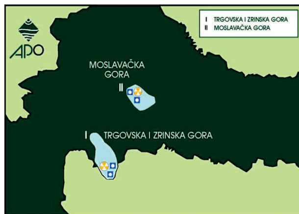
Slika 3. Preferentne lokacije odlagališta nisko i srednjeradioaktivnog otpada (Schaller, 1997).

Figure 2. Potential sites for low and medium radioactive waste repository within the seven potential areas (Schaller, 1997).