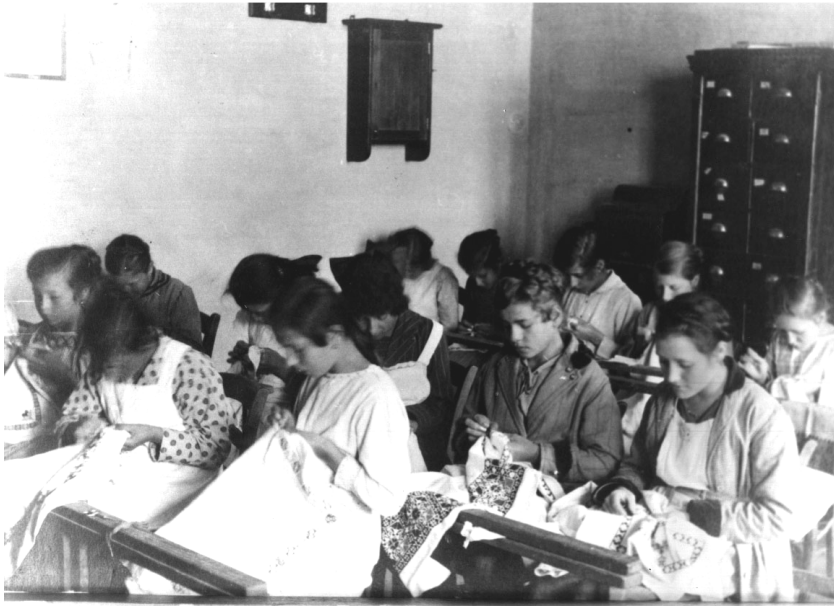
Rad u Obrtnoj školi 1918. godine