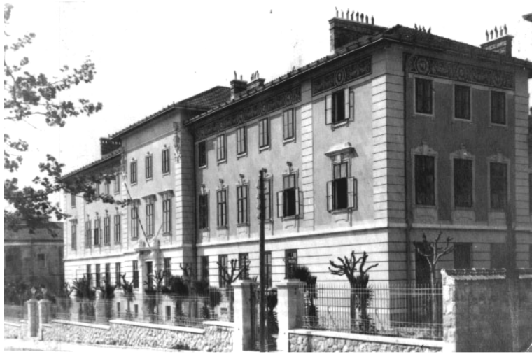
Zgrada Poljoprivredne a kasnije Tehničke škole kraj Arheološkog muzeja, gdje su Škola i Muzej preselili nakon I. svjetskog rata.