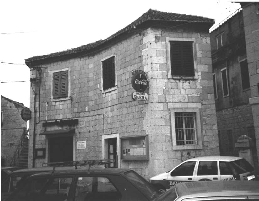
Bivša zgrada Škole na Lučcu, poslije tzv. željezničarska menza.