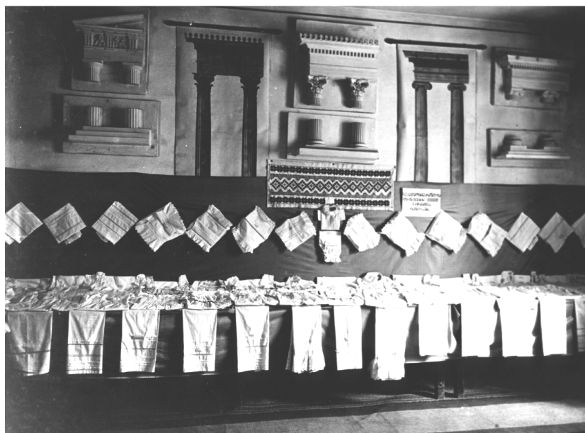
Detalj s jedne od godišnjih izložbi učeničkih radova Obrtne škole.