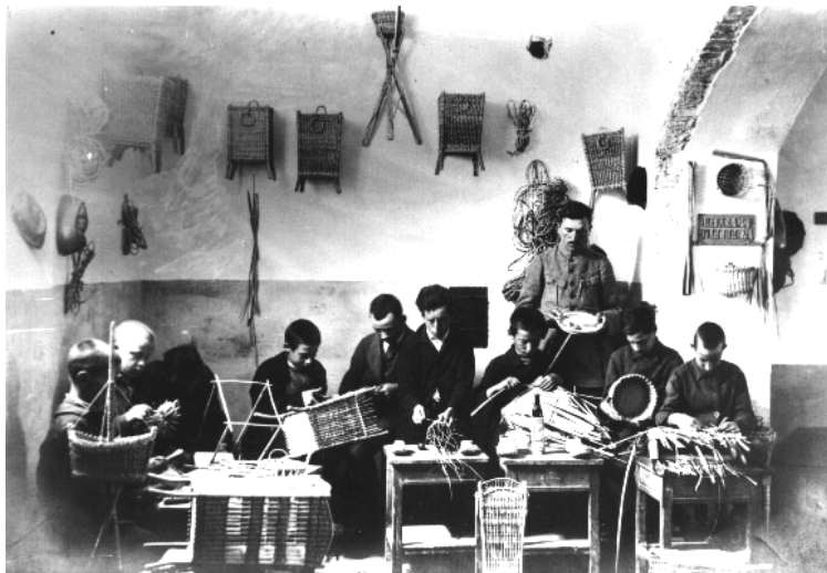
Rad u Obrtnoj školi. Daleko od europskog pojma dizajna.