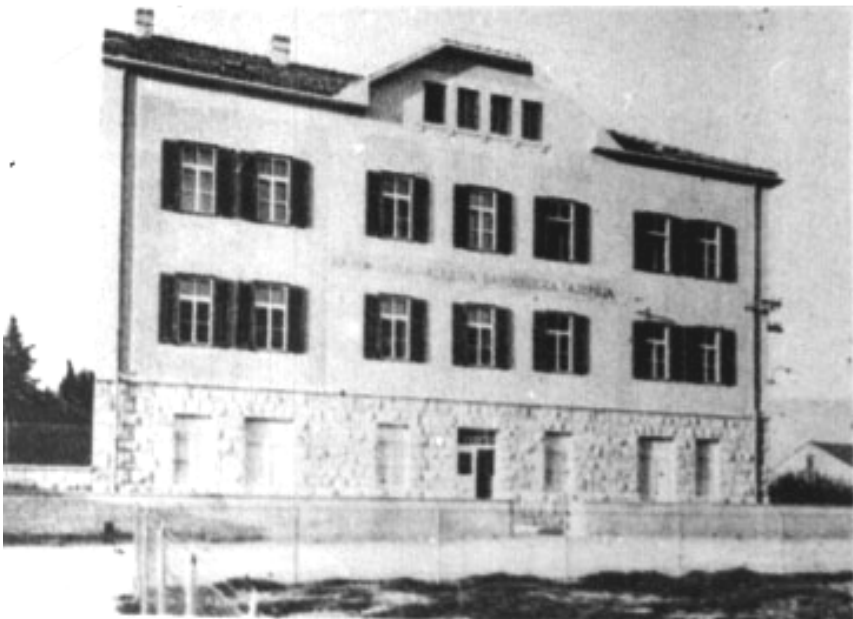
Zgrada Galerije umjetnina u kojoj je Tončić sakrivao umjetnine za vrijeme II. svjetskog rata.