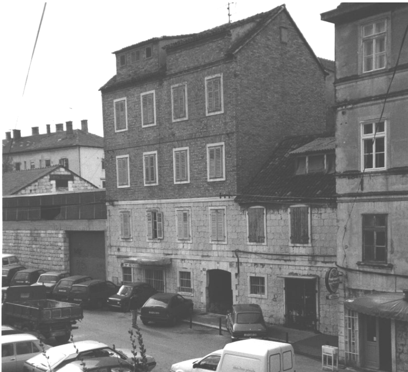
"Kuća Draganja", odmah do "kuće Bartulice", sastajalište umjetnika.