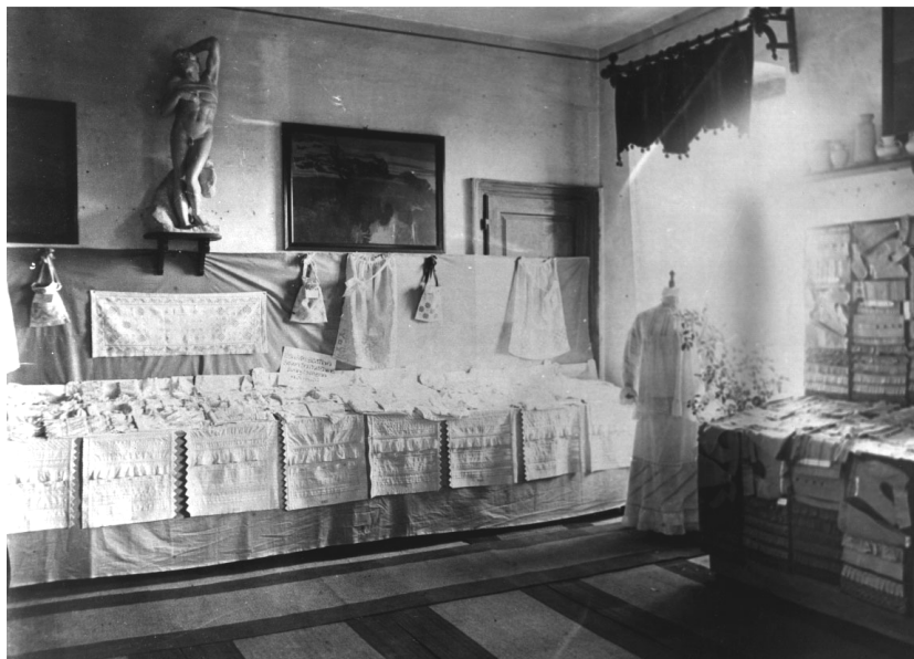
Detalj s jedne od godišnjih izložbi učeničkih radova Obrtne škole.