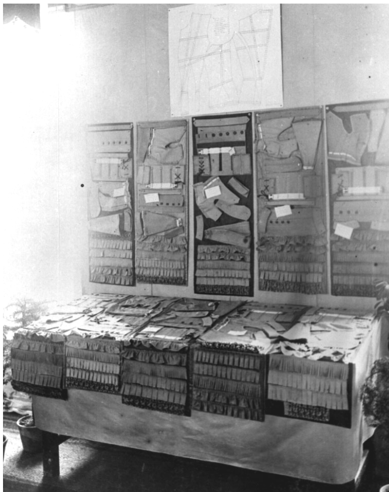
Detalj s jedne od prvih izložbi u Obrtnoj školi. Ovakvih vrijednih i sistematiziranih arhivskih snimaka ima podosta u Etnografskom muzeju i Muzeju grada Splita.