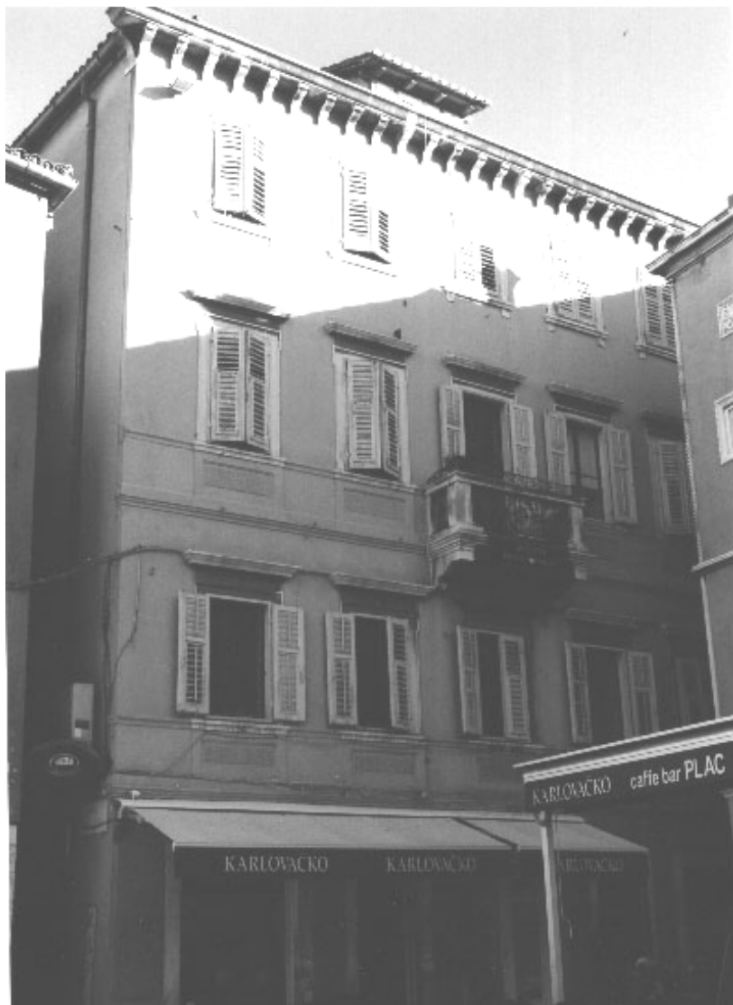
Zgrada Bračko-amerikanske banke, nekada i danas zgrada Etnografskog muzeja Split.