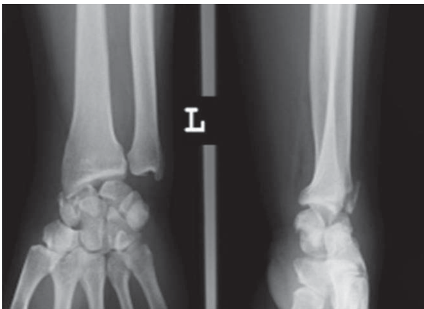
Slika 1 Primjer radiografskog nalaza prije operativnog zahvata.

Jedan bolesnik koji je pao s motora slomio je dva slabinska kralješka te je nastao prijelom stiloidnog nastavka ulne. Politraumatiziranom bolesniku ozlijeđenom u padu s motora, pri čemu je zadobio ozljedu glave, prsnog koša i prijelom prvoga slabinskog kralješka, ozljeda šake zbrinuta je odgođeno. Od ostalih pridruženih ozljeda dvoje bolesnika imalo je prijelome stiloidnog nastavka ulne, jedan prijelom triquetruma, jedan i prijelom distalnog radiusa te stiloidnog nastavka ulne, jedan prijelom distalnog radiusa, a jedan prijelom stiloidnog nastavka i triquetruma. Učinjene su nativne radiološke slike u standardnim i kosim projekcijama i uspoređene sa zdravom stranom. Radiološke snimke procjenjivali su i radiolozi specijalizirani za traumatske ozljeda, neovisno o operacijskom timu (slika 1.).