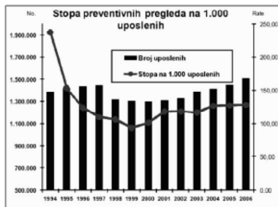
Grafikon 1. Preventivni pregledi u Hrvatskoj 1994. – 2006.

Zato imamo pred sobom novi Zakon. Grafički prikaz navedenih podataka vidljiv je na grafikovima Hrvatskog zavoda za javno zdravstvo.